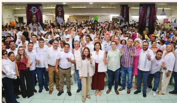
Presenta informe a más de 400 kilómetros de su distrito Otra vez el alcalde de Uruapan