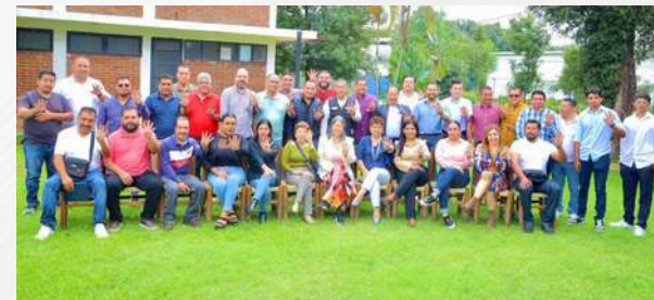
Respaldan al Senador Raúl en Uruapan

En Uruapan, el bloque de Morena que acompaña al senador Raúl Morón prometió trabajar más cerca de la gente. Bienvenido el compromiso, pero lo urgente no son mesas de diálogo, sino acciones tangibles. En próximos días llegará el informe del senador: momento ideal para contrastar discursos con resultados. Porque la política útil no vive de aplausos, sino de respuestas reales a los problemas sociales.