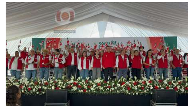
El PRI está de vuelta

En medio de la adversidad, el Partido Revolucionario Institucional en Michoacán toma oxígeno. En una mesa vecina se sentía la alegría —y hasta la emoción—; el color rojo predominaba y se alzaban las copas para celebrar el evento de Defensores de México, que estuvo bien nutrido e hizo sacar del clóset las chamarras y playeras que hacía rato no se usaban. Con la presencia de Jorge Meade Ocaranza, el tricolor puso en marcha a los Defensores de México. “¡Es la hora de la militancia!”, lanzó, casi a manera de decálogo, enumerando los males que —desde su narrativa— ha generado el régimen. Hombres y mujeres de probada lealtad, convicción ideológica y experiencia en la administración pública y cargos de elección. La apuesta: recuperar aquellos 650 mil votos que en 2012 dieron el último triunfo al priismo en Michoacán. Enhorabuena.