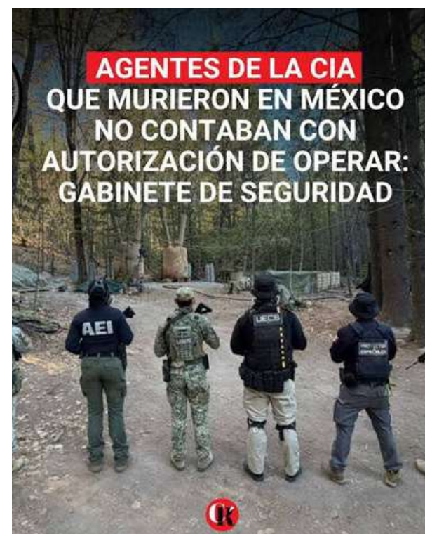
La CIA centro del debate por caso Chihuahua

Nos vamos, será hasta la próxima semana cuando estaremos de nuevo con ustedes. Ya sabe, si quiere ver y ser visto... véngase a Las Trojes, la alfombra roja de la capital.