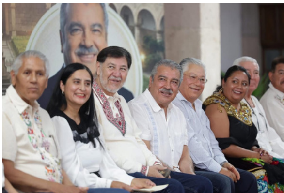
Morón aprieta el paso

viene encabezando Raúl Morón Orozco durante este fin de semana en distintos puntos de Michoacán. En el encuentro denominado "El Michoacán que queremos", el también senador insistió en la necesidad de fortalecer la unidad del movimiento y de los distintos sectores sociales para profundizar la Cuarta Transformación en el estado. Al evento asistieron ex moradores y egresados de la Universidad Michoacana de San Nicolás de Hidalgo, donde además se dieron cita cuadros políticos provenientes de distintas regiones del estado y de la capital michoacana. La actividad contó también con la presencia del senador Gerardo Fernández Noroña, quien acompañó el encuentro político y académico desarrollado este fin de semana.