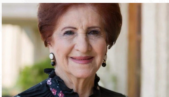
Los operadores del Sombrero

En la mesa nadie se sorprende demasiado. En política, muchas veces los operadores reales no son quienes aparecen en los reflectores, sino quienes construyen acuerdos, mueven estructuras y mantienen viva la operación territorial lejos de las cámaras.