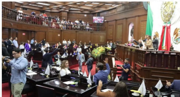
La reforma electoral en la conversación pública

reforma —especialmente Morena, por contar con la mayoría legislativa—: cuando las reglas parecen cambiarse para frenar a alguien en específico, el efecto suele ser exactamente el contrario.