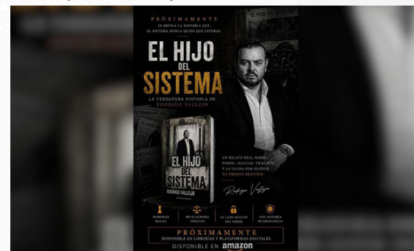
El Gerber cuenta su historia

Mientras tanto, en Las Trojes varios coincidían en algo: en Michoacán, el pasado político nunca permanece totalmente enterrado. Tarde o temprano siempre vuelve a sentarse a la