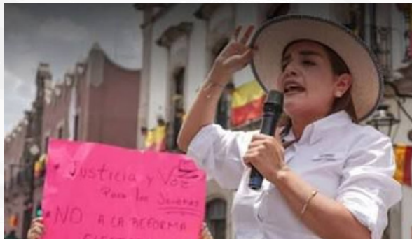
Nada detendrá al Sombrero

Y tiene razón: nada detiene a la política.