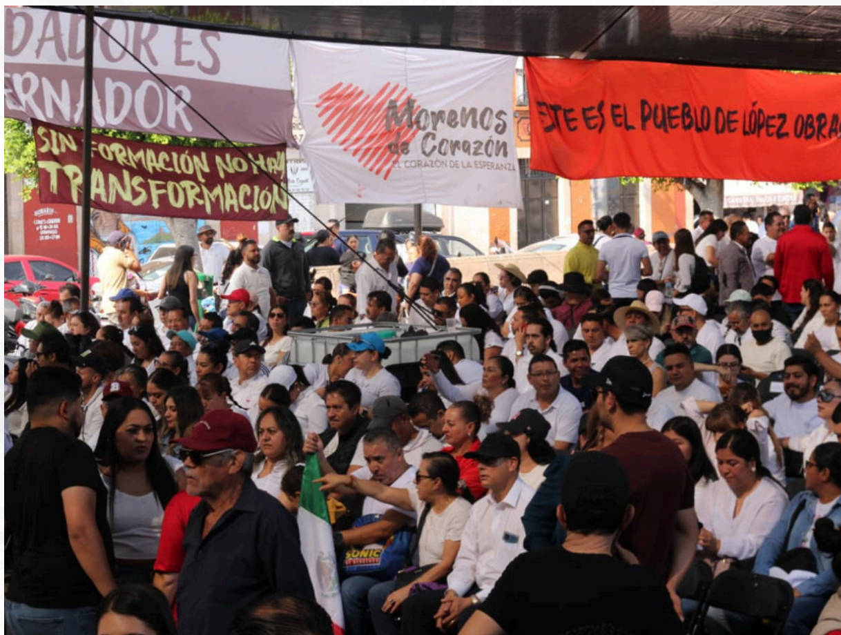
El evento de Claudia Sheinbaum