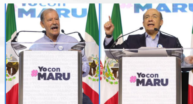
No me ayudes compadre

“Ahora es Maru. Creen que el país la convertirá en heroína nacional y que ha nacido la candidata ideal contra Morena. Qué equivocados están”.