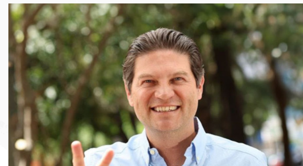
Tsunami de reacciones

Hoy presume como sello de distinción una icónica estilográfica Montblanc de colección, la cual saca lentamente del bolsillo de su saco y hace girar entre sus manos mientras sentencia: