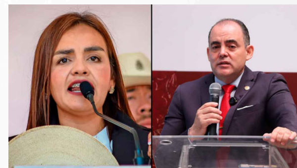
Punto para el Sombrero

Por eso, mientras algunos celebraban la medida, otros se preguntaban si habían calculado correctamente sus efectos. Porque una cosa es intentar aislar a un actor político y otra muy distinta es regalarle visibilidad, simpatía y conversación pública. Qué buena puntería.