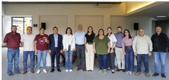
El Cónclave de Morena

Michoacán es una entidad estratégica para la Cuarta Transformación y, según se comenta, el Comité Ejecutivo Nacional no está dispuesto a permitir que las disputas internas, los divisionismos o las ambiciones personales pongan en riesgo el proyecto político. Quien no se discipline y continúe actuando por la libre podría quedar fuera de la ruta sucesoria.