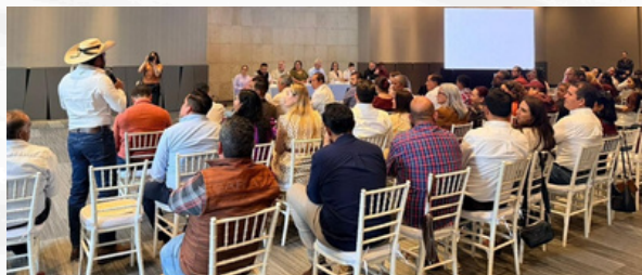
¿Quién perdió y quién ganó?

El resultado, a un año de las elecciones intermedias de 2027, es el que vino a reclamar el Comité Ejecutivo Nacional: conflicto, división y el riesgo de una derrota que hace apenas unos años parecía impensable para el movimiento en Michoacán.