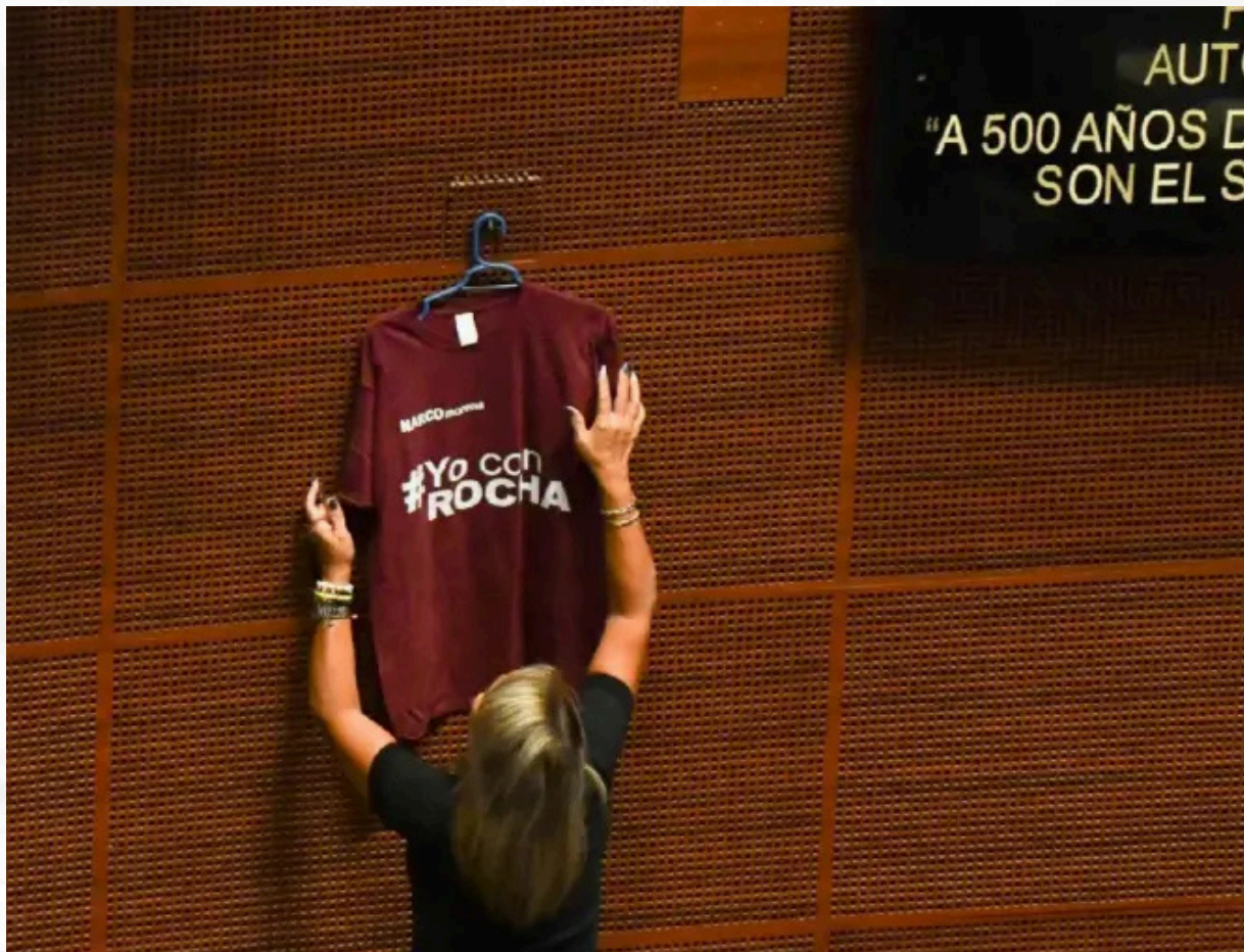
La narrativa del narcoestado