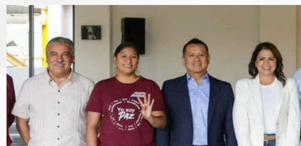
Los que siguen en la contienda

La reflexión provoca silencio en la mesa. Más allá de simpatías o preferencias, el mensaje parece ser que la dirigencia nacional busca concentrar la disputa en perfiles con estructura, posicionamiento y viabilidad real, dejando fuera las especulaciones y los proyectos construidos más desde la percepción que desde la fortaleza política efectiva.