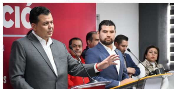
La batalla de los dirigentes

No faltó quien resumiera la escena con una imagen tan cruel como descriptiva: dos parroquianos discutiendo al final de la noche por la propiedad de una botella vacía.