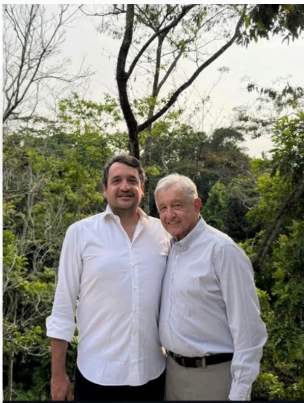
AMLO en el ruedo

Pocos líderes políticos conservan la capacidad de influir en la conversación nacional sin necesidad de estar diariamente en el escenario.