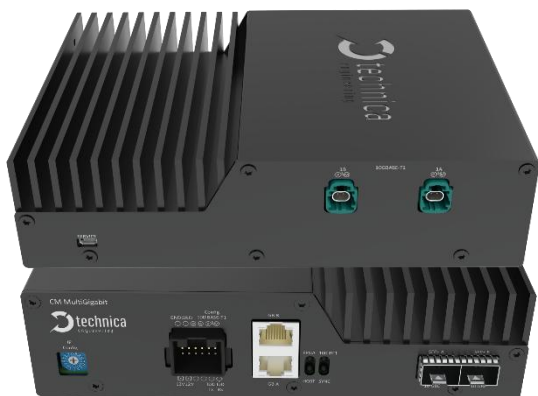
Capture Module MultiGigabit

Mehrere CMs können kombiniert und gemeinsam in einem Messaufbau verwendet werden. Die integrierte Funktion zur Zeitsynchronisation ermöglicht es, den gesamten Messaufbau auf dieselbe Zeitbasis zu stellen. Dadurch können auch andere IVN-Technologien in den Messaufbau leicht eingebunden werden und die Messsysteme mit CMs werden einfach skalierbar.