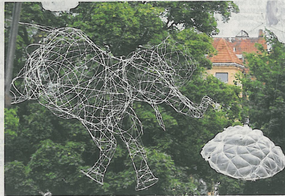
Beim Schaubuden Sommer fliegt auch mal ein Elefant durch die Luft.