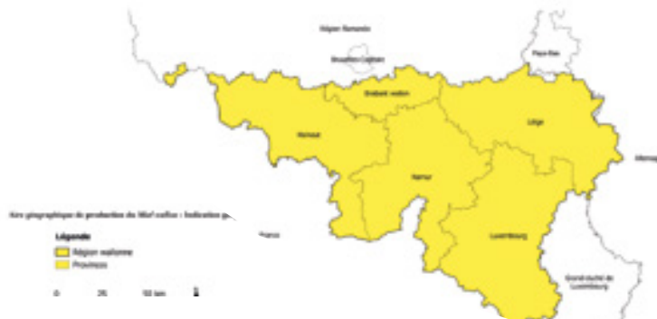
Figure 1 : Aire géographique de production du Miel wallon (IGP) définie dans le cahier des charges.

au lien : https://agriculture.wallonie.be/files/20182/21888/Dossier%20MW%20IGP.pdf . Voici un aperçu synthétique des principales mesures y figurant.