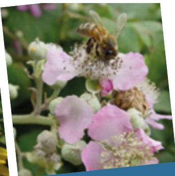
Ronces Brassica napus Rubus sp.