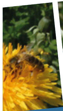
Pissenlit acum officinale