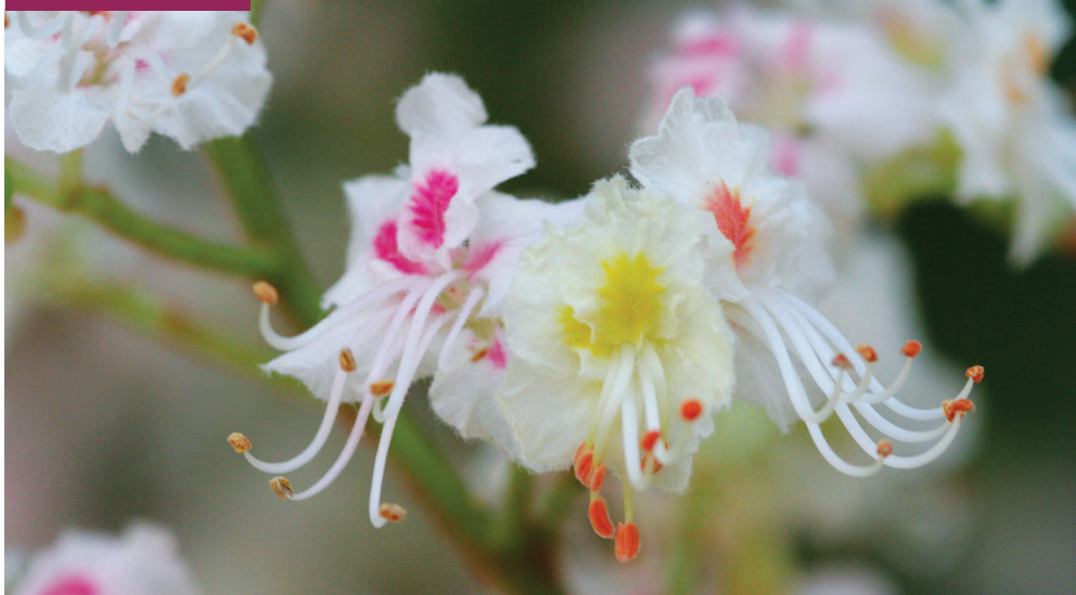
Fleurs de marronnier

Le mimétisme floral est un sujet très complexe qui ne fait d'ailleurs pas simplement entrer en jeu le canal visuel. Certaines plantes utilisent ce mode opératoire à des fins peu «honnêtes» du point de vue du pollinisateur. Elles miment le comportement des fleurs généreuses en nectar mais ne sont qu'un leurre. Naturellement, les pollinisateurs sont moins susceptibles de visiter plusieurs «fleurs ingrates» de la même plante mais la stratégie est tout de même payante pour la plante qui dépense moins en énergie pour produire de la nourriture et qui obtient une bonne probabilité de pollinisation croisée. Ainsi, on évalue à un tiers les espèces d'orchidées qui n'offrent aucune récom-