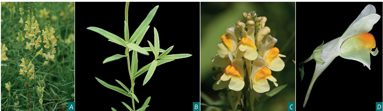
Figure 2 : Plants (A), feuilles (B), inflorescence (C) et fleur isolée (D) de Linaria vulgaris .