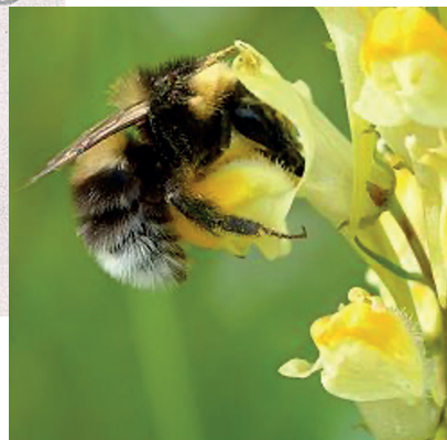
Figure 3 : Fleurs de Linaria vulgaris visitées par un bourdon. Sources : Philipp Gönner (nach den Entwürfen von), Brendel's Blütenbiologische Wandtafeln, s.d. [avant 1936], 12 p. ; Ivar Leidus - CC BY-SA 4.0

La quantité de nectar et sa concentration en sucres (saccharose, glucose,