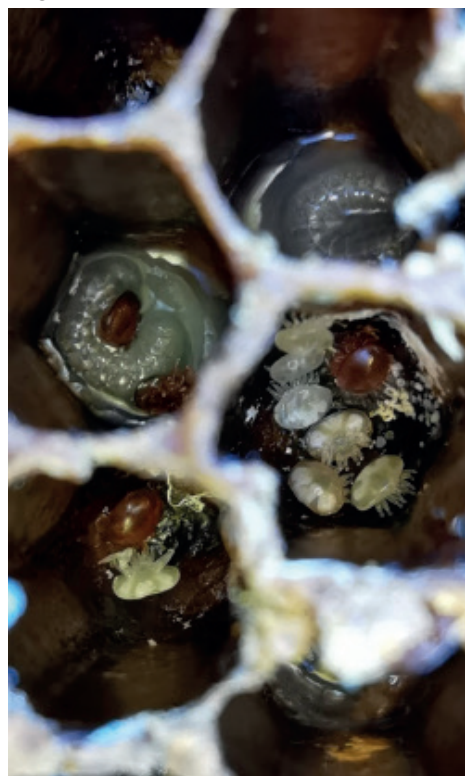
Fig. 1 : Cellules de couvain avec famille de Varroa

deux facteurs : la plus forte production de phéromones par les larves de faux-bourçons et un soin plus fréquent par les nourrices porteuses du parasite. Ces phéromones sont produites par les larves pour induire l'operculation de la cellule et perçues par Varroa pour qu'il rentre au moment opportun dans la cellule.