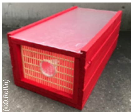
Red trap, piège à sélection physique de type « nasse »

Dès le mois de juillet , la prédation sur les colonies d'abeilles commence et les ruchers doivent être protégés en conséquence. Toutefois, privilégiez la mise en place de méthodes de lutte uniquement si de la prédation est observée, car certaines méthodes peuvent être contre-productives en l'absence de frelon asiatique en chasse sur votre rucher.