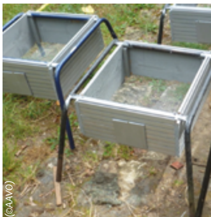
Jupe à grillage pour protection sous la ruche