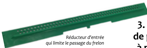
Réducteur d'entrée qui limite le passage du frelon