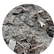
Recyclage (verre, mâchefers, bois, démolition)