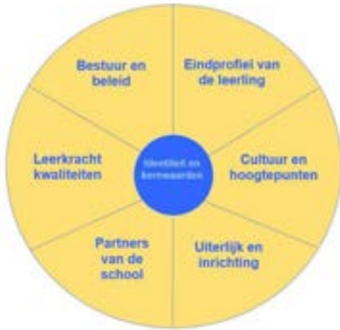
Figuur 1: Zes gebieden rond onze identiteit en kernwaarden.