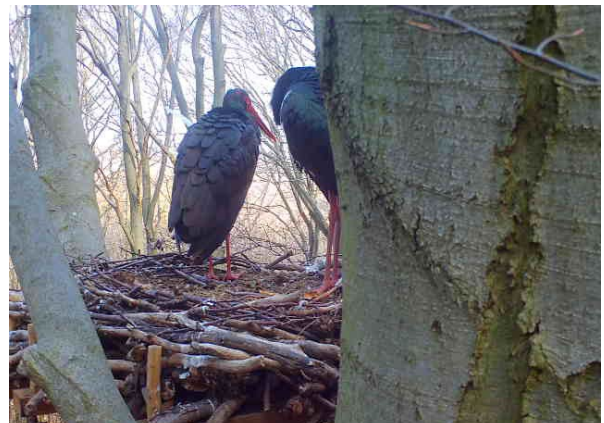
Die Wildkamera der SUNK hat gut zu tun. Mehr dieser Fotos auf Instagram @umweltstiftung.lsa.

Mit der erfolgreichen Rückkehr der Schwarzstörche zeigt sich, wie wichtig der Schutz intakter Lebensräume für seltene Arten ist, erklärt