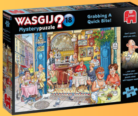
Casse-tête Wasgij Mystery #18 Une bouchée pour chacun!