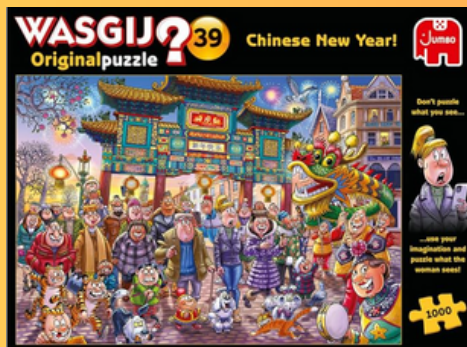
Casse-tête Wasgij Original #39 Nouvel an Chinois