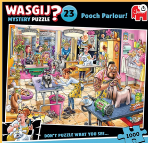
Casse-tête Wasgij Mystery #23 Salon de toilettage