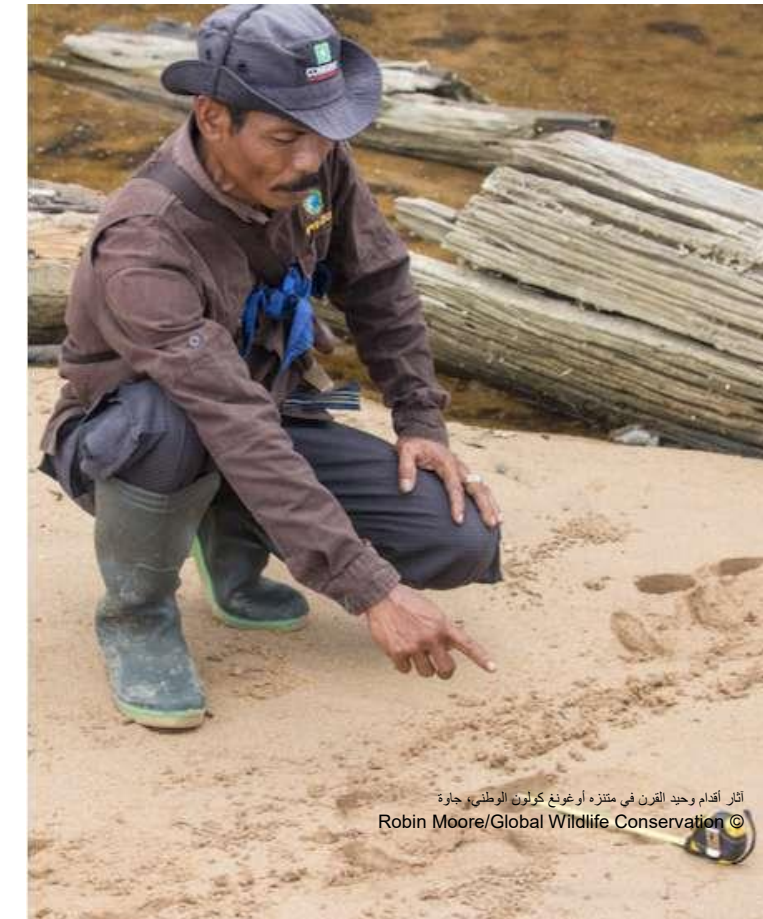
أثار أقدم وحيد القرن في منتزه أوغونغ كولون الوطني، جاوة

المهارات والسلوكيات الشخصية الأساسية القيادة، التواصل، العمل الجماعي، التفكير النقدي، التفكير في الأنظمة، القدرة على التكيف