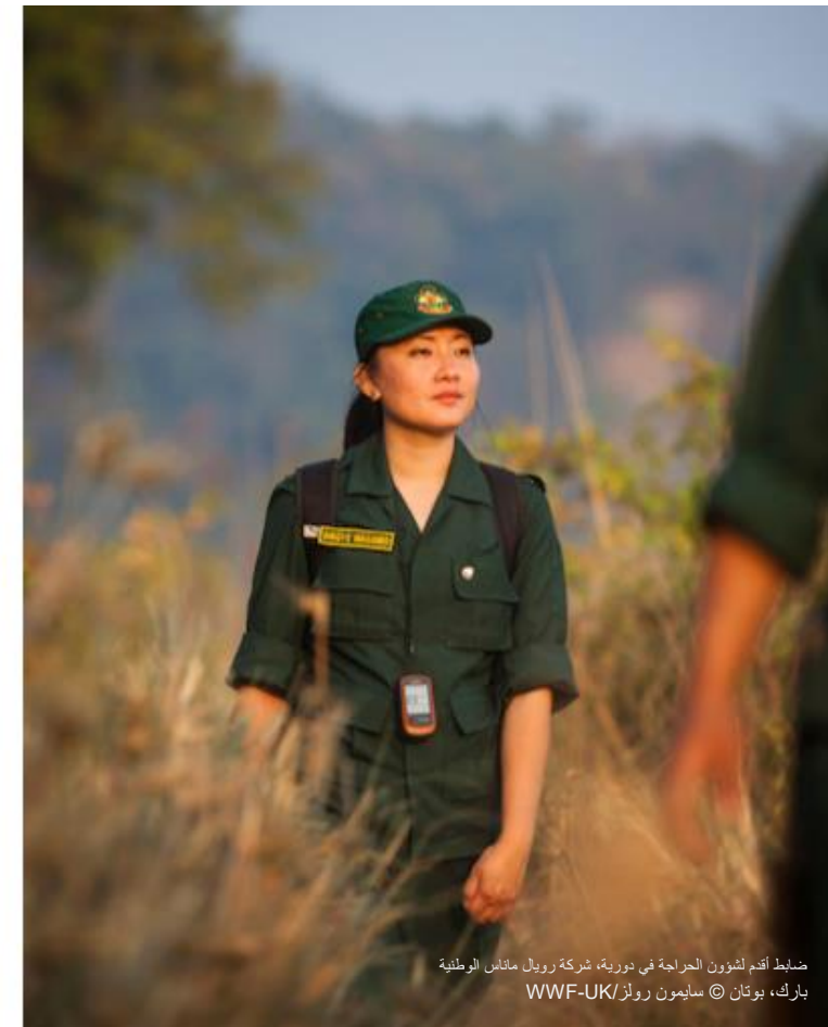
ضابط أقدم لشؤون الحراجة في دورية، شركة رويل ماناس الوطنية بارك، بوتان

تضمن المهارات القدرة على أداء المهمة بشكل موثوق ومتسق، وتوفير المعرفة فهما للخلفية التقنية والنظرية للمهمة، ومع الموقف الصحيح يكمل الفرد المهمة بشكل إيجابي ومحترف وأخلاقي وواع بحذر.