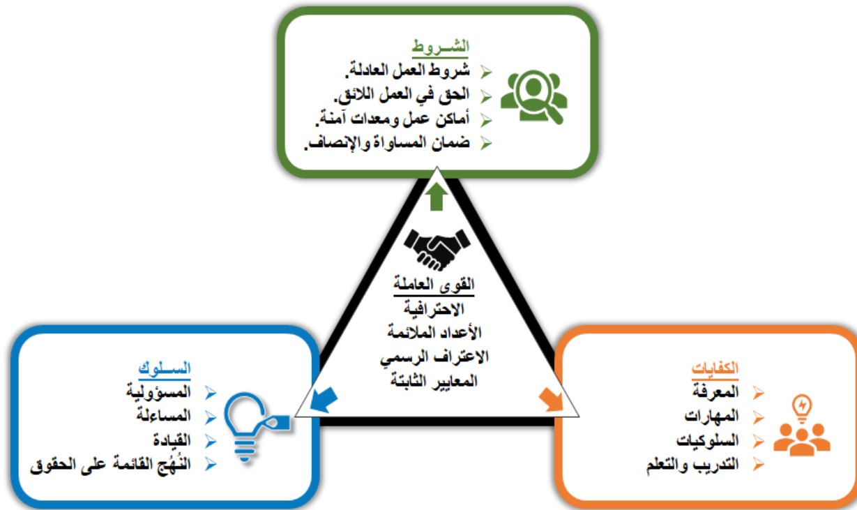
الشكل ١. إطار عمل الجوالين ٣٠ في ٣٠

وتستكمل الكفايات وتمدد "الكفاءات الأساسية الشاملة" للجوالين المتفق عليها في مؤتمر الاتحاد الدولي للجوالين في منتزه كروغر الوطني، جنوب أفريقيا، في عام ٢٠٠٠ (٣)