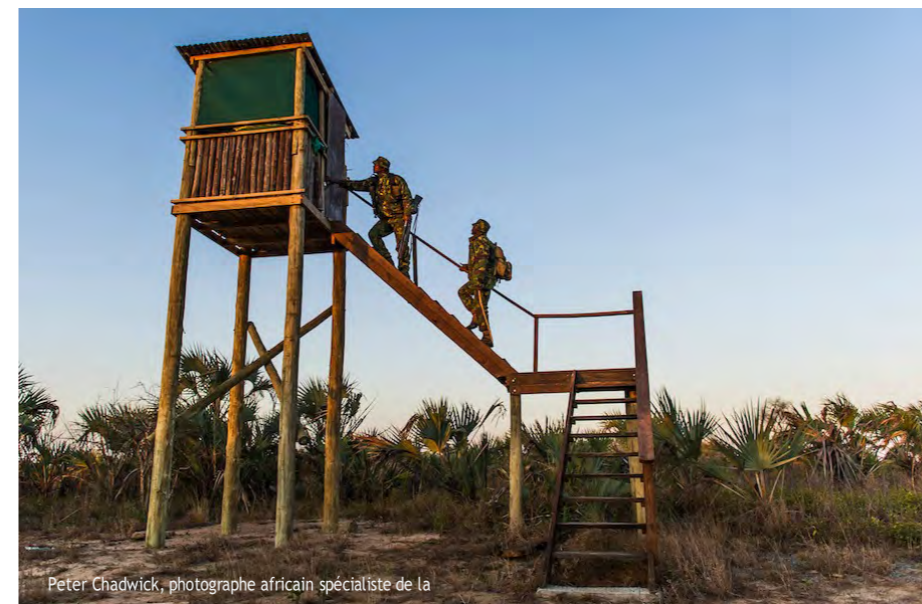
Peter Chadwick, photographe africain spécialiste de la

Maggs, G., Appleton, M.R., Long, B. et Young, R.P. (eds.) (2021). Un registre mondial des compétences pour les praticiens de la restauration des espèces menacées : une liste complète des compétences, des connaissances et des attributs personnels requis par les praticiens travaillant dans le domaine de la restauration des espèces menacées. Gland, Suisse : UICN. https://portals.iucn.org/library/sites/library/files/documents/2021-019-En.pdf