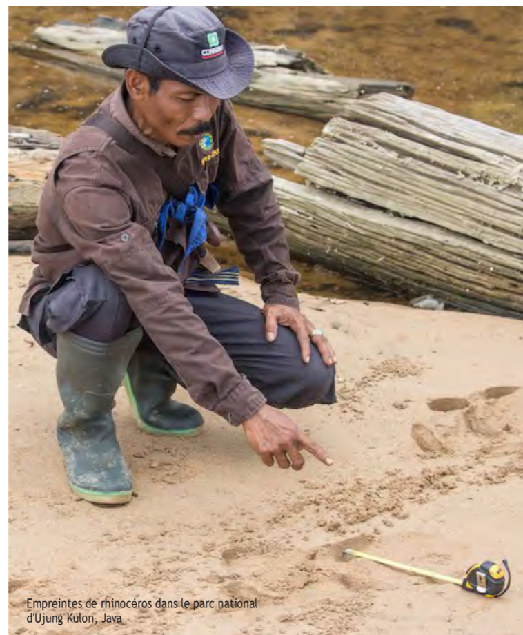
Empreintes de rhinocéros dans le parc national d'Ujung Kulon, Java