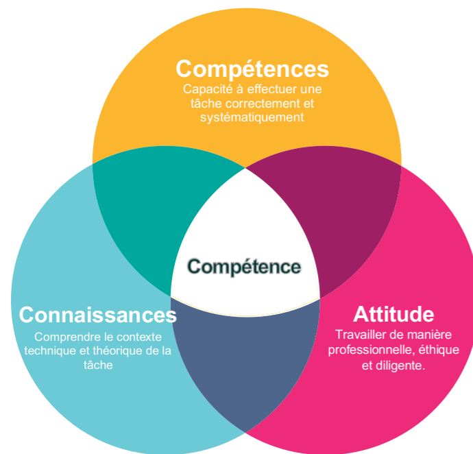
Figure 3 - Le modèle aptitudes-connaissances-attitudes pour les compétences 6

Compétences et comportements personnels fondamentaux Leadership, communication, travail d'équipe, pensée critique, pensée systémique, adaptabilité