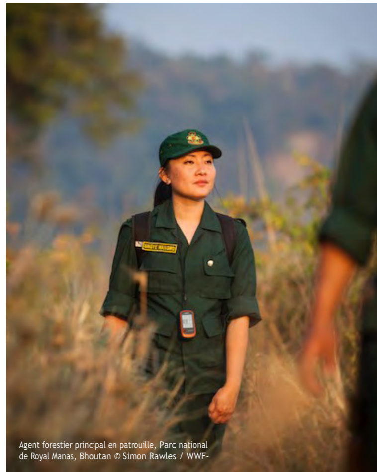
Agent forestier principal en patrouille, Parc national de Royal Manas, Bhoutan

Compétences et comportements personnels fondamentaux Leadership, communication, travail d'équipe, pensée critique, pensée systémique, adaptabilité