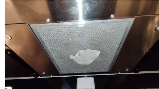
Funksjonstest av ventilator.

Det er avtrekk ut via det balanserte ventilasjonsanlegget.