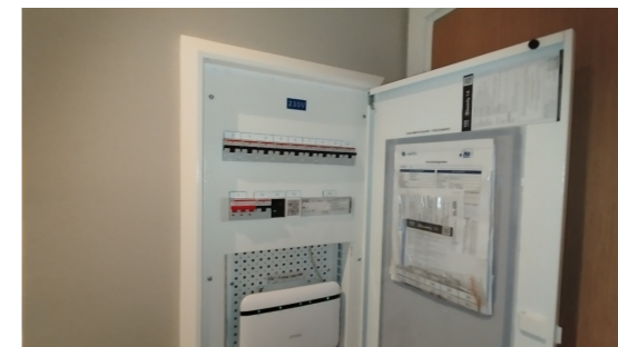
Kontroll av el-skap.

Anlegget er av relativt ny dato, og har utstedt samsvarserklæring. Det anses derfor ikke som nødvendig med utvidet kontroll av el-anlegget.