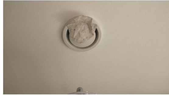
Funksjonstest av avtrekk.