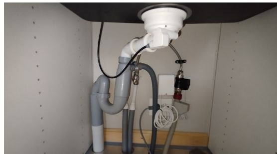
Kontroll av røropplegg.

Det ble utført fuktsøk ved kjøleskap, oppvaskmaskin og vask, og det ble ikke registrert markante avvik i ledningsevnen til overflatematerialet.