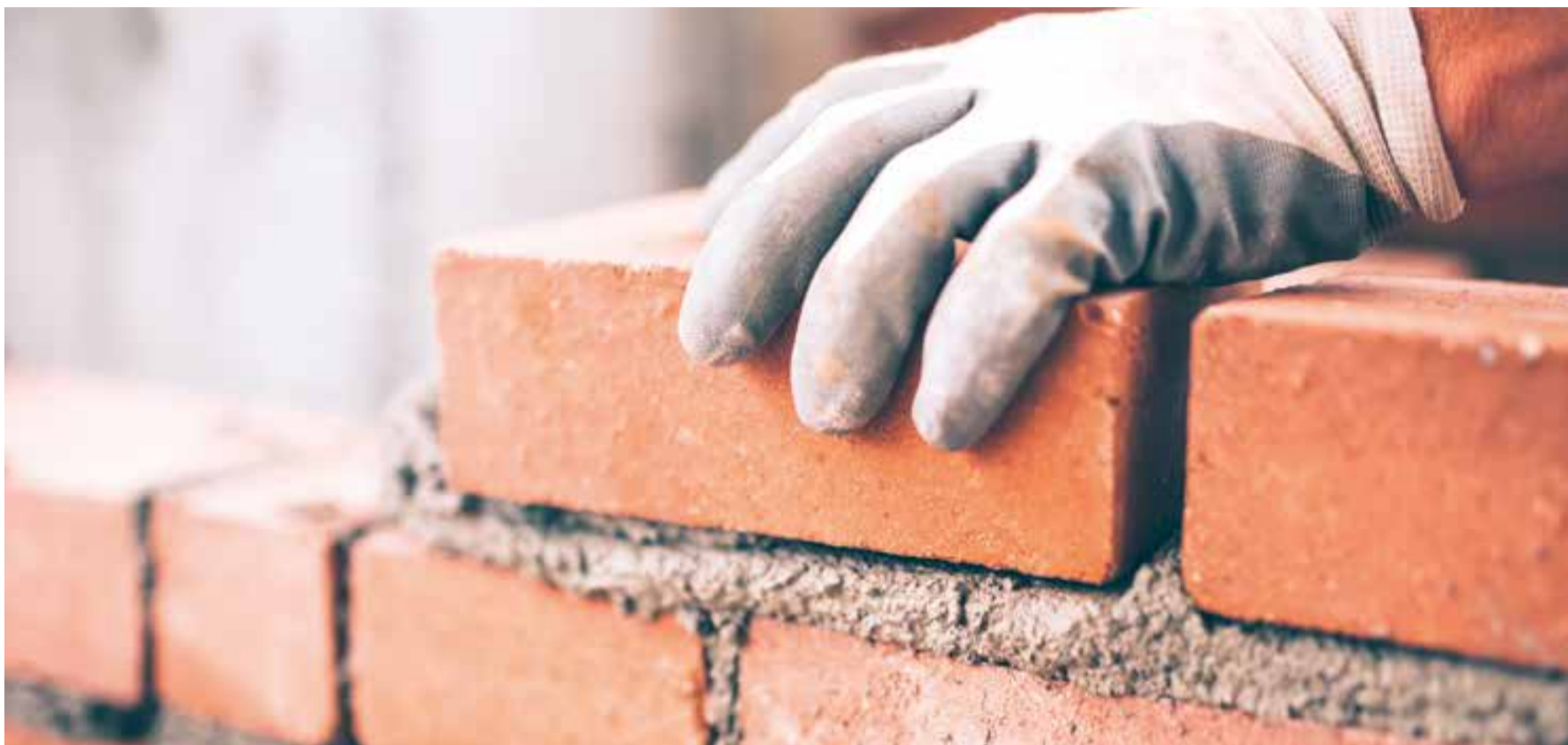
Bauberufe stehen bei den Jugendlichen nicht an erster Stelle

Die offizielle Gewerbezeitung des Bezirksgewerbeverbandes Bülach, Gewerbe- und Industrieverein Bachenbülach, Gewerbeverein Bassersdorf Nürensdorf, Gewerbe Bülach, gewerbe industrie dietlikon, Gewerbeverein Eglisau, Gewerbeverein Embrachertal, Gewerbeverein Höri, Gewerbe Kloten, Gewerbeverein Opfikon-Glattbrugg, Gewerbeverein Wallisellen und Gewerbeverein Winkel.