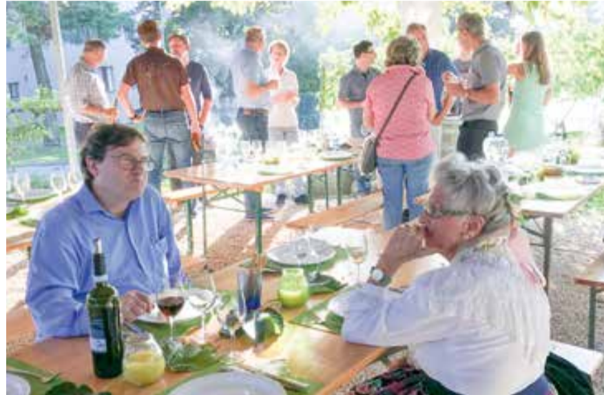
Zwar nicht mehr aktiv, aber immer noch dabei: Mutter und Sohn Künzli beim Aperitif

Nach einem halben Jahr Stillstand konnte der Gewerbeverein Opfikon-Glattbrugg (GVOG) endlich wieder eine Veranstaltung durchführen!