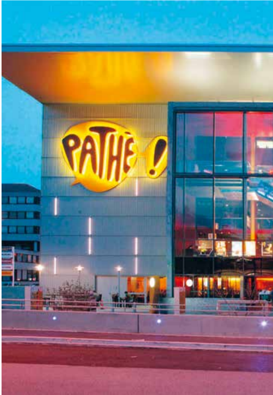
Das Pathé Dietlikon von aussen