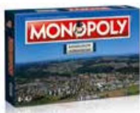
Die regionale Geschenk-Idee: Monopoly Bassersdorf Nürensdorf

GEWERBEVEREIN GVBN BASSERSDORF NÜRENSDORF Postfach 234 8303 Bassersdorf www.gvbn.ch