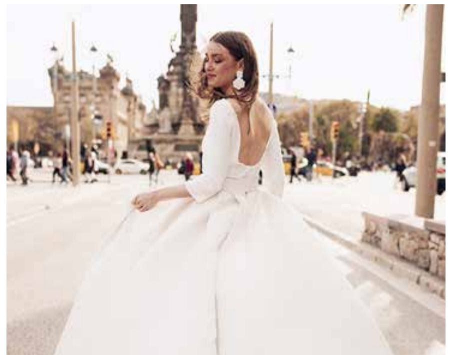
Das Brautkleid findet die Braut, wird gesagt – Brautkleid von Lilian West