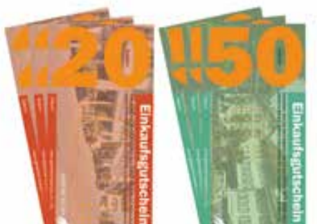
Gutscheine helfen dem Gewerbe

Phaenomenon-aurum Schaffhauserstrasse 37, 8180 Bülach