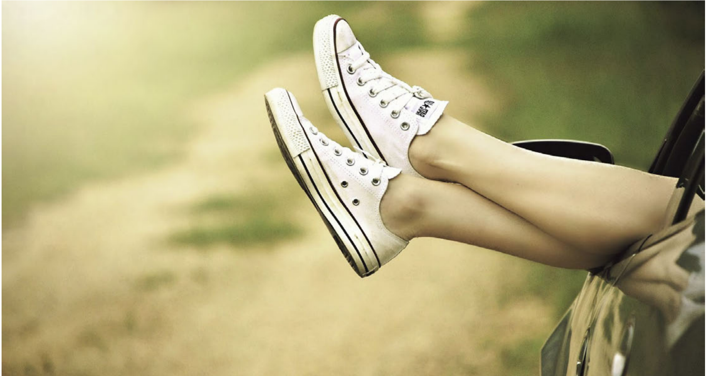
Am fünften Tag ausruhen – das Arbeitsmodell der Zukunft?