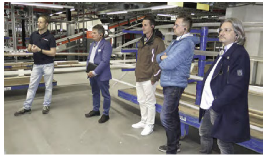
Spannende Führung durch das Logistikzentrum von OPO Oeschger AG

044 590 20 12 info@seidelpartner.ch www.seidelpartner.ch