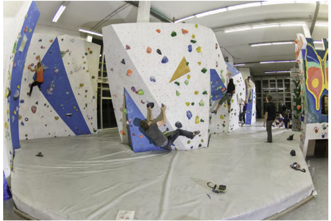
Beim Bouldern werden Kraft, Beweglichkeit und Koordination trainiert.

In der Boulderhalle in Bassersdorf klettern Kinder und Erwachsene an farbigen Griffen die Wände hoch. Ein vielseitiges Kursangebot sorgt für Spass, Training und Sicherheit.