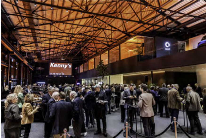
VIP-Eröffnungsabend bei Kenny's Auto-Center in Dietlikon.

Darüber hinaus entdeckten die Besuchergruppen auf der Erkundungstour einen exklusiven smart-Showroom für die zukünftigen smart-#1-Modelle, welcher Platz für fünf smart-Modelle bietet. Das Spezielle daran ist die Lage in der hoch gelegenen Galerie. Bei Kenny's fühlen sich die