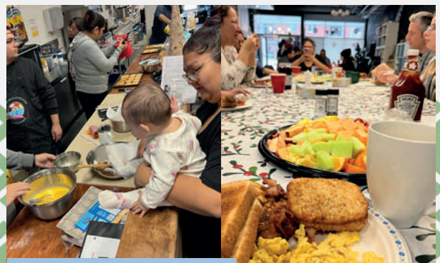
Makusham et déjeuner de Noël