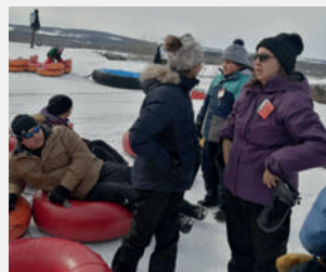
Glissade au Mont-Gleason