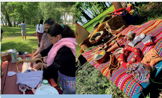
Cérémonies du nouveau-né et des premiers pas