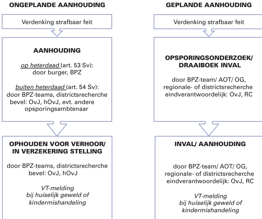
Figuur 2.1: Schematische weergave van het verloop van ongeplande en geplande aanhoudingen en de betrokken actoren in elke afzonderlijke fase

bevorderlijk is voor een veilige situatie voor het kind, worden VT en de politie gestimuleerd om gezamenlijk actie te ondernemen.