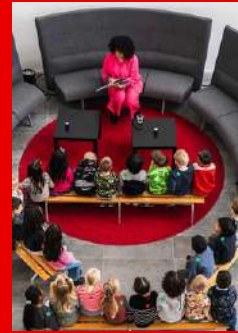
VISIE EN MISSIE