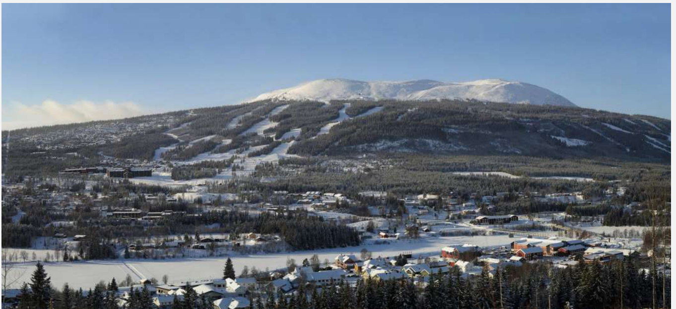
Trysil i Norge.