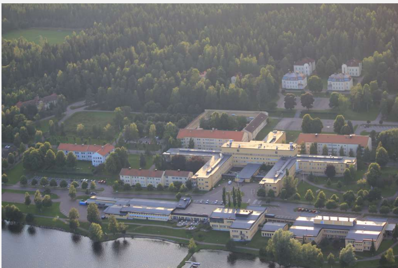
Psykiatriska i Säter

Jag har bott i nästan hela Sverige inom psykiatrin. I Uppsala, i Vadstena, på Gotland och jag har även varit och tittat på ett ställe i Norge, men där bodde jag inte. Jag har varit på Sätters sjukhus och psykiatrin i Falun. I Sä-