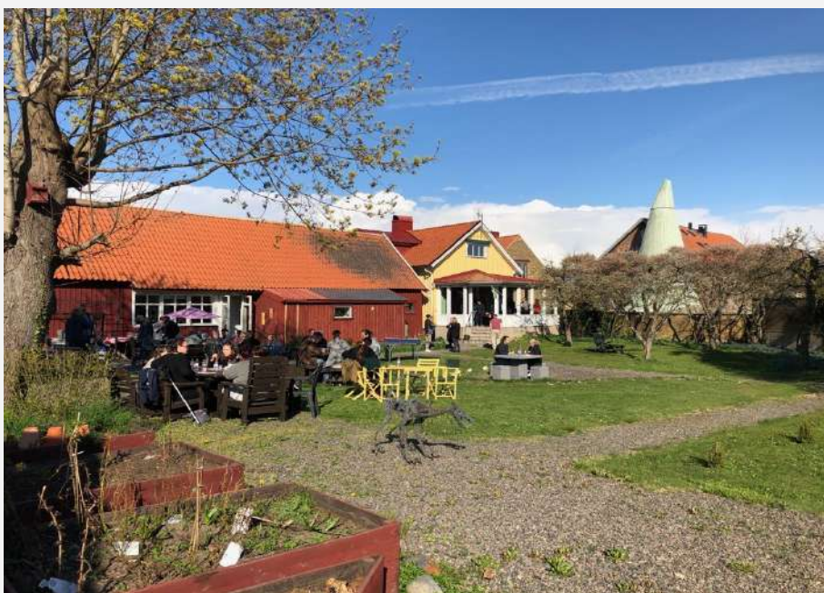
Fontänhuset i Falkenberg.