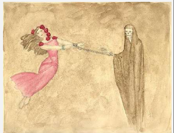
Akvarell av Karin Boye

Jag känner det som att jag är under attack.