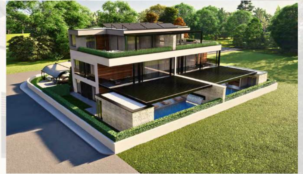
4 Wohnungen in einem Gebäude