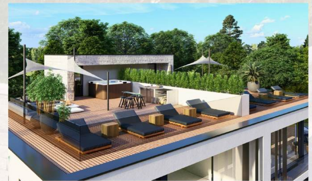
Wahl zwischen Garten oder Dachterrasse