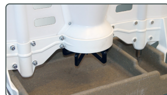
Maximat Weaner Poly

Identisk med Weaner, men fodertruget er støbt i polyesterbeton med foderplateau og separat vandtrug.