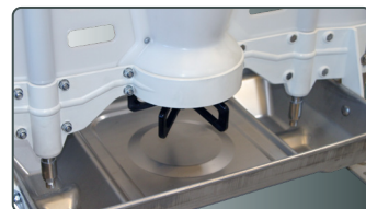
Maximat Porker 15-115 kg

MaxiMat® Porker er designet og konstrueret ud fra principper omkring rengøringsvenlighed, robusthed og høj grad af hygiejne. MaxiMat® Porker er udstyret med et rustfrit trug samt drikkekar på begge sider af fodertruget. Automaten kan betjene ca. 50 slagtesvin.