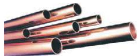
TUBO RIGIDO COBRE