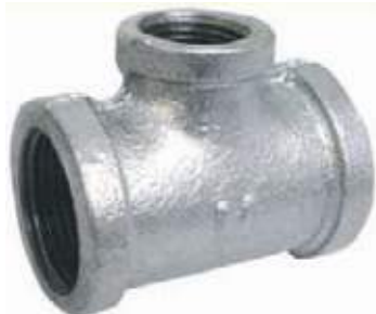
TEE REDUCIDA GALVANIZADA