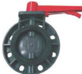
VÁLVULA MARIPOSA PVC TIPO WAFER