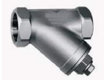
FILTRO Y SS304 NPT T150L