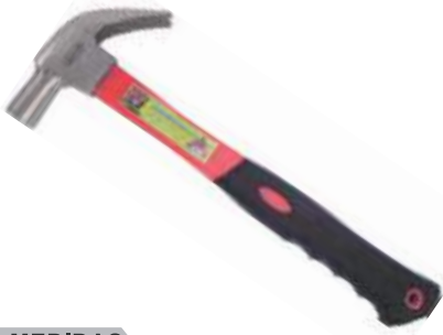
MARTILLO UÑA ACERO FORJADO PULIDO MANGO F/VIDRIO