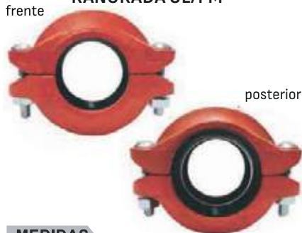
UNION REDUCIDA HD RANURADA UL/FM