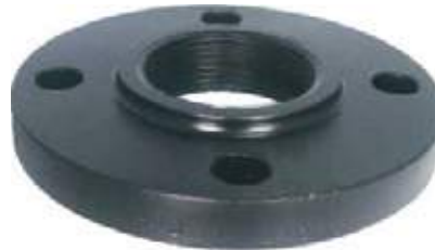
FLANCHES ROSCADOS NPT ACERO CARBON - HIERRO FUNDIDO