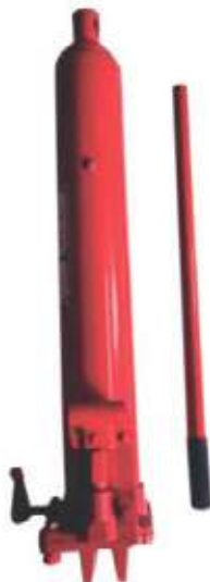
GATO HIDRÁULICO LARGO