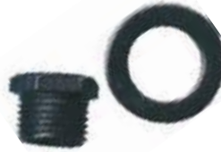
BUJE ADAPTADOR PARA SIERRACOPA

MEDIDAS REDONDO - HEXAGONAL 1/4" - 7/16"