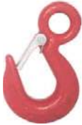
GANCHO LEVANTE CARGA AC/ FORJADO