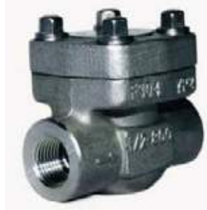
CHEQUE GLOBO SS304