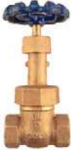
MEDIDAS DECA FIG 060/63 150L/300L - 1/4" - 4"