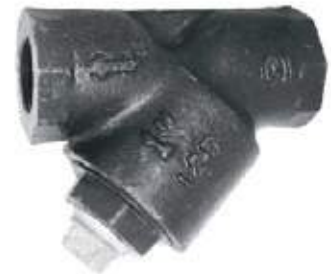
FILTRO Y HO NPT 150L