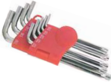
JUEGOS LLAVES TORX