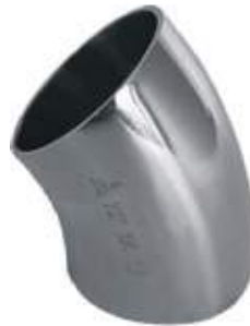
SEMICODO SS304 SANITARIO