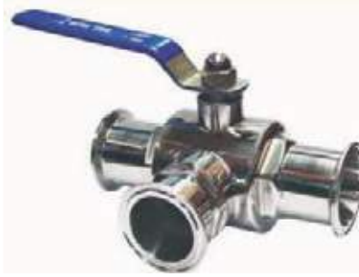
VALVULA BOLA 3 VIAS SANITARIA CLAMP