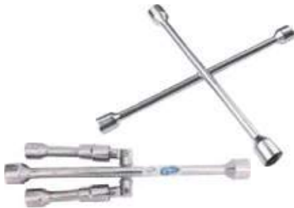
CRUCETA PARA PERNOS FIJA Y PLEGADIZA