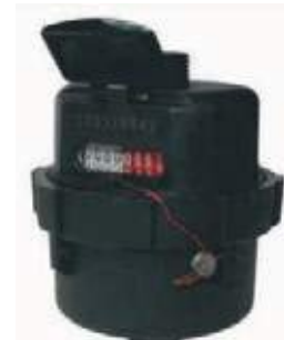
CONTADOR AGUA PLASTICO VOLUMETRICO