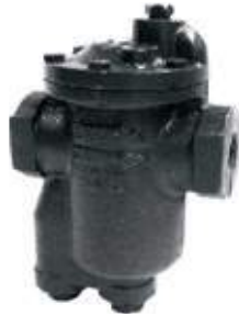
TRAMPA BALDE INVERTIDO HO