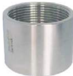
UNIÓN LISA SS304 NPT 150L