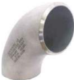
CODO SS304/316 PARA SOLDAR