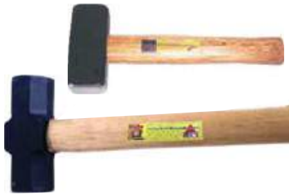
MACETA/MAZO ACERO FORJADO MANGO MADERA