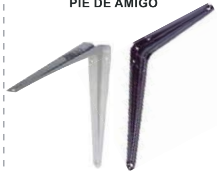
PIE DE AMIGO