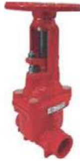
VALV CORTINA HD RANURADA UL/FM