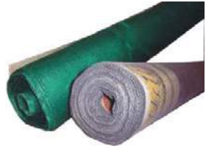
MALLA FIBRA VIDRIO