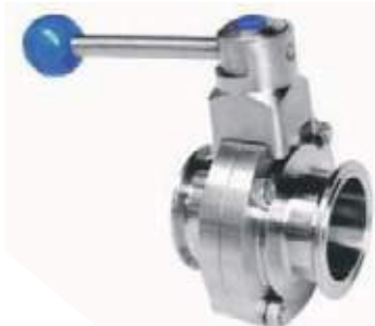
VÁLVULA MARIPOSA SS304 SANITARIA CLAMP