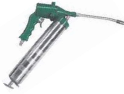
ENGRASADORA NEUMÁTICA HYQ11/RP 8043