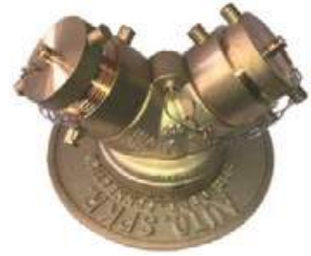
SIAMESA RECTANGULAR CUERPO HO Y BR PLACA BR