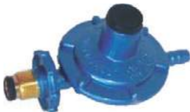
REGULADOR PARA CILINDRO DE GASDOMESTICOS