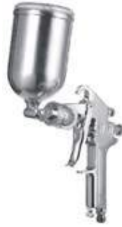
AERÓGRAFO ALTA PRESIÓN TIPO W-71.