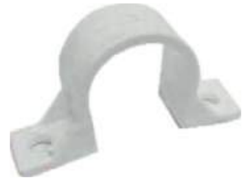
ABRAZADERA PLASTICA BLANCA DOBLE ALETA