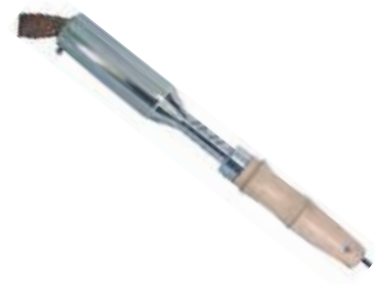
CAUTÍN MADERA PUNTA PLANA PESADO