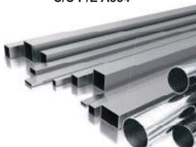
TUBO SS304 ESTRUCTURAL. C/C P/E A554