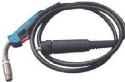
PISTOLA PARA MIG 230 AMP