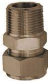
ADAPTADOR MACHO BR PEX AL PEX