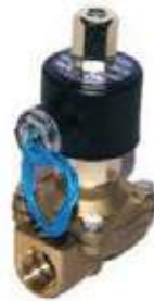
VÁLVULA SOLENOIDE ABIERTA BR USO GENERAL