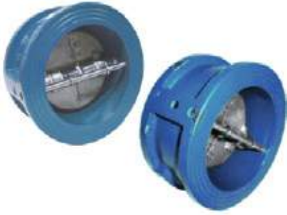
DUOCHEQUE HO DISCO INOX