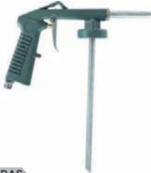
PISTOLA PARA BODY SHUT PS8