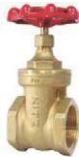
MEDIDAS AKFH/KITZ 125L \ 1/4" - 3"