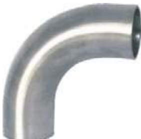
CODO LARGO SS304 SANITARIO