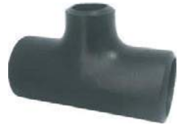
TEE REDUCIDA AC/PS