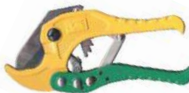
TIJERA PARA TUBO PEX AL PEX