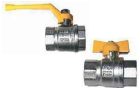
VALVULA DE BOLA PARA GAS