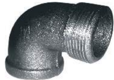
CODO MACHO HIERRO