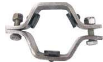
SOPORTE PARA TUBERÍA SANITARIA