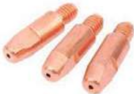
3 PCS WELDIN TIPS.