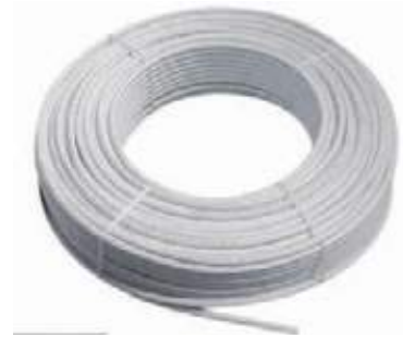
TUBO PEX AL PEX PARA AGUA