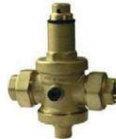
VÁLVULA REGULADORA AGUA RR DE 7 A 901