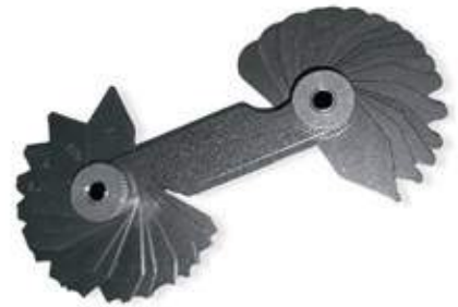
CALIBRADOR GALGAS RADIOS