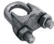
PERRO PARA CABLE