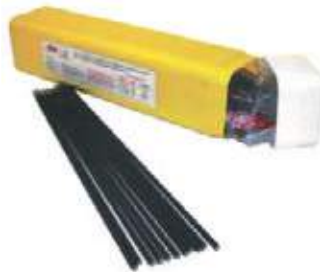
CAJA ELECTRODOS STD/INOX