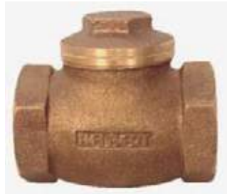
CHEQUE GLOBO BRONCE