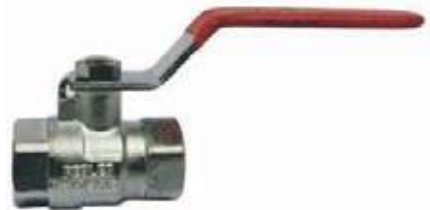
VÁLVULA BOLA BR