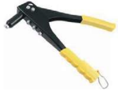
REMACHADORA HR-2100 TIPO STANLEY