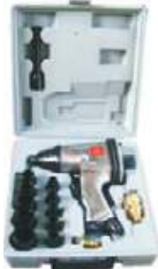
KIT 17PZ. LLAVE IMPACTO COPAS Y ACCESORIOS