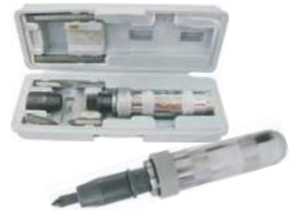
DESTORNILLADOR DE IMPACTO