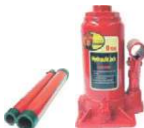
GATO HIDRÁULICO TIPO BOTELLA CON Y SIN ESTUCHE