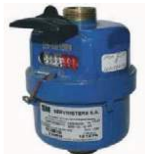
CONTADOR AGUA BR VOLUMÉTRICO