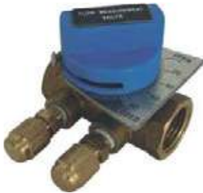
VALVULA BALANCEADORA DE FLUJO