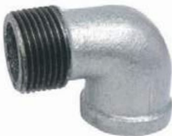
CODO MACHO GALVANIZADO