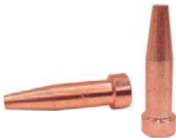
BOQUILLA 6290 P/KIT DE SOLDADURA.