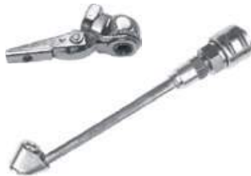
CABEZA INFLA LLANTA