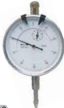
INDICADOR DE DIAL

0.40-6MM 20HOJAS 4-62MM/0.25 - 6"58 HOJAS