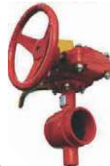
VALVULA MARIPOSA HD RANURADA UL/FM