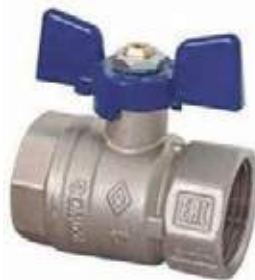
VÁLVULA BOLA PARA MEDIDOR