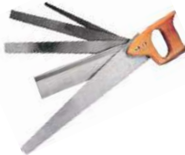
SERRUCHO DE 5 HOJAS PARA MARQUETERIA.