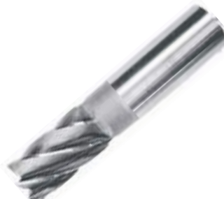
FRESA FRONTAL HSS