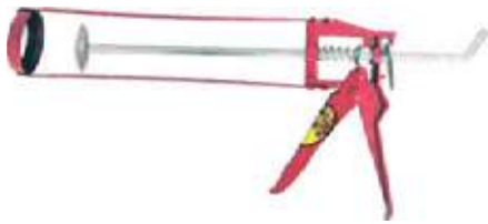
PISTOLA PARA SILICONA TIPO ESQUELETO