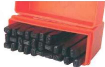
JUEGO 27 PIEZAS LETRAS ABC