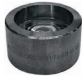
UNION MEDIA F304L NPT /A182