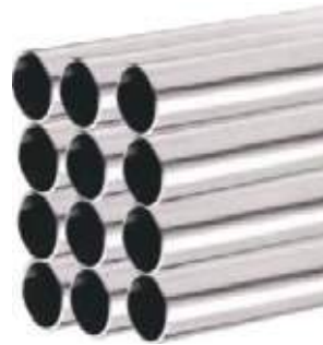
TUBING SS316L S/C