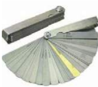
CALIBRADOR GALGAS ESPESORES