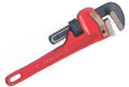
LLAVE PARA TUBO T/REDGED