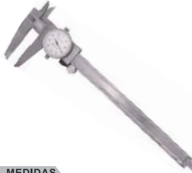
CALIBRADOR PIE REY DE DIAL