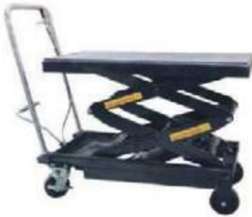
GATO ESTIBADOR PLATAFORMA