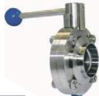
VÁLVULA MARIPOSA SS304 SANITARIA SOLDAR