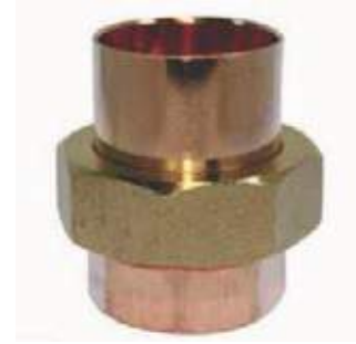
UNIVERSAL COBRE SOLDAR