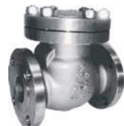
CHEQUE CORTINA SS304 FLANCHADO