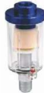
SEPARADOR DE HUMEDAD MF-80/RP8054

MINI \ STD \ DRENAJE AUTOMÁTICO 1/4" - 1"