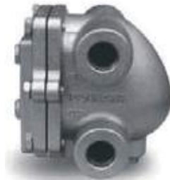
TRAMPA FLOTADOR TERMOSTATICA