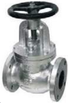
VALVULA GLOBO HO/BR FLG