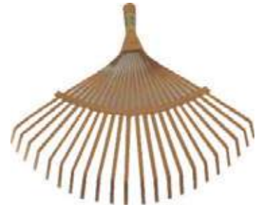
ESCOBA PARA PRADO 22D METÁLICA