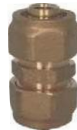
UNIÓN BR PEX AL PEX