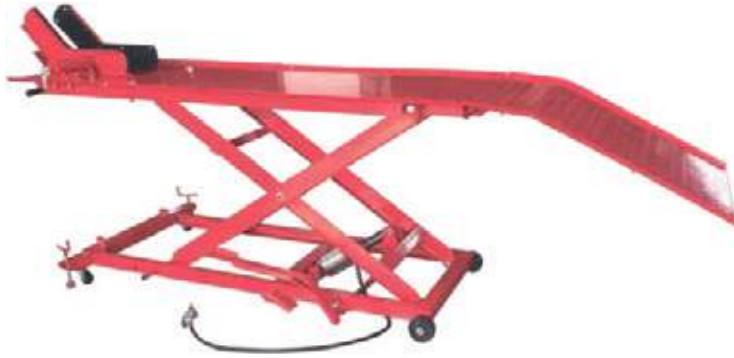
MESA HIDRÁULICA HIDRONEUMÁTICA ESTÁNDAR Y TIPO PESADO PARA MOTO