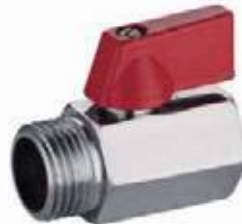
MINIVALVULA BOLA H X M REF TC800 TCL