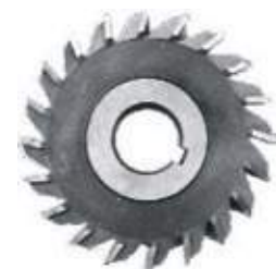
DISCO FRESA 3 CORTES