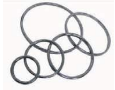
OVAL RING / RING GASKET