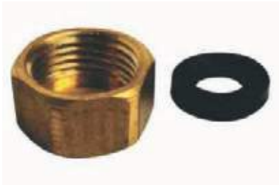
TUERCA PLANA CON EMPAQUE