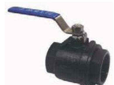
VÁLVULA BOLA AC P/F 1000L