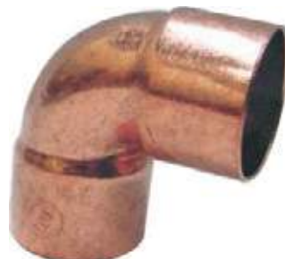
CODO COBRE SOLDAR CXC