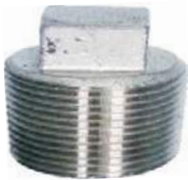
TAPON MACHO SS304 NPT 150L