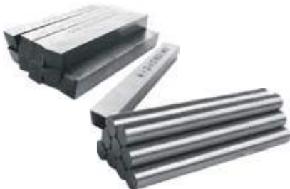
BURIL CUADRADO Y REDONDO HSS