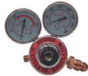
REGULADOR DE ACETYLENE P/KIT SOLDADURA.