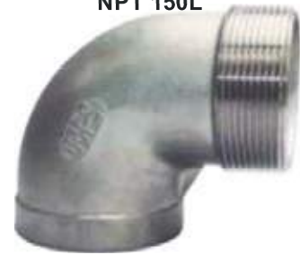
CODO MACHO SS304/SS316 NPT 150L