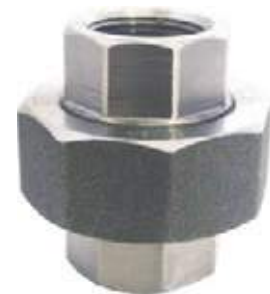
UNIVERSAL SS304 NPT 150L