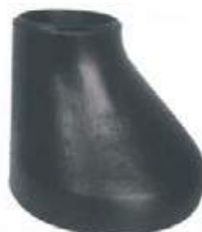
COPA EXCENTRICA AC P/S