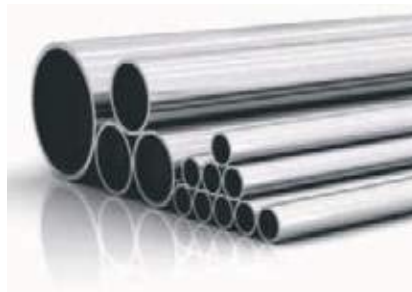
TUBO SS304 SANITARIO CON CUSTURA PULIDO