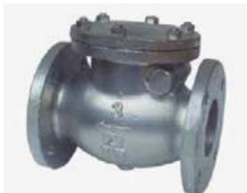
CHEQUE CORTINA HIERRO FLANCHADO