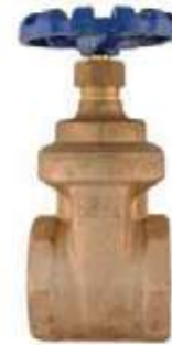
MEDIDAS DECA FIG 1504 150L/300L - 1/4" - 4"