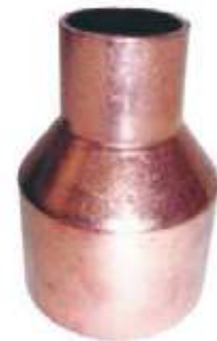
COPA COBRE SOLDAR CXC