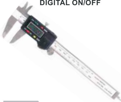
CALIBRADOR PIE DE REY DIGITAL ON/OFF