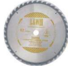
SIERRA CIRCULAR PARA MADERA CON TUNGSTENO