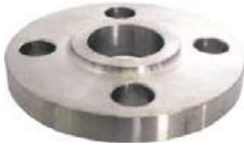
FLANCHE SLIPON SS304