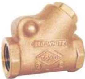
CHEQUE CORTINA BRONCE