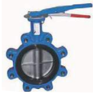
VÁLVULA MARIPOSA DISCO INOXIDABLE TIPO LUG

MEDIDAS DISCO: HIERRO, INOXIDABLE 150L - 2" - 36"