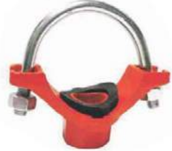
DERIVACIÓN STRAP HD ROSCADA NPT UL/FM