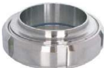
UNIVERSAL SS304 SANITARIA