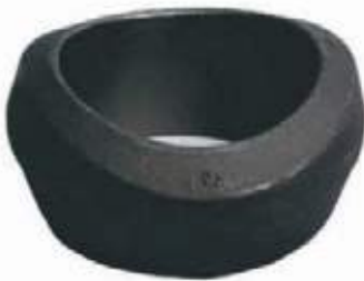
WELDOLET AC BW