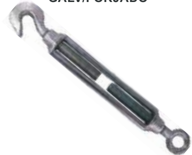
TENSOR PARA CABLE GALV/FORJADO