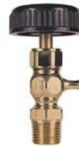
VÁLVULA GRIFO DE PURGA BR