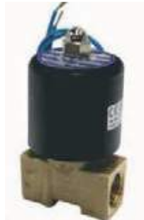
VÁLVULA SOLENOIDE BR PARA AGUA UD