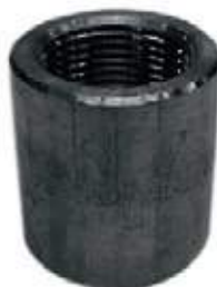
COPA F304 NPT