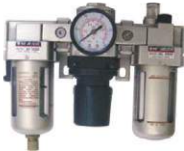
JUEGO F.R.L. Y MANÓMETRO