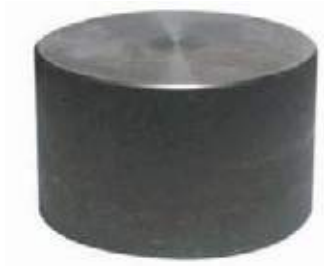
TAPON COPA AC NPT