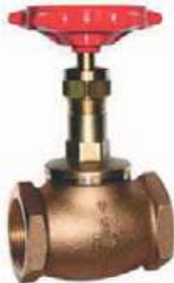
VÁLVULA GLOBO BRONCE