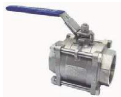
VÁLVULA BOLA SS316 4T - P/F