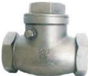
CHEQUE CORTINA SS316