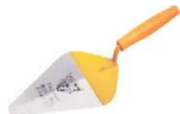
PALUSTRE MANGO PLÁSTICO