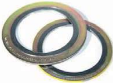
EMPAQUE ESPIROMETALICO SS304 + GRAFITO