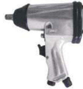
LLAVE IMPACTO NEUMÁTICA