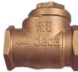
CHEQUE CORTINA BRONCE