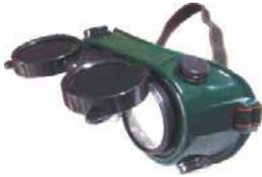
GAFAS P/SOLDAR Y CORTAR C/OXIGAS Y ACETILENO