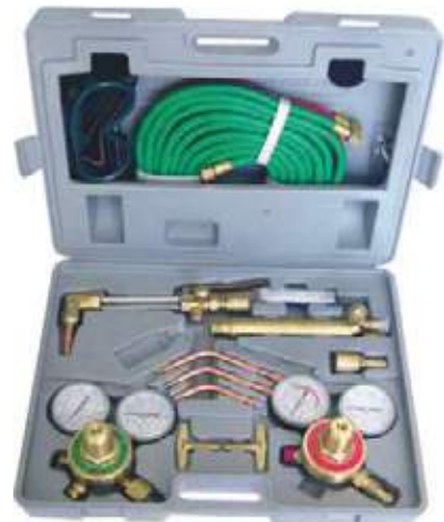
KIT EQUIPO SOLDADURA AUTOGENA