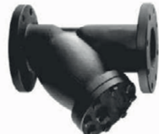
FILTRO Y AC FLG 150L