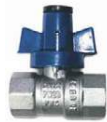
VÁLVULA BOLA ANTIFRAUDE