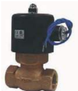
VÁLVULA SOLENOIDE BR VAPOR US