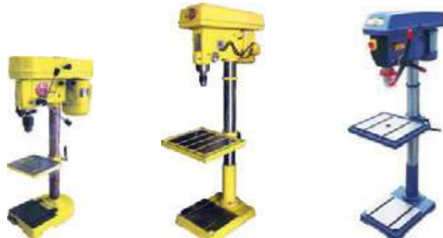
TALADROS DE ARBOL