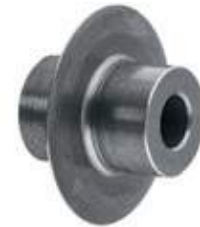
CUCHILLA PARA CORTATUBO.