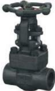
VÁLVULA GLOBO AC FORJADA A 105

MEDIDAS DECA DISCO: TEFLON, ACERO INOXIDABLE 300L \ 1/4" - 2"