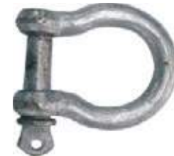
GRILLETE TIPO LIRA FORJADO GALVANIZADO