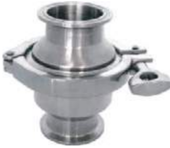
CHEQUE SS304 SANITARIO