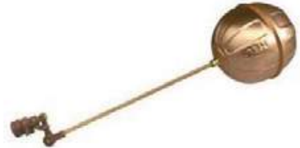
VÁLVULA FLOTADOR COMPLETA

US, UW, UD, SUW 110V - 220V \ 2" - 1.1/4"