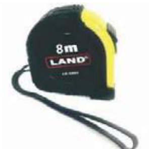
FLEXÓMETRO CAJA PLÁSTICA CON FRENO