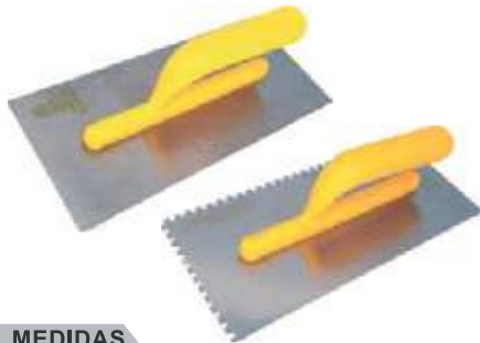
LLANA LISA Y RANURADA MANGO PLÁSTICO