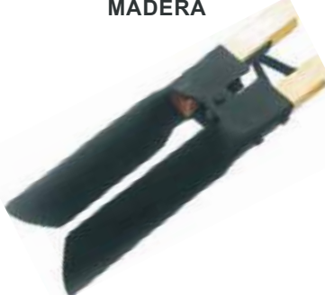
PALA HOYADORA MANGO MADERA