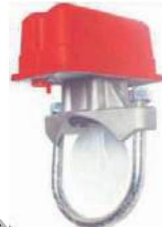
SENSOR DE FLUJO TIPO PALETA UL/FM