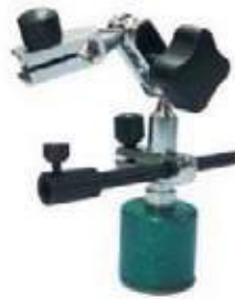
BASE MAGNÉTICA BRAZO ESCALIZABLE