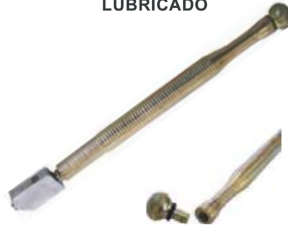
CABEZA PARA CORTAVIDRIO LUBRICADO