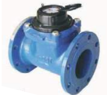
MEDIDOR AGUA FLANCHADO