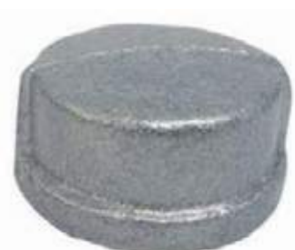
TAPÓN COPA GALVANIZADO