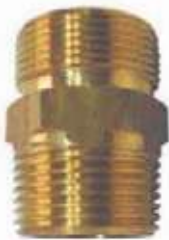
UNION TRANSICION BR PEX AL PEX