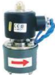
VÁLVULA SOLENOIDE PVC PARA ACIDO