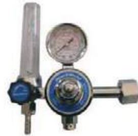
REGULADOR CO2 MODEL C-198L