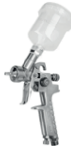
PISTOLA PINTURA BAJA GRAVEDAD