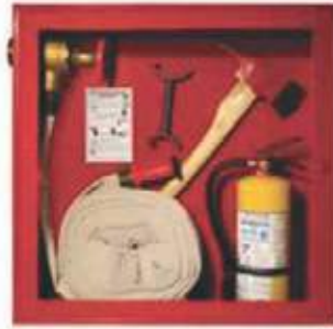
GABINETE CONTRA INCENDIO