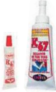
TEFLÓN LÍQUIDO 50 GR PERMATEX