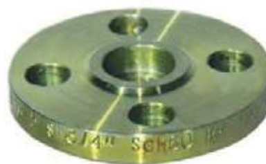
FLANCHE AC SOCKET WELD

SCH: 40, STD, 80, XS, 120, 160, XXS. FF-RF-RTJ