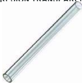
TUBO VIDRIO ALTA PRFSION TRANSPARENTE