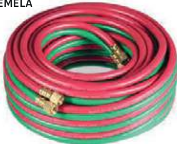
MANGUERA OXIACETILENO GEMELA