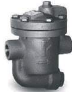
TRAMPA BALDE INVERTIDO CON FILTRO PENNANT