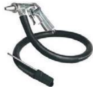
KIT PISTOLA/MANG SANDBLASTIN PS3/RP8040