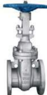
MEDIDAS 150L - 1500L 2" - 36"