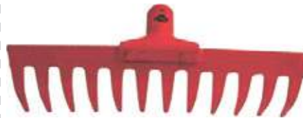
RASTRILLO PARA JARDÍN