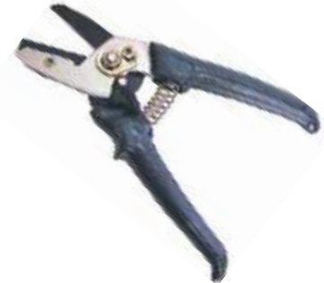
TIJERA PARA JARDÍN PUNTA RECTA