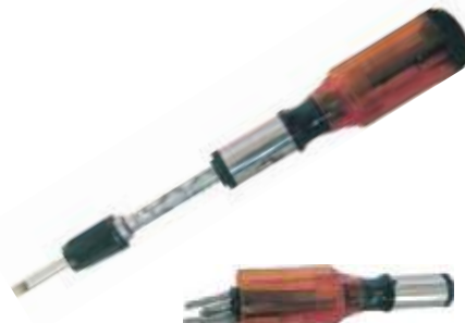
DESTORNILLADOR PARA PUNTAS INTERCAMBIABLE T/RATCHET