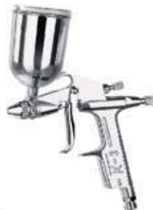
AERÓGRAFO BAJA K-3/RP-8008-1 CHORRO