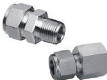
CONECTOR NPT MACHO Y HEMBRA