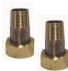
JUEGO CONECTOR 2PZ 4 PARA MEDIDOR 2PZ