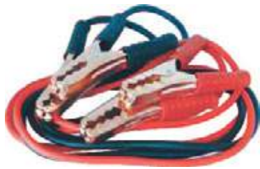
CABLE IGNICION PARA AUTOS.