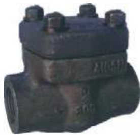
CHEQUE GLOBO AC/SW