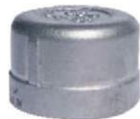
TAPON COPA SS304 NPT 150L