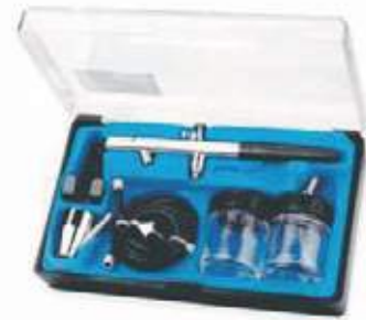
KIT AERÓGRAFO BD-138