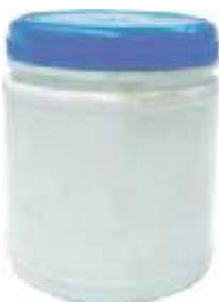
FUNDENTE PARA ESTAÑO TARRO