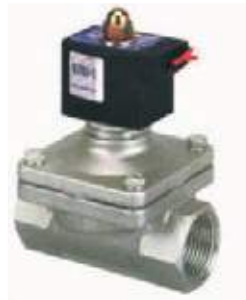
VÁLVULA SOLENOIDE INOX LIQUIDO - GAS SUW