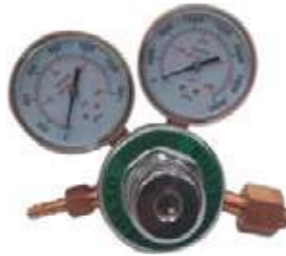
REGULADOR DE OXIGENO P/KIT SOLDADURA.