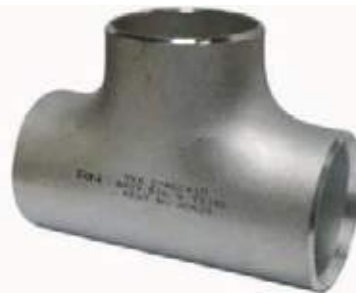
TEE SS304/316 PARA SOLDAR