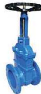
MEDIDAS 125L - 200L \ 2" - 36"