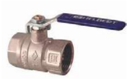
VÁLVULA BOLA BR