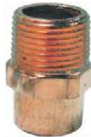
ADAPTADOR MACHO BRONCE/COBRE