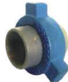
UNIVERSAL DE GOLPE ROSCADAS - SOLDAR