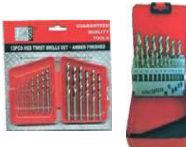
JUEGO BROCA HSS