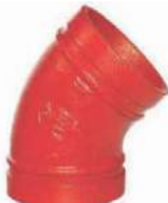
SEMICODO HD RANURADO UL/FM