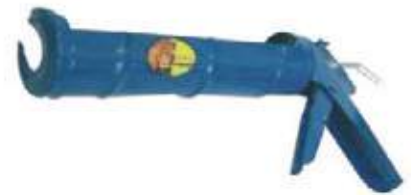
PISTOLA PARA SILICONA TIPO PESADO