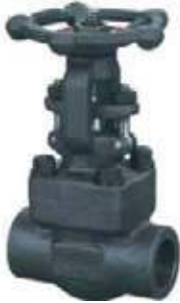
MEDIDAS FORJADA A 105 800L \ 1.500L - 1/4" - 2"