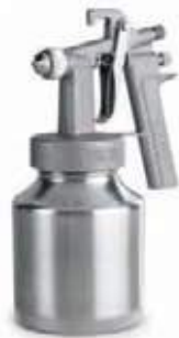
PISTOLA PINTURA BAJA