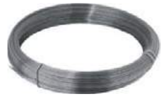
ALAMBRE AC PULIDO / INOX BRILLANTE Y OPACO