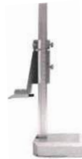
CALIBRADOR DE ALTURA