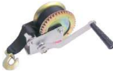
WINCH CON CORREA DE NYLON