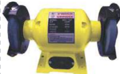
ESMERILES DE BANCO