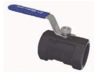
VÁLVULA BOLA AC P/R 800L