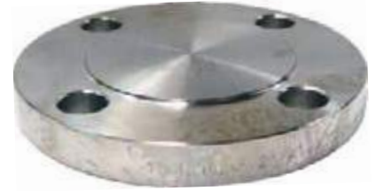
FLANCHE CIEGO SS304