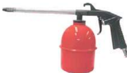
PISTOLA PETROLIZADORA AG-00/RP 8036E ROJA