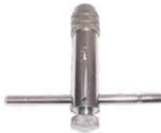
VOLVEDOR TIPO RACHET