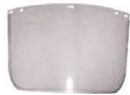
VISOR TRANSP PARA CARETA PROTECTORA