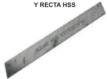
CUCHILLA TRAPEZOIDAL Y RECTA HSS