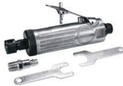
MOTORTOOL NEUMÁTICO 1/4"