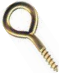
GRSA CANCAMO CERRADO COBRIZADO