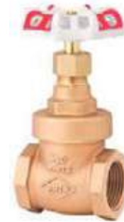
MEDIDAS REDWHITE TOYO 125L \ 300 / 600 - 1/4" - 4"