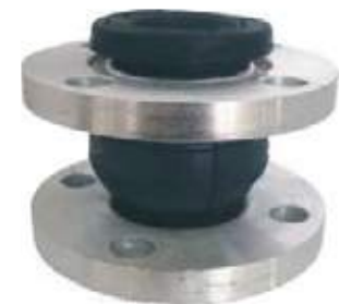
JUNTA DE CAUCHO ANTIVIBRATORIA