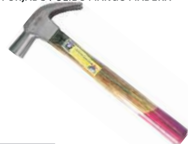
MARTILLO UÑA ACERO FORJADO PULIDO MANGO MADERA