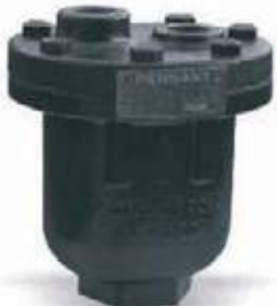
TRAMPA FLOTADOR CON ELIMINADOR DE AIRE