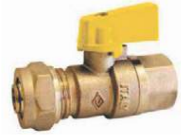
VÁLVULA BOLA BR PEX AL PEX X NPT PARA GAS