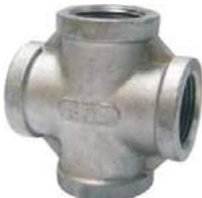
CRUZ SS304 NPT 150L