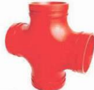
CRUZ HD RANURADA UL/FM