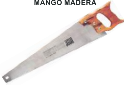
SERRUCHO PROFESIONAL MANGO MADERA