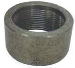
UNION MEDIA AC NPT

3.000L NPT 1/4" - 4" 6.000L NPT 1/2" - 2"