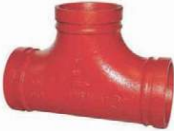
TEE HD RANURADA UL/FM