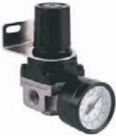
REGULADOR AIRE CON MANÓMETRO