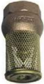
VÁLVULA DE PIE BR CANASTILLA METAL