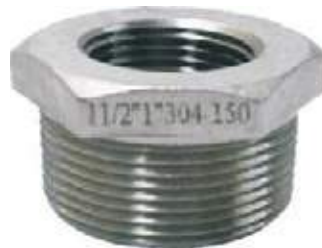
BUSHING SS304 NPT 150L