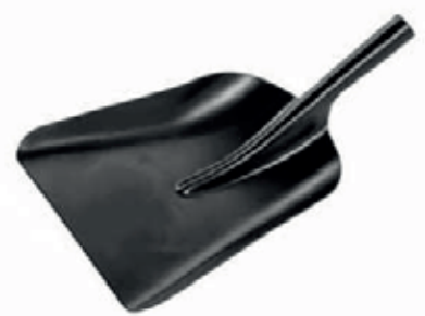
PALA CARBONERA SIN MANGO