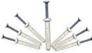
JUEGO CHAZO TORNILLO