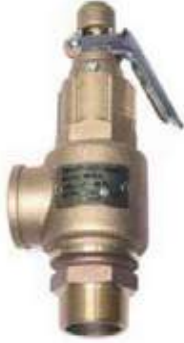
VÁLVULA SEGURIDAD BR