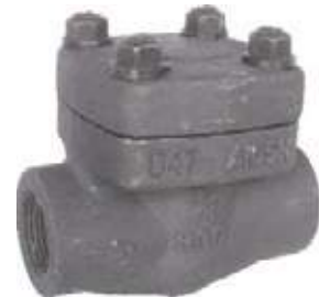
CHEQUE CORTINA AC NPT