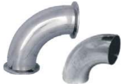
CODO SS304 SANITARIO SOLDAR CLAMP