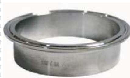
FÉRULA CORTA SS304 SANITARIA