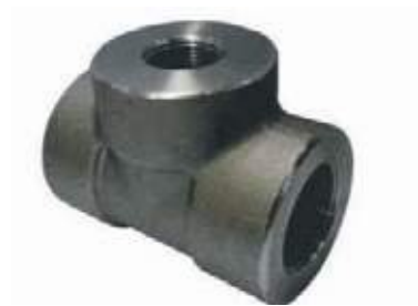
TEE REDUCIDA AC