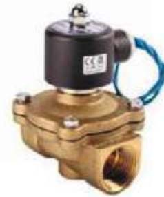
VÁLVULA SOLENOIDE BR PARA GAS