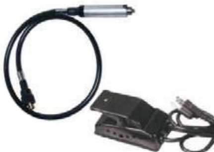
EXTENSIÓN PARA ESMERIL PEDAL PARA ESMERIL PLATERÍA