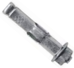
CHAZO AC EXPANSIVO