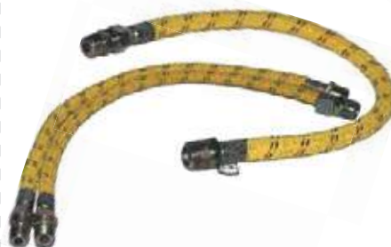
MANGUERA FLEXOMETALICA CERTIFICADA PARA GAS