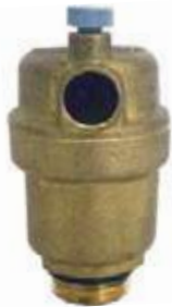
VENTOSA PURGADOR AIRE BR