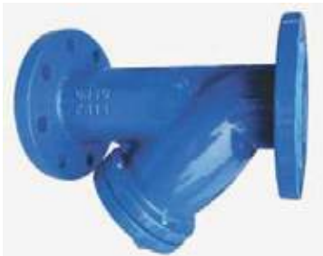
FILTRO Y HO FLANGE