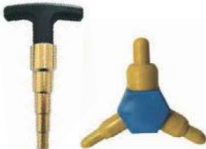
REBORDEADOR PARA TUBO PEX AL PEX