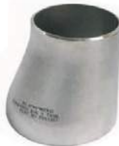
COPA EXCÉNTRICA SS304/316 PARA SOLDAR