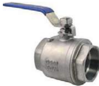
VÁLVULA BOLA SS316 P/F