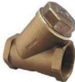
CHEQUE BOLA BRONCE