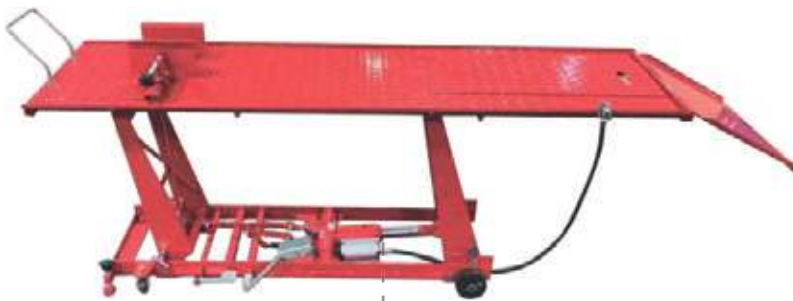
MESA HIDRÁULICA PARA MOTO