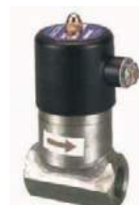
VÁLVULA SOLENOIDE INOX VAPOR SUS