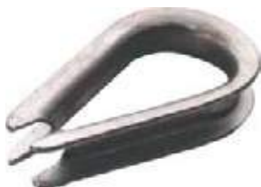
GUARDACABO PARA CABLE