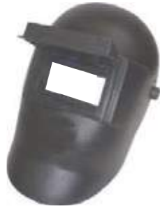
CARETA SOLDADOR VICERA LEVANTABLE