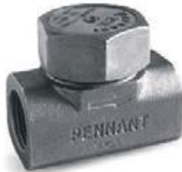
TRAMPA TERMODINAMICA SIN FILTRO