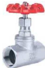
VÁLVULA GLOBO SS304 / SS316