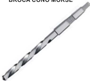
BROCA CONO MORSE