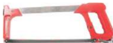
MARCO PARA SEGUETA MANGO ALUMINIO