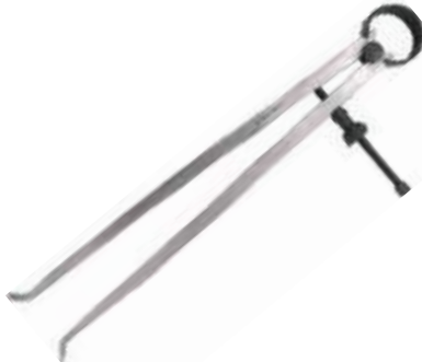
COMPAS PARA INTERIORES