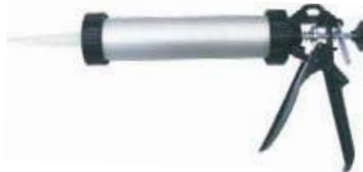
PISTOLA PARA SILICONA TIPO PROFESIONAL