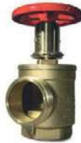
VALVULA ANGULAR BR CON RESTRICTOR