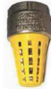
VÁLVULA DE PIE BR CANASTILLA PLASTICA