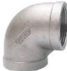
CODO SS304 NPT 150L