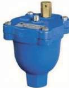
VENTOSA PURGADOR AIRE HO