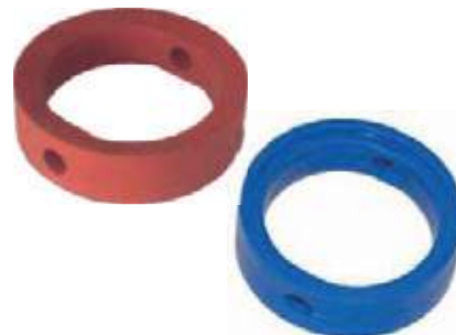
EMPAQUE VÁLVULA MARIPOSA SANITARIA