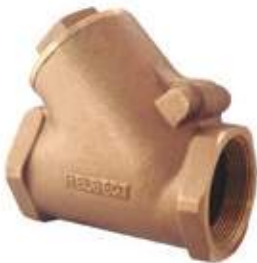
CHEQUE CORTINA BRONCE