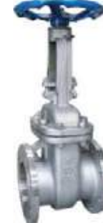
MEDIDAS 150L - 1500 \ 2" - 36"