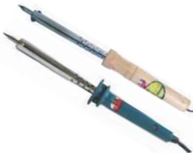
CAUTÍN MANGO PLÁSTICO Y MANGO MADERA LIV