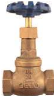
VÁLVULA GLOBO BRONCE

MEDIDAS DECA DISCO: TEFLON, ACERO INOXIDABLE 300L \ 1/4" - 2"