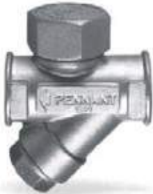
TRAMPA TERMODINAMICA CON FILTRO