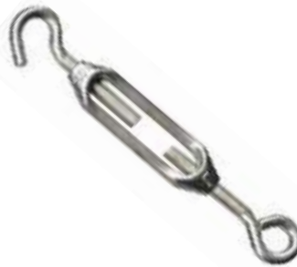
TENSOR PARA CABLE