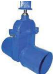
VALV EXTREMO LISO CUADRANTE/TRIANGULO