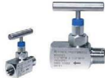
VÁLVULA AGUJA AC / SS316 MACHO