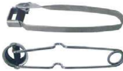
CHISPERO PARA SOLDAR