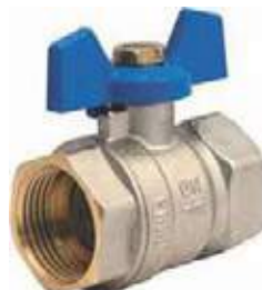
VALVULA BOLA BR/CR P/F MANIJA TIPO MARIPOSA AZUL