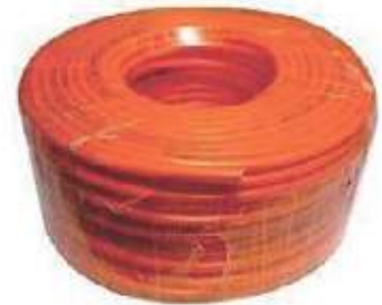
MANGUERA PVC PARA AIRE