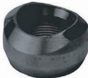
THREDOLET AC NPT 3.000L - 6.000L