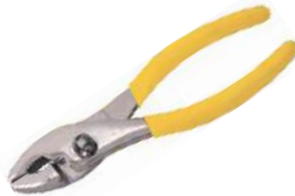
ALICATE 2 POSICIONES