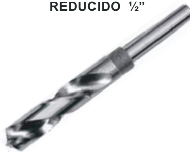
BROCA HSS MANGO REDUCIDO 1/2"