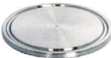
TAPÓN SS304 SANITARIO