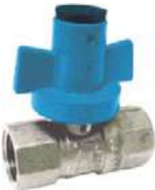
VÁLVULA BOLA ANTIFRAUDE BR PARA MEDIDOR