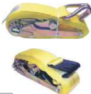
PRENSA REATA POLYESTER CON RACH