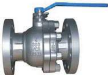
VÁLVULA BOLA 304/316 FLANCHADA