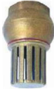
VÁLVULA DE PIE BR