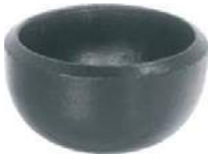
CAP AC P/S