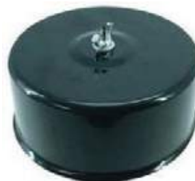
FILTRO PARA COMPRESOR