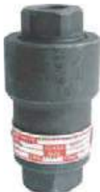
CHEQUE VERTICAL AC