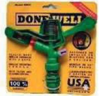
ASPERSOR PLÁSTICO ABS