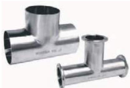
TEE SS304 SANITARIA