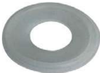
EMPAQUE CAUCHO PARA FÉRULA SANITARIA