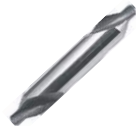
BROCA HSS DE CENTRO