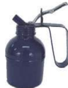
ACEITERA FLEXIBLE BOMBA EN BRONCE AZUL METALIZADO