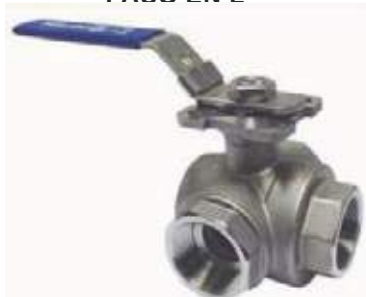
VÁLVULA BOLA SS316 3 VIAS PASO EN L