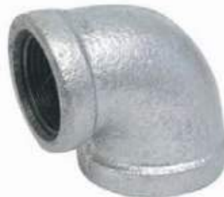
CODO REDUCIDO GALVANIZADO