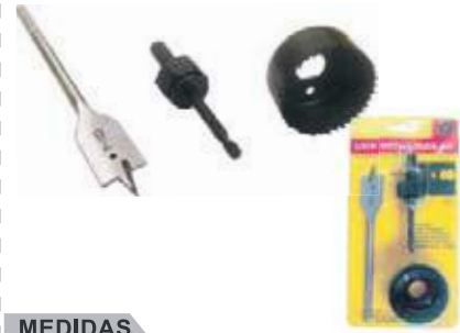
JUEGO BROCA Y SIERRA PARA INSTALAR CHAPA