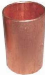
UNION COBRE SOLDAR CXC