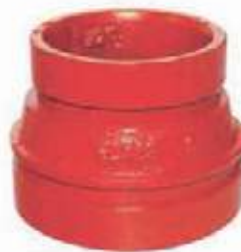
COPA HD RANURADA UL/FM