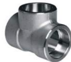
TEE F304 NPT / F316 SW