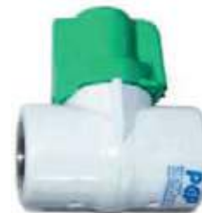
VALVULA ANTIF. SENCILLA PVC