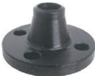
FLANCHE CUELLO AC