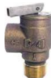
VÁLVULA SEGURIDAD MARMITA