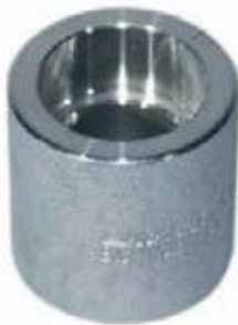
UNION A182 / F304 NPT /SS316