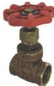
VÁLVULA COMPUERTA BRONCE