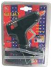
PISTOLA PARA SILICONA