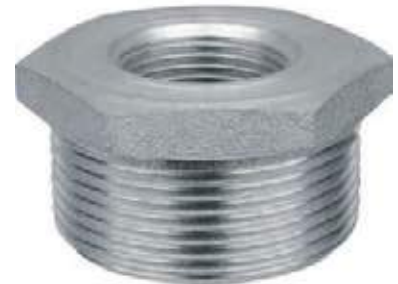
BUSHING F304 NPT