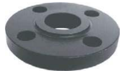
FLANCHE SLIPON AC