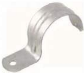
GRAPA GALVANIZADA PARA TUBERIA ALA SENCILLA