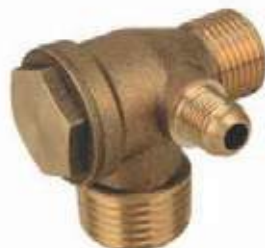
VÁLVULA RETENCIÓN BR PARA COMPRESOR