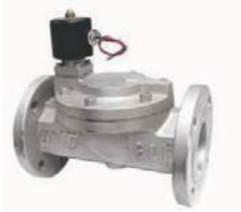
VÁLVULA SOLENOIDE HO FLANCHADA USO GENERAL