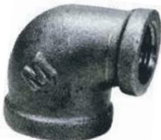
CODO REDUCIDO HIERRO