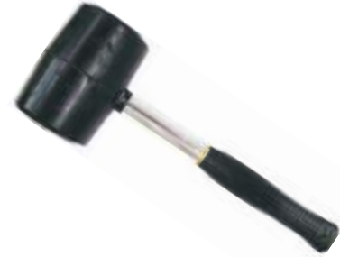
MARTILLO CAUCHO MANGO ACERO