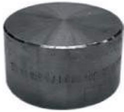
TAPON COPA F304L NPT