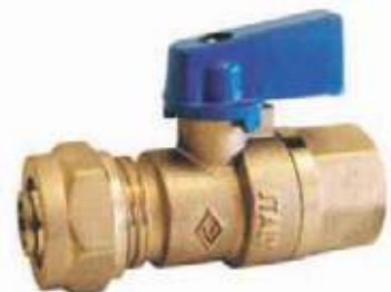
VÁLVULA BOLA BR PEX AL PEX X NPT PARA AGUA