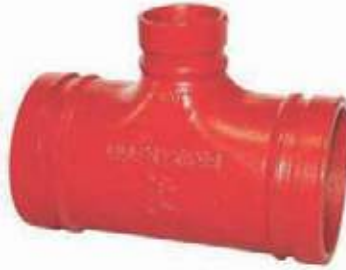
TEE REDUCIDA HD RANURADA UL/FM