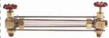
JUEGO NIVEL BRONCE T/VIDRIO