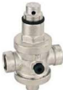
VÁLVULA REGULADORA AGUA BR/CROMADA