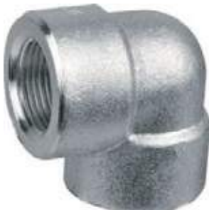
CODO F304 NPT / SS304 / SS316