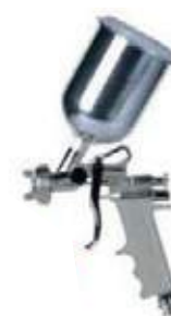
AERÓGRAFO BAJA E-70/RP 8800/G70