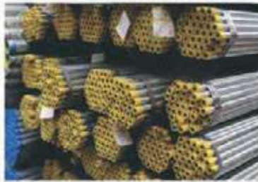
TUBO AC GALVANIZADO PARA GAS SCH40 y 80 CON COSTURA Y SIN COSTURA