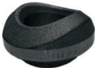
WELDOLET F304 S80S