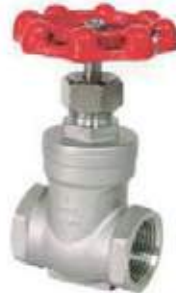
MEDIDAS 200L-800L \ 1/4" - 2"