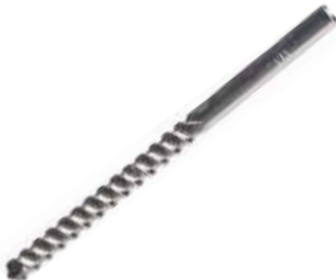
BROCA PARA MURO T. CARBIT