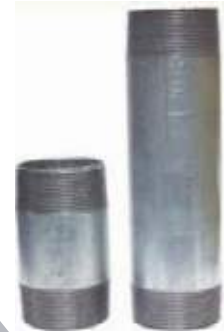
NIPLE ACERO GALVANIZADO PARA AGUA Y GAS