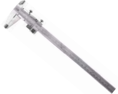
CALIBRADOR PIE DE REY