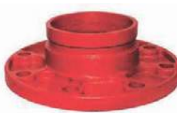
FLANCHE HD RANURADO CON ADAPTADOR