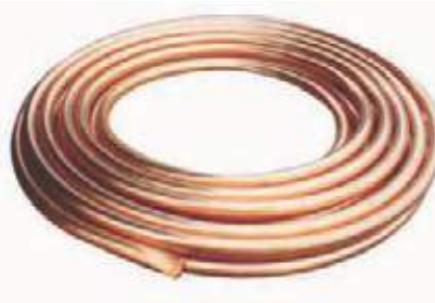
TUBO COBRE FLEXIBLE