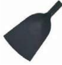
SANTANDER 1.8 L