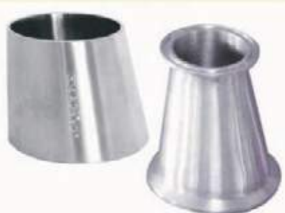
COPA EXCENTRICA SS304 SANITARIA