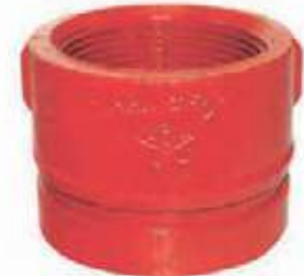
COPA HD RANURADA ROSCA NPT