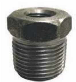
BUSHING AC NPT

3.000L NPT 3/8" X 1.1/4" - 3" X 2" 6.000 NPT/SW