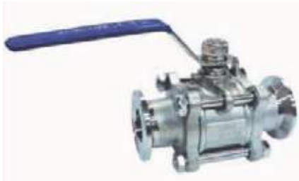
VÁLVULA BOLA SS304 SANITARIA CLAMP 4T