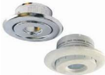
ESCUDO DOBLE BLANCO CROMADO