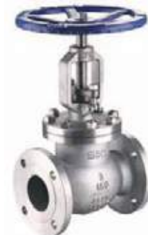
VÁLVULA GLOBO AC/INOX FLG