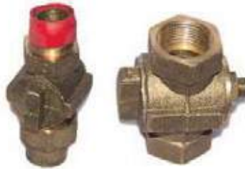
REGISTRO DE INCORPORACIÓN