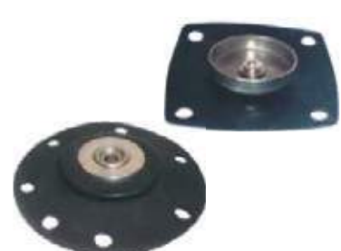
DIAFRAGMA SOLENOIDE USO GENERAL