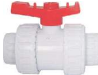
VÁLVULA BOLA PVC TIPO UNIVERSAL .