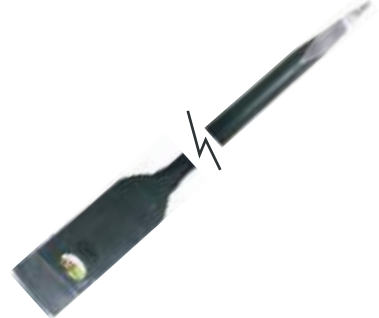
BARRA ACERO FORJADO