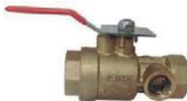
VÁLVULA DE PRUEBA