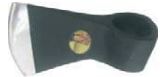
HACHA ACERO FORJADO