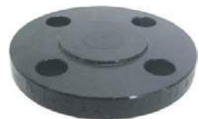
FLANCHE CIEGO AC