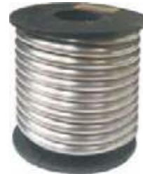
SOLDADURA ESTAÑO ANTIMONIO