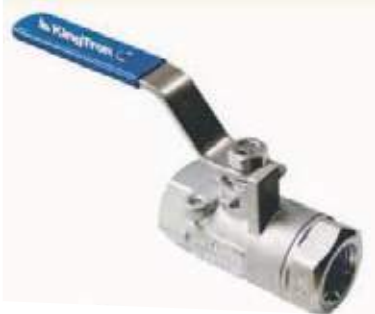
VÁLVULA BOLA SS316