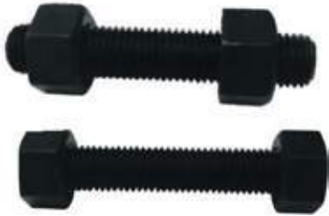
TUERCA HEX. AC A194 GR 2H 1/2" - 2.1/2"