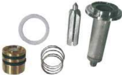
KIT REPUESTO SOLENOIDE VAPOR