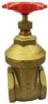
MEDIDAS PEGLER 125/200L \ 1/4" - 4"