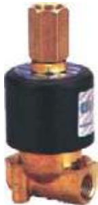
VÁLVULA SOLENOIDE 3 VÍAS BRONCE USO GENERAL