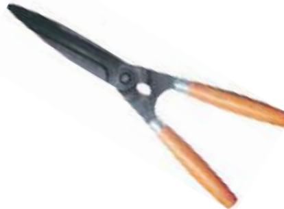
TIJERA PARA PRADO MANGO MADERA.