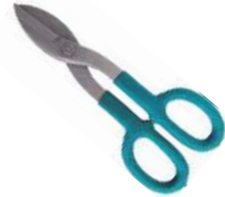
TIJERA PARA LAMINA MANGO PLÁSTICO