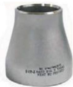
COPA SS304/316 PARA SOLDAR