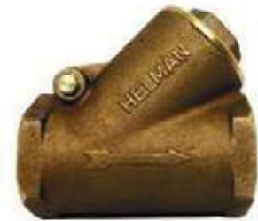
CHEQUE CORTINA BRONCE