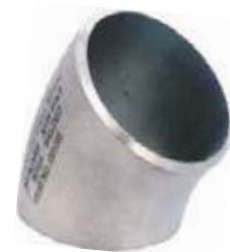
SEMICODO SS304/316 PARA SOLDAR