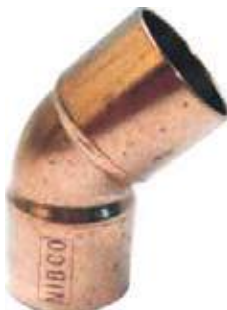
SEMICODO COBRE SOLDAR CXC