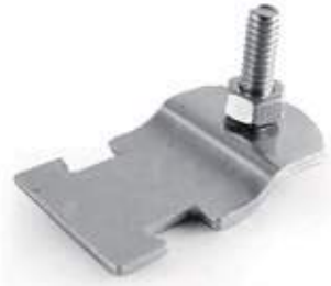
ABRAZ AJUST RIEL CHANNEL