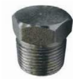
TAPON MACHO AC