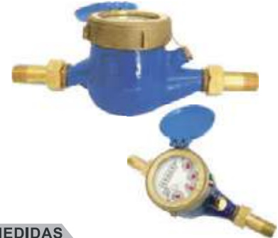
CONTADOR AGUA BRONCE CHORRO UNICO