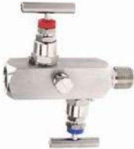
VALVULA AGUJA BLOQUEO/PURGA H/M