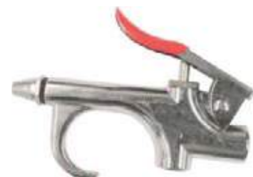
PISTOLA SOPLAR AIRE BG-1 RP 8024