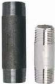
NIPLE ACERO, ACERO NEGRO Y ACERO INOXIDABLE