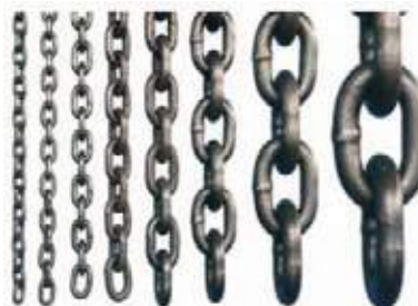
CADENA AC GALV. ESLABONADA GRADO 80 NEGRO