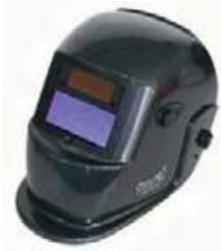
CARETA SOLDADOR FOTO SENSIBLE CELDA SOLAR+BAT LITIO