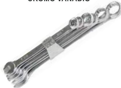
LLAVE COMBINADA 100% CROMO VANADIO