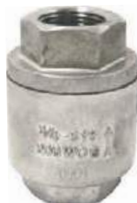
CHEQUE VERTICAL SS316