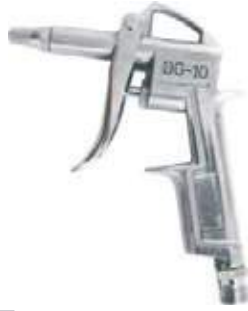
PISTOLA PARA SOPLAR AIRE DG10