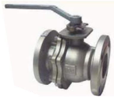
VÁLVULA BOLA AC FLG RF