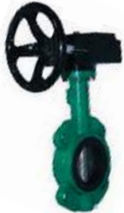
VALVULA MARIPOSA DSS304 OPERADOR ENGRANAJE

MEDIDAS DISCO: HIERRO, INOXIDABLE 150L - 16"