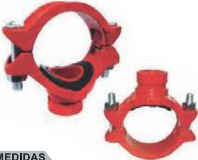
TEE MECANICA HD RANURADA UL/FM