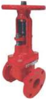
VÁLVULA CORTINA HD FLANCHADA UL/FM