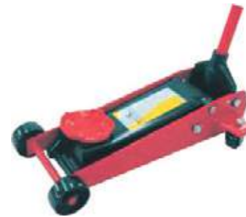
GATO HIDRAULICO TIPO ZORRA CON Y SIN ESTUCHE