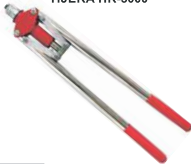
REMACHADORA TIPO TIJERA HR-5000