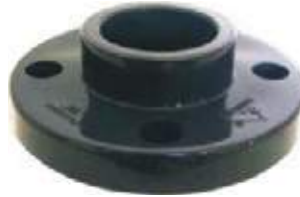
FLANCHE PVC 150L ROSCAR Y SOLDAR