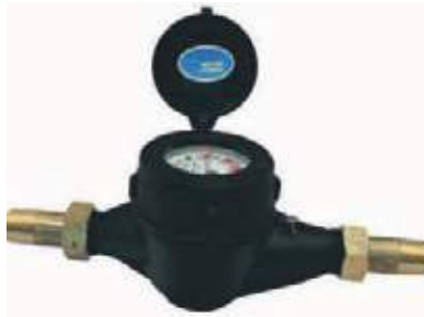
CONTADOR AGUA PLASTICO CHORRO MULTIPLE