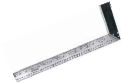
ESCUADRA METALICA PARA CARPINTERO