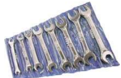
JUEGOS LLAVES FIJAS