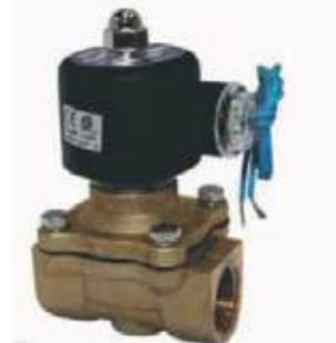
VÁLVULA SOLENOIDE BR USO GENERAL UW