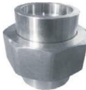
UNIVERSAL A-182 / F304L NPT