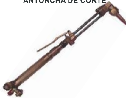
ANTORCHA DE CORTE