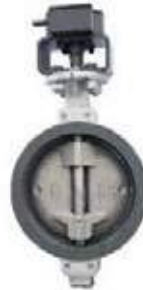
VALV MARIP DA216 TRIEXC OP OPERADOR NEUMATICO