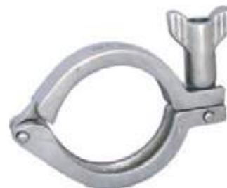
ABRAZADERA SS304 SANITARIA