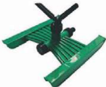
ASPERSOR PLASTICO ABS CON SOPORTE