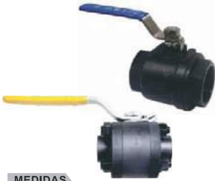
VÁLVULA BOLA AC