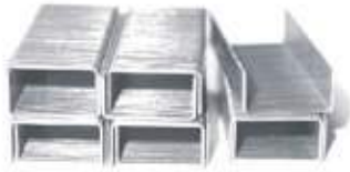
CAJA GRAPA PARA ENGRAPADORA NEUMÁTICA