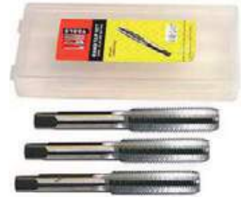
JUEGO 3 PZS MACHO