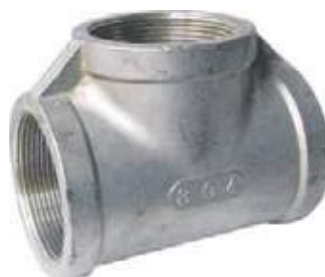
TEE SS304 NPT 150L