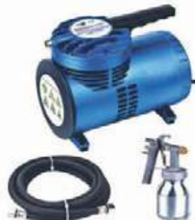
MINICOMPRESOR DE PASO CON Y SIN PISTOLA