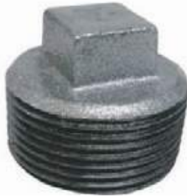
TAPÓN MACHO GALVANIZADO