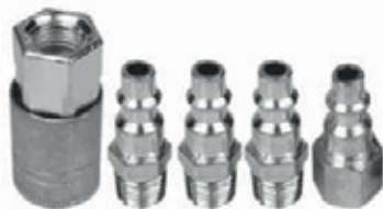
KIT 5PZAS ACOPLÉ RAPIDO AIRE - CONECTORES