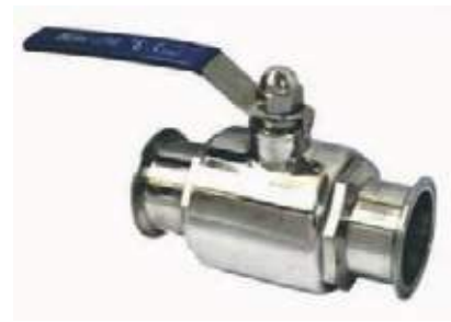
VÁLVULA BOLA SS304 SANITARIA CLAMP