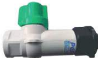
VALVULA ANTIFRAUDE TELESCÓPICA PVC PCP