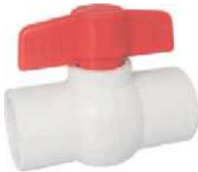
VÁLVULA BOLA PVC COMPACTA