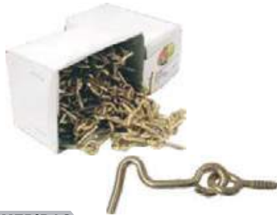
GRSA JUEGO CANCAMO ALDABA COBRIZADO