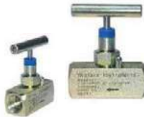
VÁLVULA AGUJA AC / SS316 HEMBRA