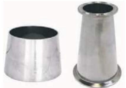
COPA SS304 SANITARIA

1/4" - 1" Espesor: 0.035", 0.049", 0.065"