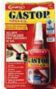
GASTOP COBRE PARA GAS FUERZA ALTA