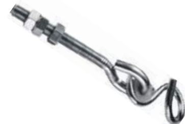
GANCHO PARA HAMACA