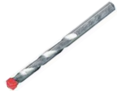
BROCA PARA MURO STANDAR