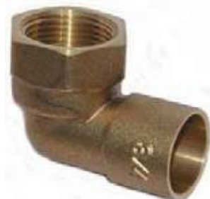
CODO MIXTO BRONCE