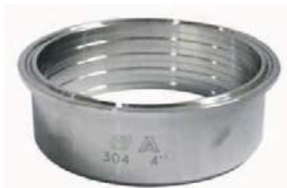
FÉRULA EXPANDIR SS304 SANITARIA