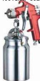
PISTOLA PINTURA ALT X 1.000 ML 4001S/RP 8022-1