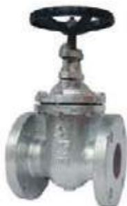
MEDIDAS 125L - 200L \ 2" - 36"