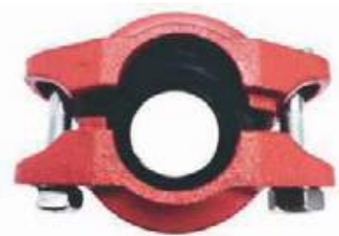
UNION RIGIDA HD RANURADA UL/FM