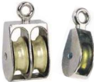
POLEA ZINC ALLOY/CROMADA SENCILLA Y DOBLE