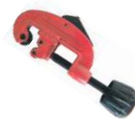
CORTATUBO MANUAL LIVIANO