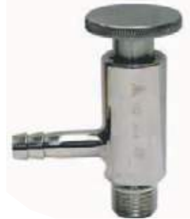
VÁLVULA TOMA MUESTRA SS304 SANITARIA NPT