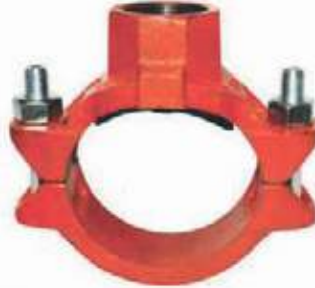
TEE MECANICA HD SALIDA NPT UL/FM