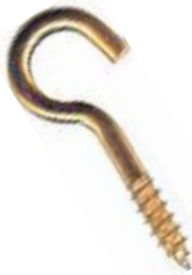
GRSA CANCAMO ABIERTO COBRIZADO