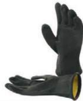
GUANTE INDUSTRIAL LATEX