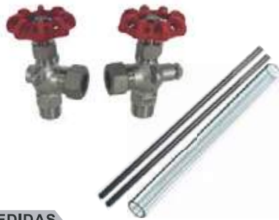
JUEGO NIVEL SS316