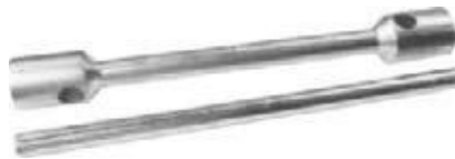
COPA ARTILLERA CROMADA