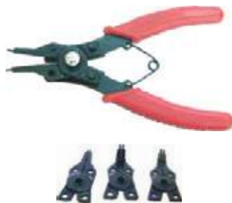
PINZA PARA PINES