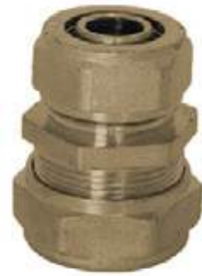
COPA BR PEX AL PEX