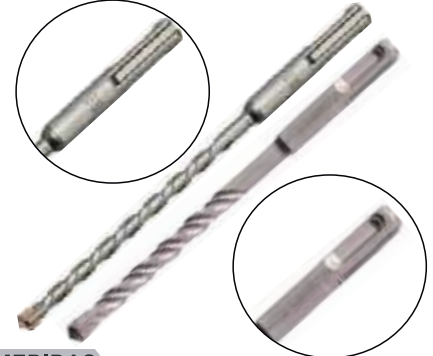
JUEGO BROCA PARA MURO