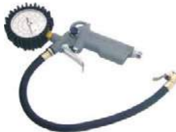
INFLA LLANTA CON MANÓMETRO