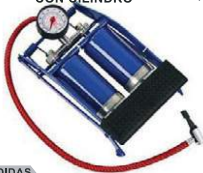
BOMBA DE PIE AIRE CON CILINDRO