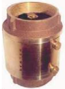
CHEQUE VERTICAL BR