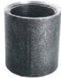
UNION LISA AC NPT 300L