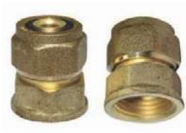
ADAPTADOR HEMBRA BR PEX AL PEX