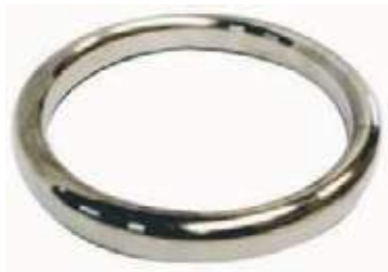
OVAL RING RTJ