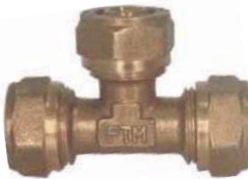
TEE BR PEX AL PEX