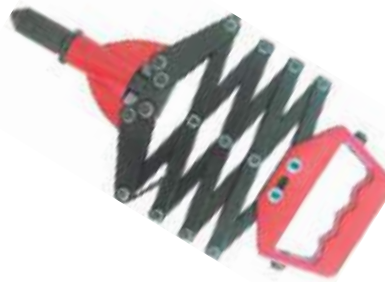
REMACHADORA TIPO FUELLE