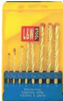
JUEGO BROCA PARA MURO