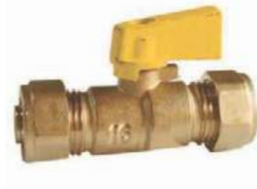
VÁLVULA BOLA BR PEX AL PEX POR PEX AL PEX

1/2" NPT 16MM - 3/4" NPT 20MM - 1" NPT 26MM