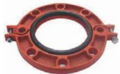
FLANCHE HD PLANO