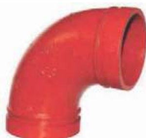
CODO HD RANURADO UL/FM