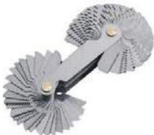
CALIBRADOR DE ROSCAS