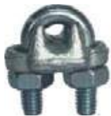
PERRO PARA CABLE AC/FORJADO T/USA