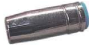
BOQUILLA EXTERNA PARA GAS.