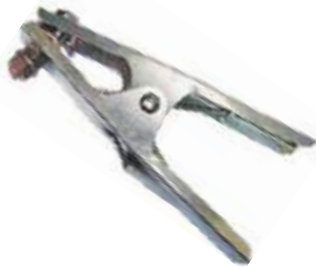
PINZA PARA MASA SOLDADOR