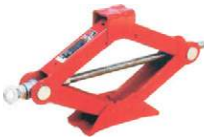
GATO MECÁNICO TIPO TIJERA