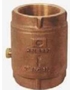
CHEQUE VERTICAL BRONCE