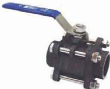
VÁLVULA BOLA AC P/F 4T