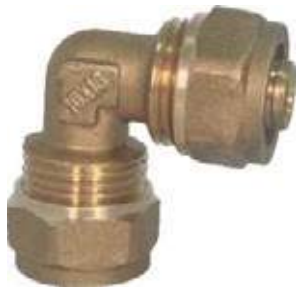
CODO BR/CR PEX AL PEX