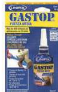
GASTOP COBRE PARA GAS FUERZA MEDIA