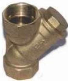
FILTRO Y EN BRONCE