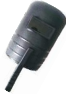
CARETA SOLDADOR CON MANGO