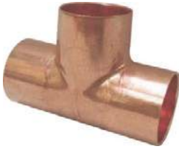
TEE COBRE SOLDAR C/C