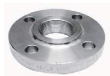
FLANCHE NPT SS304 150L