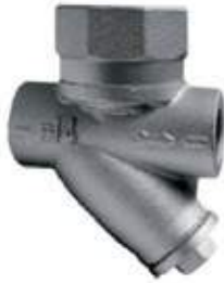
TRAMPA VAPOR HO C/FILTRO 150L