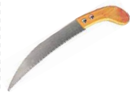
SERRUCHO CURVO PARA PODAR .