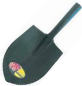
PALA REDONDA SIN MANGO