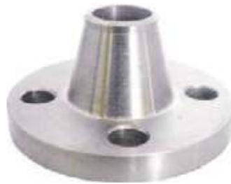
FLANCHE CUELLO SS304