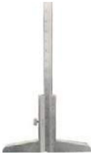
CALIBRADOR PIE DE REY PROFUNDIDAD