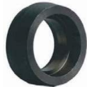
SOCKOLET AC SW 3.000 - 6.000

3.000L NPT 1/4" - 3" / SW 1/2" - 2" 6.000L NPT / SW 1/2" - 2"