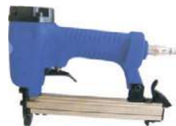
ENGRAPADORA NEUMÁTICA 6-13MM