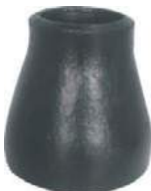
COPA AC P/S