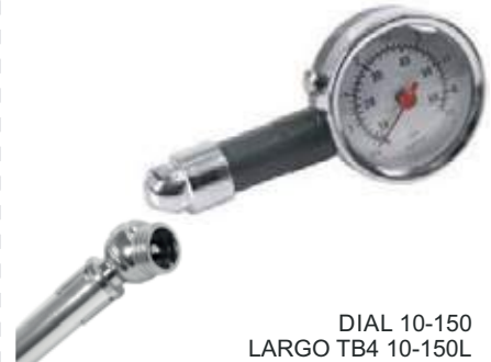
CALIBRADOR PARA LLANTA