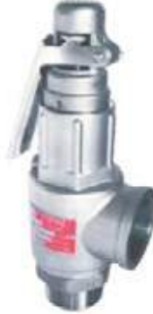
VÁLVULA SEGURIDAD SS316