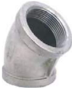
SEMICODO SS304 NPT 150L