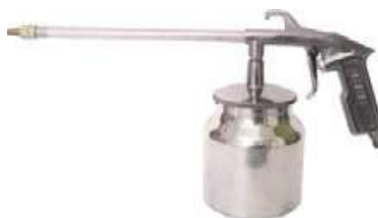
PISTOLA PETROLIZADORA DG10EC ALUMINIO