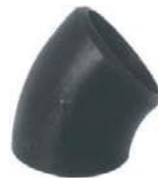
SEMICODO AC P/S