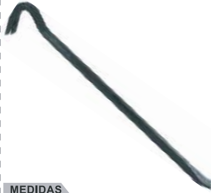
PATA DE CABRA AC