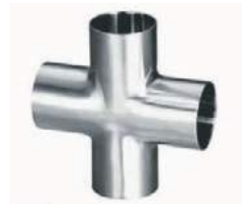
CRUZ SS304 SANITARIA