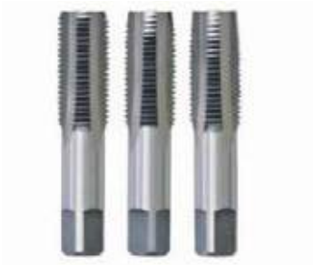
MACHO AC / HSS ROSCA MM, NC Y NF