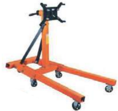
SOPORTE PARA MOTOR