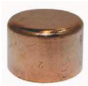
TAPON COPA COBRE SOLDAR