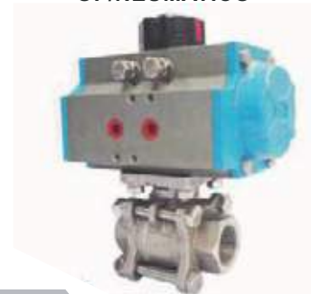
VALVULA BOLA SS316 P/F OP/NEUMATICO