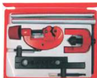
JUEGO CORTATUBO PRENSA Y REBORDEADOR