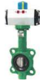
VÁLVULA MARIPOSA EPDM OPERADOR NEUMÁTICO

MEDIDAS DISCO: HIERRO, INOXIDABLE 150L - 16"