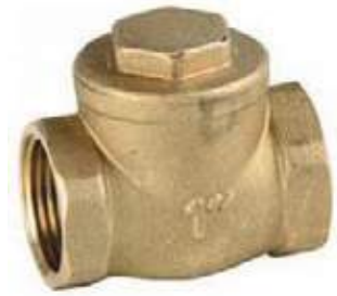
CHEQUE CORTINA BRONCE