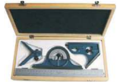
JUEGO ESCUADRA COMBINADA UNIVERSAL