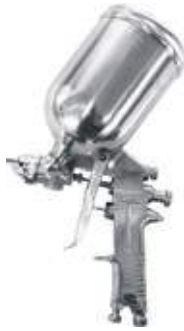
AERÓGRAFO ALTA S770G/RP 8026S GRAVEDAD