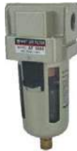
AUTOMATICO PARA FILTRO