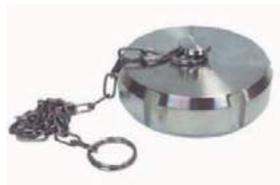
TAPON SMS SS304 SANITARIO CON CADENA