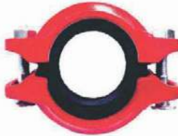
UNION FLEXIBLE HD RANURADA UL/FM