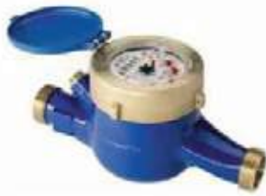
CONTADOR AGUA BRONCE CHORRO MULTIPLE