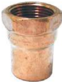
ADAPTADOR HEMBRA BRONCE/COBRE