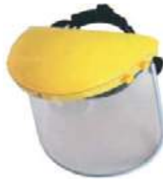
CARETA PROTECTORA TRANSP PARA ESMERIL