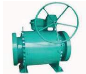
VÁLVULA BOLA AC TRUNNION FLG