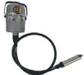
ESMERIL PLATERÍA TIPO BOTELLA