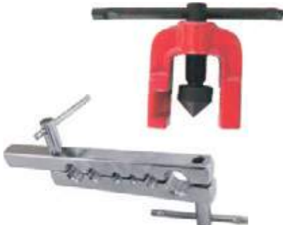
PRENSA Y REBORDEADOR PARA TUBO