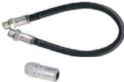
MANGUERA Y BOQUILLA PARA ENGRASADORA