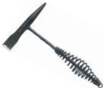
MARTILLO ESCARIADOR MANGO MADERA Y RESORTE