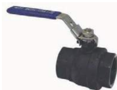
VÁLVULA BOLA AC PASO ESTANDAR 2000L