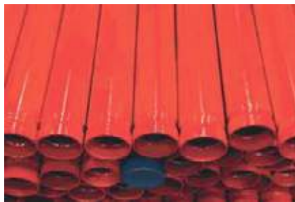
TUBO AC C/C RANURADO PINTADO