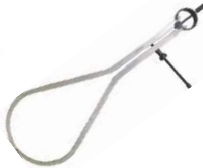
COMPAS PARA EXTERIORES