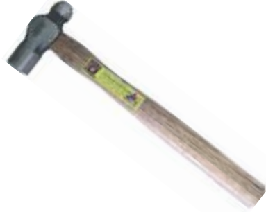
MARTILLO TIPO BOLA ACERO FORJADO PULIDO MANGO MADERA