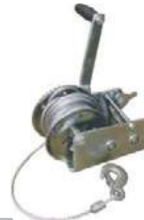
WINCH CON CABLE ACERO