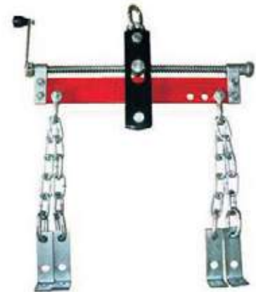
NIVELADOR PARA GRÚA LEVANTAMOTORES 2 TON