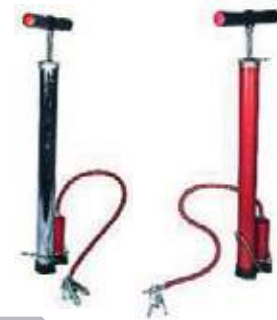
BOMBA MANUAL PARA AIRE PINTADA Y CROMADA