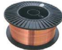
ROLLO DE ALAMBRE MIG