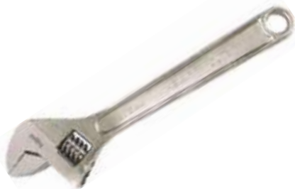
LLAVE AJUSTABLE CROMADA