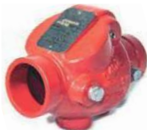
CHEQUE HD RANURADO 300 PSI UL/FM