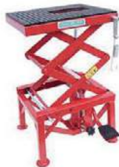
GATO HIDRÁULICO PARA MOTO