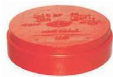
CAP HD RANURADO UL/FM