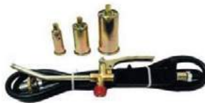
JUEGO SOPLETE GAS 3 BOQ