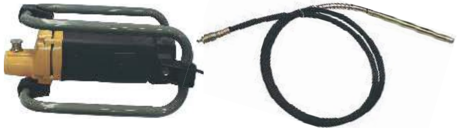
SET VIBRADOR PARA HORMIGON CON AGUJA