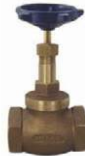
VÁLVULA GLOBO BR HELBERT