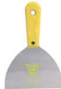
ESPATULA MANGO PLÁSTICO