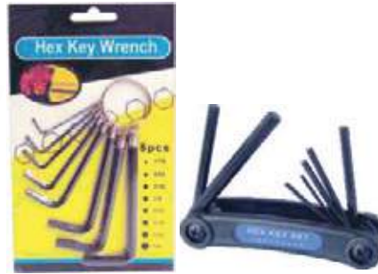
JUEGOS LLAVES ALLEN CROMO VANADIO