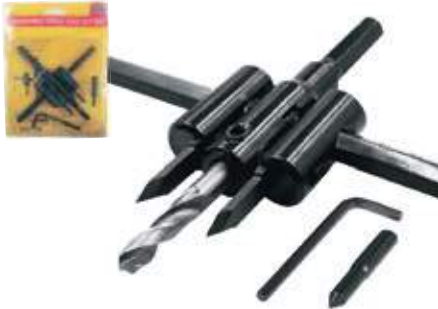
CORTACIRCULO AJUSTABLE PARA METAL/MADERA