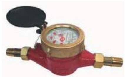
MEDIDOR PARA AGUA CALIENTE