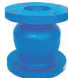
CHEQUE VERTICAL HO FLANCHADO