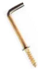
GRSA CANCAMO EN L COBRIZADO