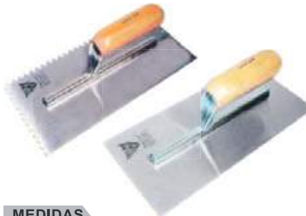
LLANA LISA Y RANURADA MANGO MADERA