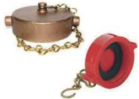
TAPA VALVULA ANGULAR