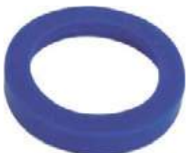
EMPAQUE PARA UNIVERSAL SANITARIA