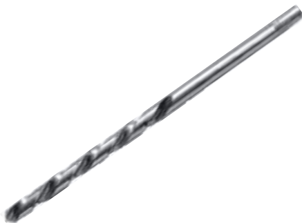
BROCA HSS LARGA