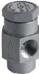
ROMPEDOR DE VACIO SS304