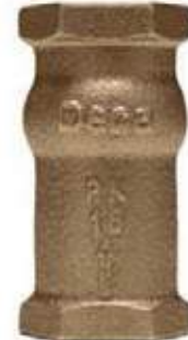
CHEQUE VERTICAL BRONCE