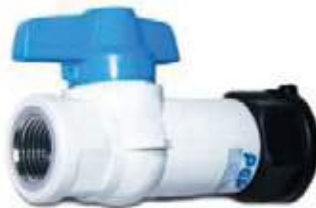
VALVULA DE BOLA TELESCOPICA PVC PCP