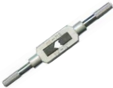
VOLVEDOR PARA MACHO