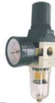
FILT-REG AIRE CON MANÓMETRO