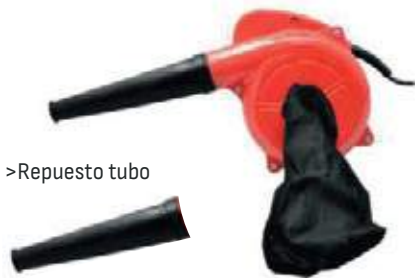
BLOWER ELECT 600W 110V (SOPLADOR)