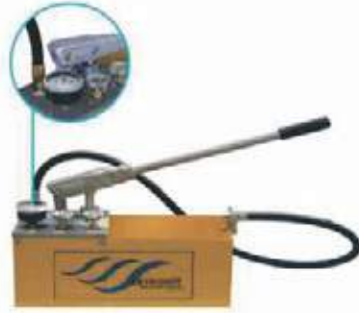
BOMBA MANUAL TIPO MALETIN