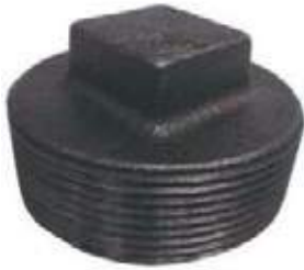
TAPON MACHO HIERRO