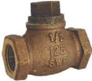
CHEQUE GLOBO BRONCE