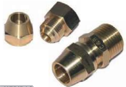
RACOR HEMBRA Y MACHO ROSCA NPT EN BRONCE