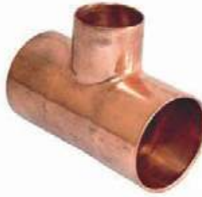
TEE REDUCIDA COBRE SOLDAR C/C