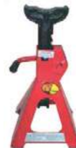
TORRE PARA VEHICULO TALLER