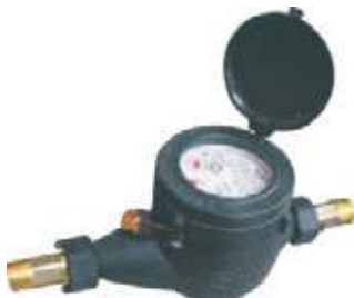
CONTADOR AGUA PLÁSTICO CHORRO ÚNICO.