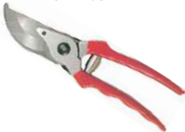
TIJERA PARA JARDÍN PUNTA CURVA