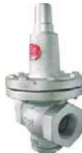
REGULADORA VAPOR HO/INOX