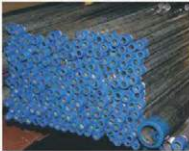
TUBO ACERO GALVANIZADO PARA AGUA