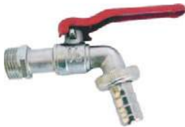
LLAVE BOLA CROMADA PARA MANGUERA