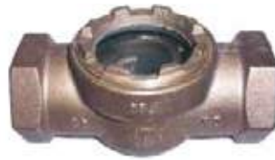
VISOR BRONCE 100L