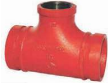
TEE REDUCIDA HD RANURADA NPT UL/FM