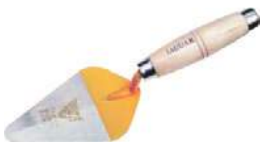
PALUSTRE MANGO MADERA