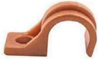
ABRAZADERA PLÁSTICA PARA TUBO FLEXIBLE