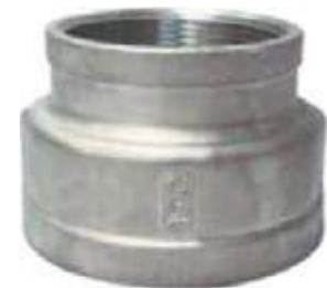
COPA SS304 NPT 150L