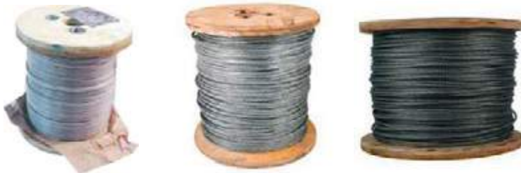
CABLE DE ACERO GALVANIZADO