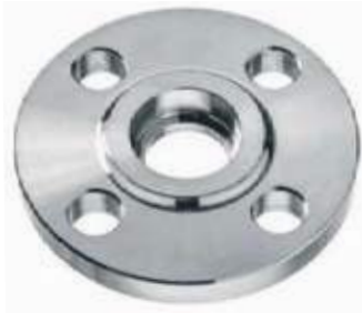
FLANCHE SW SS304