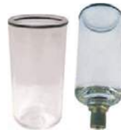
VASO PARA FILTRO