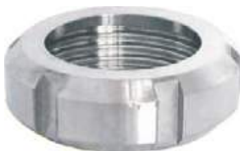
TUERCA SS304 PARA UNIÓN SMS