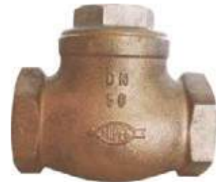
CHEQUE GLOBO BRONCE