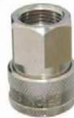
ACOPLE RÁPIDO AIRE PARA MANGUERA