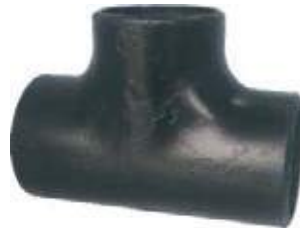
TEE AC P/S