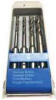
JUEGO 4PZ BROCA MURO TIPO SDS-PLUS