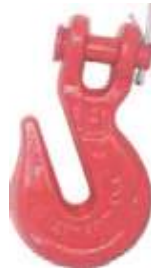
GANCHO AC/FORJADO PARA CADENA