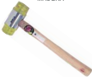
MARTILLO FIBRA MANGO MADERA