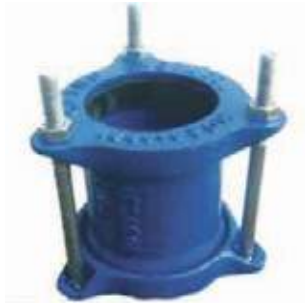
UNION HO TIPO DRESSER