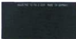
VIDRIO CARETA SOLDADOR RECTANGULAR