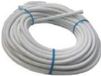
CONDUGAS BLANCO ROLLO