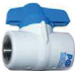
VALVULA BOLA SENCILLA PVC