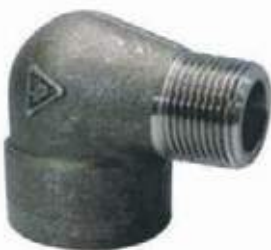
CODO MACHO AC

3.000L NPT 1/4" - 3" / SW 1/2" - 2" 6.000L NPT 1/2" - 3" / SW 1/2" - 2".