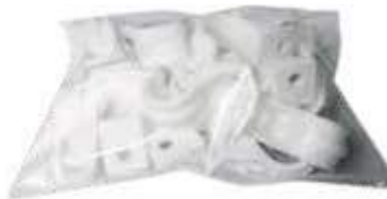
AHORRAPACK ABRAZADERA PLÁSTICA