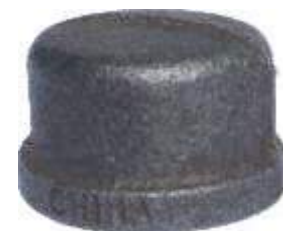
TAPON COPA HIERRO