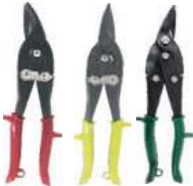
TIJERA PARA LAMINA TIPO AVIACIÓN