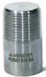
TAPON MACHO F304L NPT