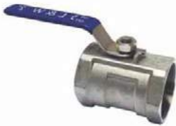
VÁLVULA BOLA SS316 P/R

PALANCA, VOLANTE RF, RTJ 150L - 1.500L \ 1/2" - 36"