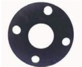
EMPAQUE NEOPRENO PARA FLANCHE 150