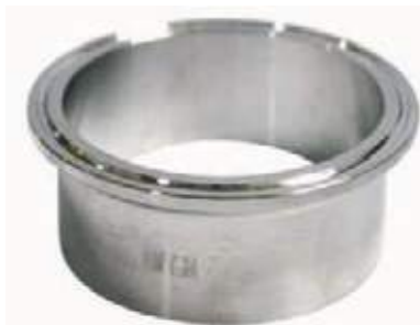
FÉRULA LARGA SS304 SANITARIA