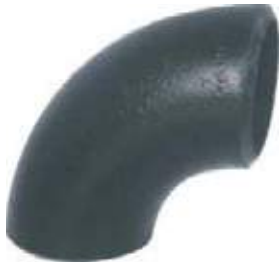
CODO AC P/S