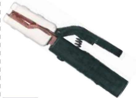
PORTA ELECTRODO COBRE