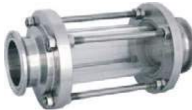
VISOR SS304 SANITARIO CLAMP