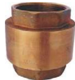
CHEQUE VERTICAL BR