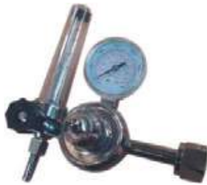
DISTRIBUIDOR DE GAS.