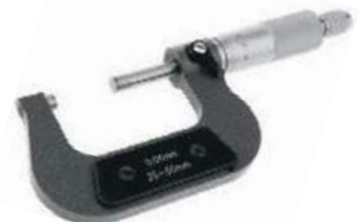
MICRÓMETRO PARA EXTERIORES