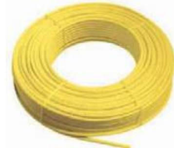
TUBO PE AL PE PARA GAS COLOR BLANCO Y AMARILLO