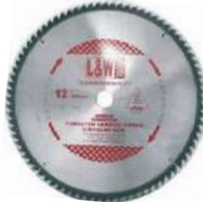
SIERRA CIRCULAR ALUMINIO TUNGSTENO