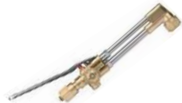
ANTORCHA CORTEP/KIT SOLDADURA.