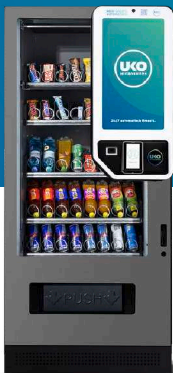
Abb. Big Screen M Indoor

Der Big Screen L ist der Gamechanger unter den 24/7 Automatenlösungen. Er kombiniert modernen Selfservice mit digitaler Werbefläche und maximaler Markenpräsenz – ideal für hochfrequentierte Standorte.