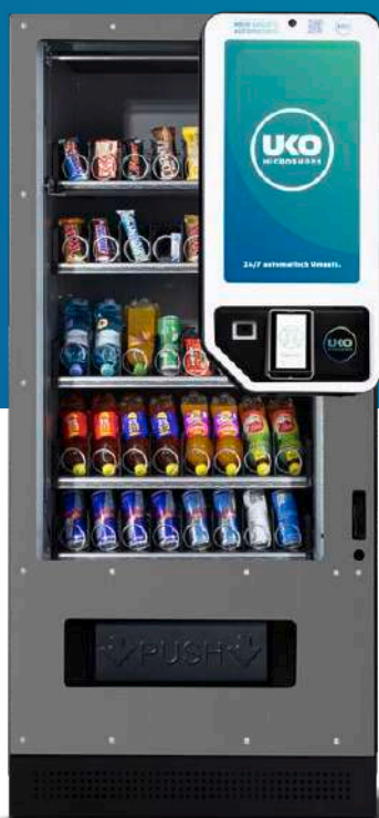
Abb. Big Screen M Outdoor

Der Big Screen S ist der Gamechanger unter den 24/7 Automatenlösungen. Er kombiniert modernen Selfservice mit digitaler Werbefläche und maximaler Markenpräsenz – ideal für hochfrequentierte Standorte.