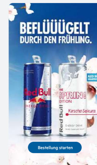
Promotion Screen Maße: 1080 x 1920 px