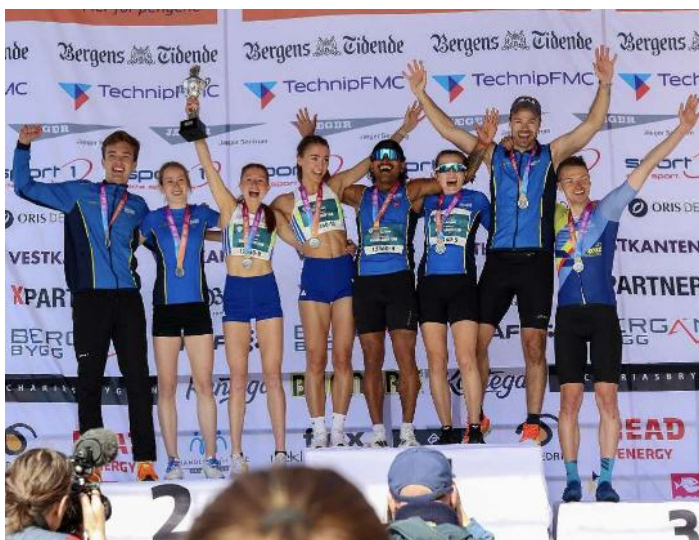
Varegg tar 1. og 2.plass i Bergen city marathon stafetten.

Strålende stemning i Holmenkollstafetten. Sol og fin temperatur for løping. Rekordpåmelding og mange sterke lagoppstillinger. Spenning i toppklasse og to velkomponerte lag fra Varegg. Det meste lå tilrette for sterke opplevelser i Oslogatene lørdag. Vareggløperne grep mulighetene de fikk og lot seg ikke sette ut. Sylskarpe konkurrenter og mye ståhei satte ikke våre utvalgte løpere ut av fatning og fokus.