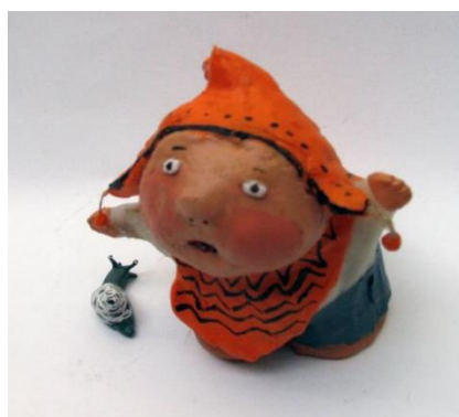
Niño interior y su paraíso Masilla epoxi modelada y policromada 2014