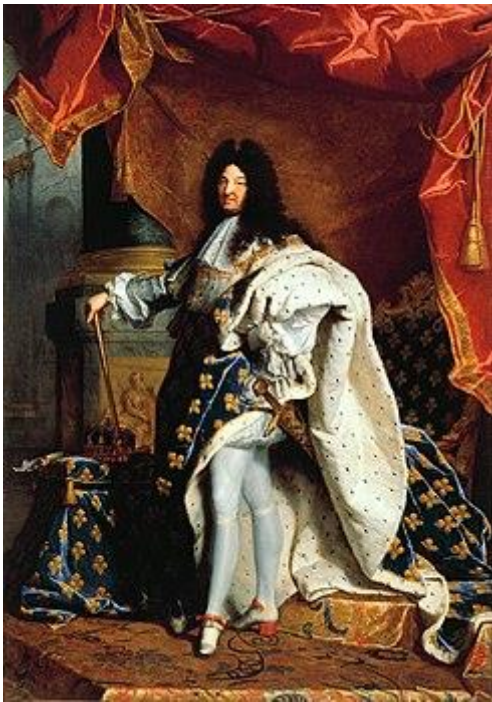
Hyacinthe RIGAUD Louis XIV Óleo s/lienzo 2,79 x 1,90 m 1701 Colección del Museo del Louvre