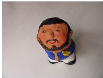
Lo que no eres se lo debes a los poetas Resina epoxi policromada 2014