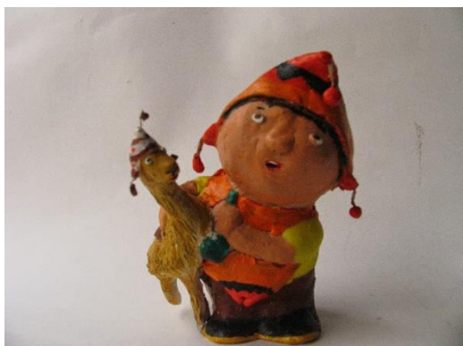
La vida es un carnavalito continuo Masilla epoxi modelada y policromada 2014

En su descarrilamiento, Sandro Pereira auratiza la labilidad con que encara sus prácticas, y esto, a mi juicio, merced a la invocación de una nueva categoría: la de la ternura. Con ella, su frágil y silenciosa obra se distingue de otras tantas mejor construidas en las que, paradójicamente, el sentido ya se ha saturado. En efecto, hartos del amaneramiento del “arte contemporáneo”, lejos de los relatos conocidos, como una micro-epifanía, la ternura nimba con su inesperado brillo la voluntad fenomenológica con la que el objeto se convierte en sujeto, la autoficción con la que una simple escena deviene relato.