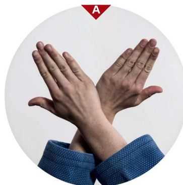
Bild A zeigt dir genau die Haltung der Hände. Die Daumen beider Hände greifen in die Jacke von Uke, die Finger bleiben außen. Die Haltung der Hände ist also „normal“ (nami). Greife mit beiden Händen tief in den Kragen von Uke. Beim Würgen ziehst du die Ellbogen auseinander und drückst mit deinen Handkanten gegen den Hals von Uke.