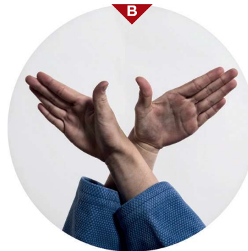
Bild B zeigt dir genau die Haltung der Hände. Beide Handflächen bzw. Daumen zeigen nach oben. Die Position der Hände ist also „verkehrt oder umgekehrt“ (gyaku). Greife ebenfalls mit beiden Händen (Finger innen) tief in Ukes Kragen und würge, indem du beide Ellbogen auseinanderziehst.