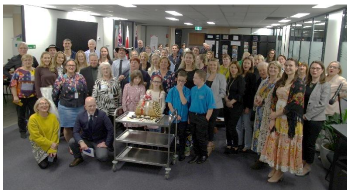
Goście przy jubileuszowym torcie

Koncert zakończono odśpiewaniem „Sto lat” i zdmuchnięciem świeczek na jubileuszowym torcie. Tort w formie cannoli był nie tylko efektowny, ale także pyszny.