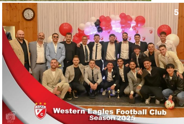
1-2. Koncert „Nasze Polskie Kwiaty”. 3. Obóz piłkarski z Legią Warszawa. 4-5. Jubileuszowa Gala 75-lecia Western Eagles FC