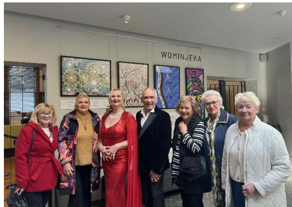
1. Wycieczka do Bunjil Place. 2. Lunch w siedzibie Biura Opieki „PolCare”. 3. Wycieczka do John Cain Arena. 4. Wycieczka do Drum Theatre, Dandenong