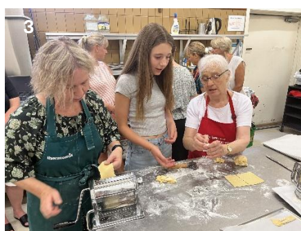
Zdjęcia 2-4: Warsztaty kulinarne w Domu Orła Białego w Geelong