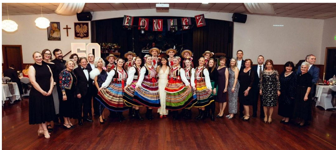
Uczestnicy Balu 50-lecia „Łowicza”

Zespół Wokalno-Taneczny „Łowicz”, założony w Melbourne w 1975 roku, obchodził swoje 50-lecie serią uroczystych wydarzeń, które zgromadziły pokolenia tancerzy, śpiewaków, sympatyków i społeczności polonijną. Jubileusz był hołdem dla bogatej historii zespołu oraz tych, którzy przez lata tworzyli jego sukcesy.