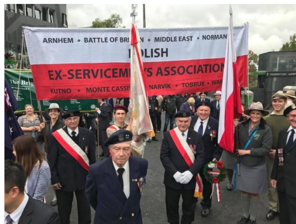
Członkowie SPK i ZHP Podhale Melbourne podczas dorocznej Parady z okazji Dnia Anzaca w Melbourne