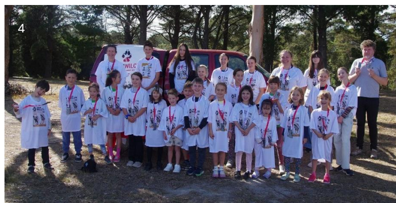
fot. 1 Uczestnicy uroczystości w Keysborough; fot. 2 Poczty sztandarowe SPK Koła nr 3 w Melbourne i ZHP „Podhale” w Melbourne podczas Mszy Św. za Ojczyznę; fot. 3 Uczestnicy na trasie Biegu „Tropem Wilczym” w Rowville; fot. 4 Uczestnicy Biegu „Tropem Wilczym” z Polskiej Szkoły Sobotniej w Rowville