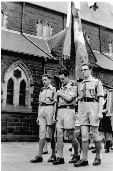
W poczcie sztandarowym Solidacji Mariańskiej przy Kościele św. Ignacego w Richmond

tym roku już oficjalnie byłem członkiem ZHP „Podhale” w Melbourne.