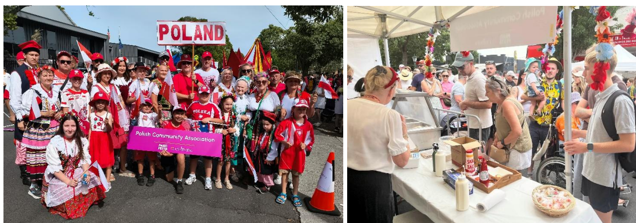
fol. 1 Uczestnicy polskiej grupy na paradzie Pako Festy, 28 lutego 2026, Geelong; fol. 2 Kolejka do polskiego stoiska

Po obejrzeniu i zachwyceniu się barwną paradą przedstawiciele naszej różnorodnej społeczności wielokulturowej, wybrałem się na spacer wzdłuż Pakington Street w West Geelong, gdzie w powietrzu unosiły się kuszące aromaty tradycyjnych potraw przygotowanych dla tysięcy uczestników. Tłumy odwiedzających kosztowały dań z różnych stron świata, co dodatkowo wzbogaciło i tak już wyjątkowy dzień.