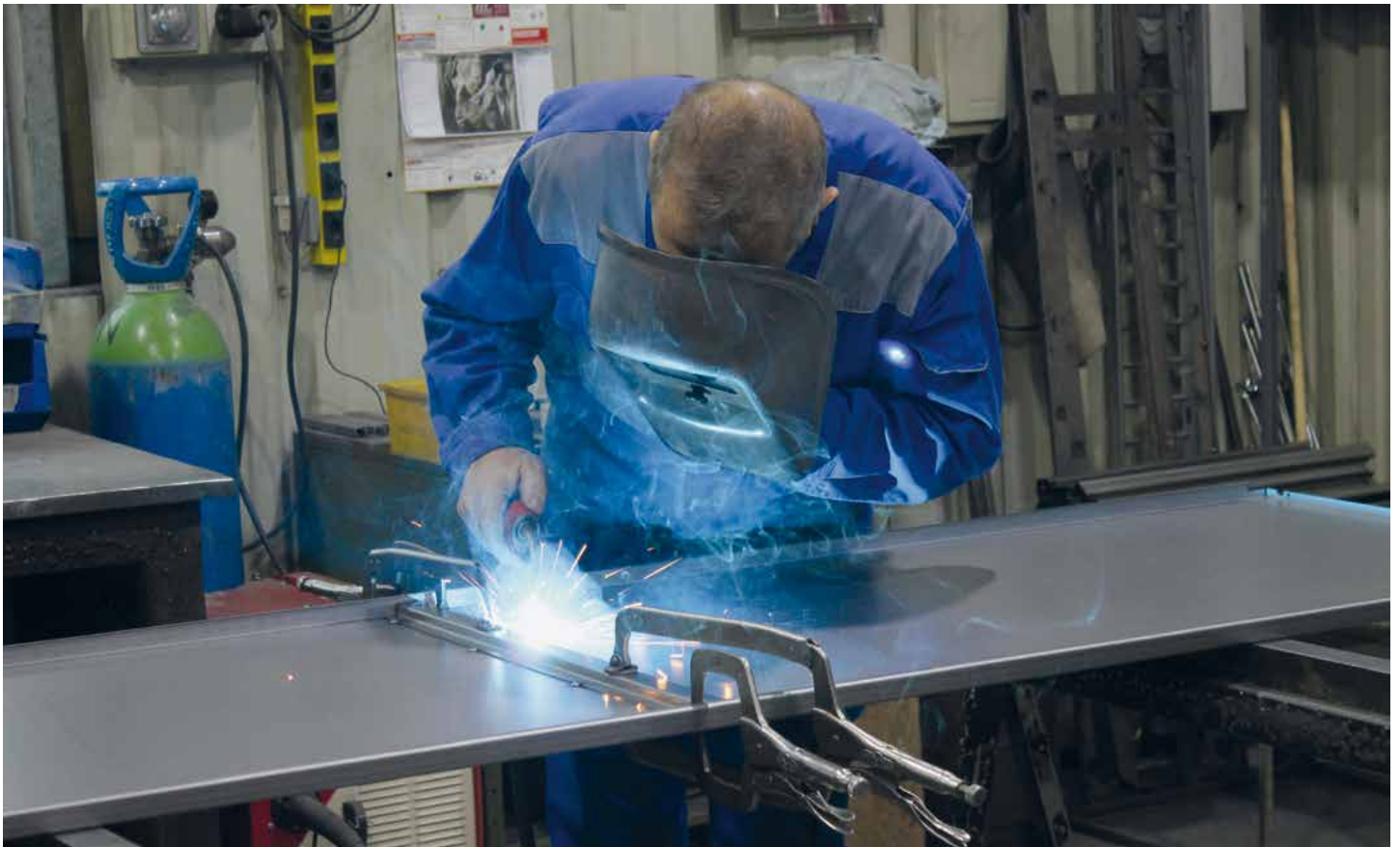
Siegerfoto des Fotowettbewerbes der Kategorie „Arbeit“