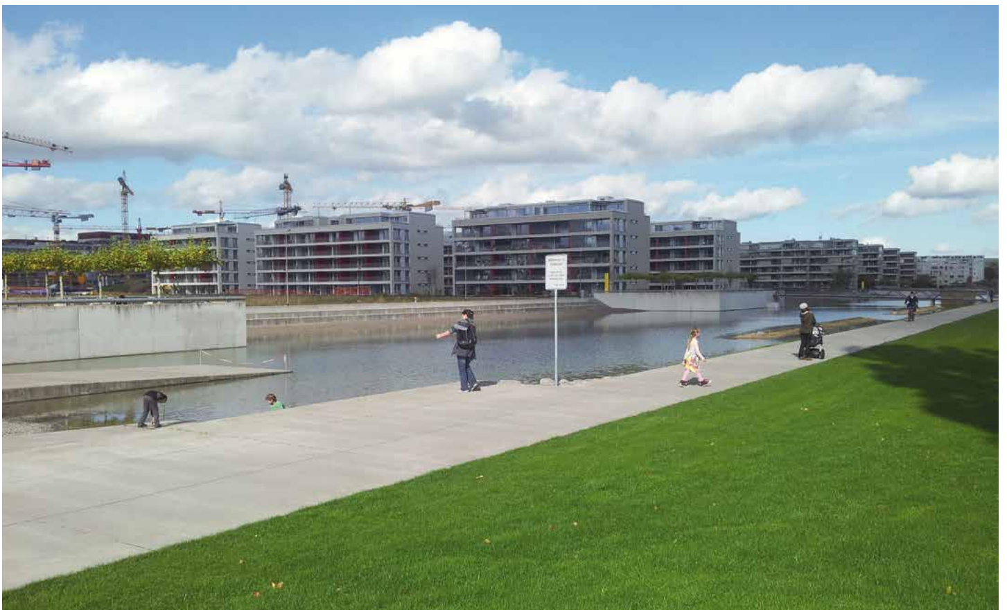
OBEN: Arbeiten am Flughafen Zürich