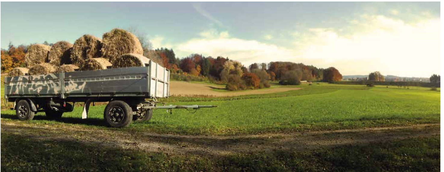
Die drei besten besten Einsendungen und ihre Macher