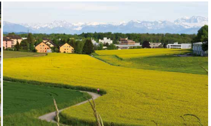
Siegerfotos des Fotowettbewerbs aus den Kategorien „Wohnen“ und „Freizeit“