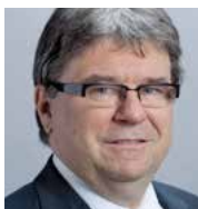
Lothar Ziörjen Stadtpräsident Dübendorf Nationalrat