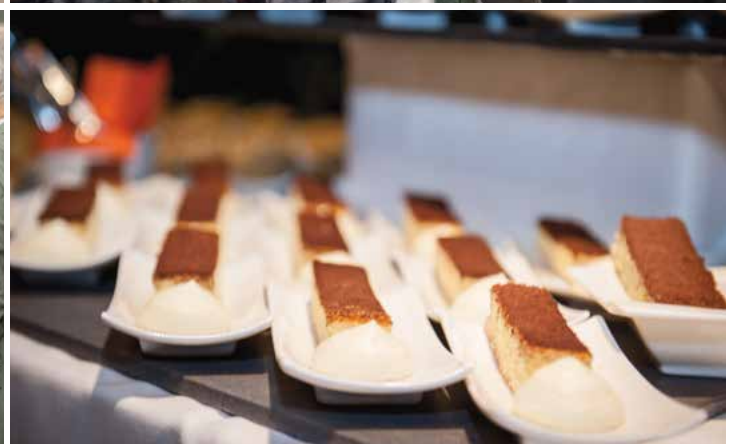
Impressionen vom Wirtschaftsforum 2013