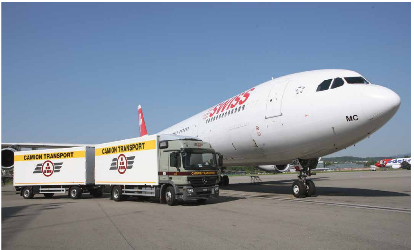
Siegerfoto aus dem Fotowettbewerb der Kategorie „Arbeit“