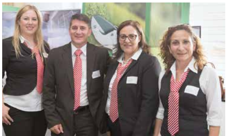
Impressionen der Anlässe 2016