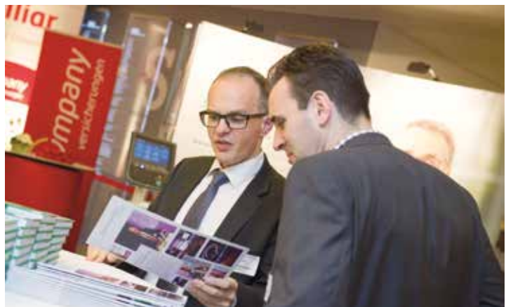
Impressionen des Wirtschaftsforums 2016