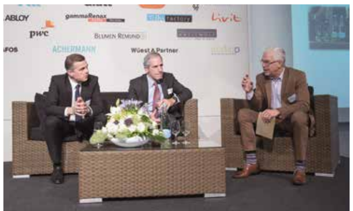
Impressionen des 2. Immobilien-Summit 2016