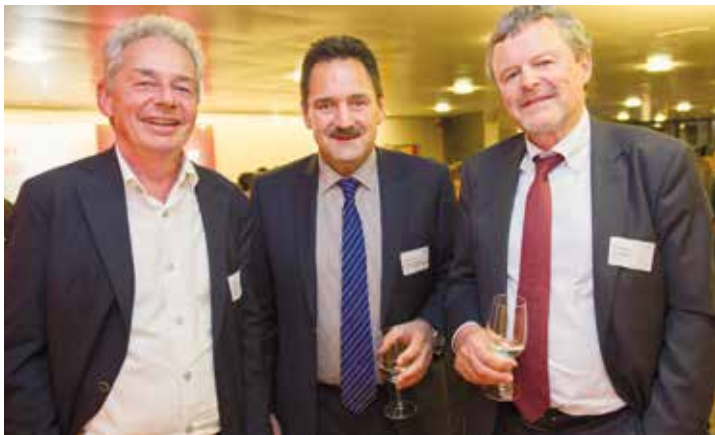
Impressionen des Wirtschaftsforums 2016