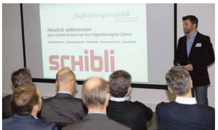
Impressionen der Anlässe 2016