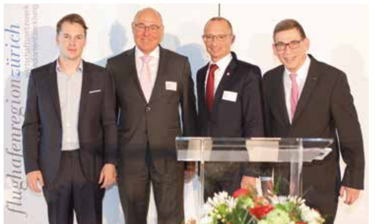
Impressionen der Anlässe 2016