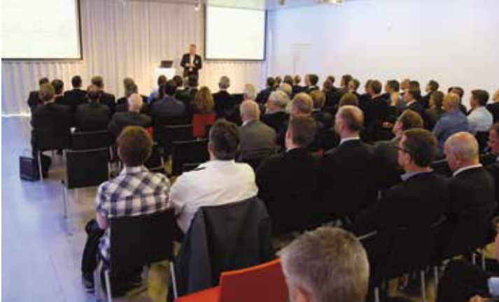
Impressionen der Anlässe 2016