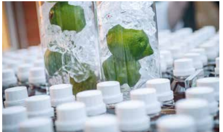
Impressionen der Anlässe 2014