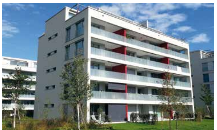
links oben: LUX Gebäude in Glattbrugg, rechts oben: AQUATIKON im Glattpark links unten: THE CIRCLE am Flughafen Zürich (Visualisierung), rechts unten: LEMATT im Glattpark