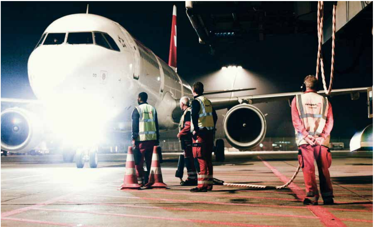
Arbeiten am Flughafen Zürich