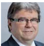
Lothar Ziörjen Stadtpräsident Dübendorf Nationalrat