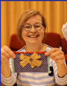
Workshop costura sustentável - Lousada