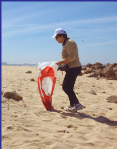
Limpeza de praia - Bioliving