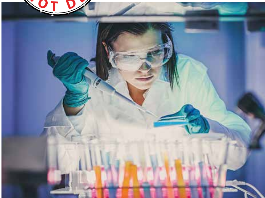
Basisforschung im Labor: Xlife Sciences, versucht bei Entwicklungen ganz früh dabei zu sein

In dieser Rubrik stellt BÖRSE ONLINE heiße Spezialwerte für spekulative Anleger vor. Da hohen Kurschancen in der Regel hohe Risiken gegenüberstehen, sollten Kaufaufträge limitiert und Stoppkurse beachtet werden.