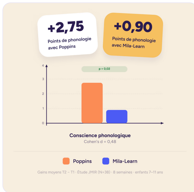
Figure 5. Conscience phonologique : +2,75 points avec Poppins contre +0,90 point avec Mila-Learn, soit une différence de +1,85 point en faveur du dispositif combiné.

Cette étude confirme l'efficacité clinique de Poppins sur la fluidité de lecture (test BALE) et les compétences phonologiques, ouvrant la voie à l'évaluation de son bénéfice dans les parcours de soins.