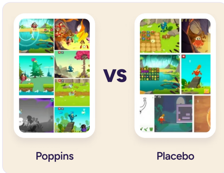
Figure 3. Le dispositif expérimental (Poppins / Mila-Learn) et le jeu placebo présentaient des caractéristiques graphiques comparables, afin de préserver le double aveugle.