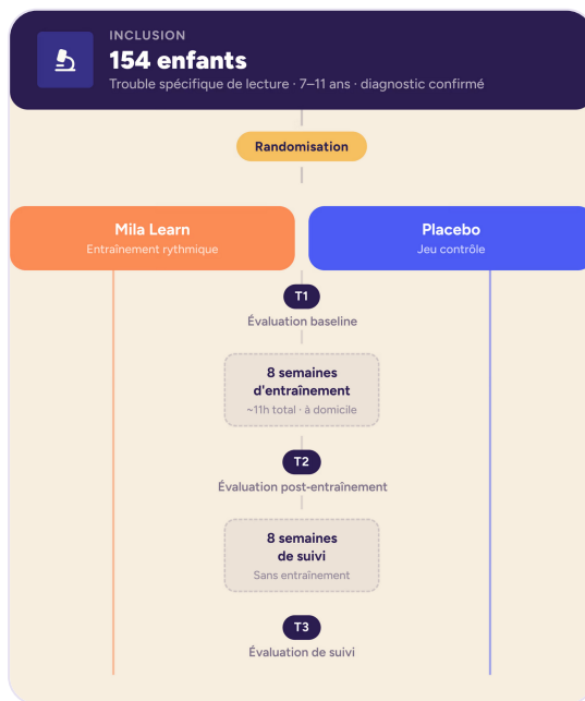
Figure 1. Organisation de l'essai randomisé : inclusion (154 enfants), randomisation entre groupe Mila-Learn et groupe placebo, puis évaluations à T1, T2 et T3 (suivi).