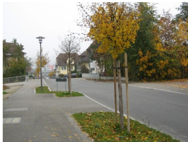
Verkehrsdaten Herrenberg, Ermensee, beide Richtungen, Tempobeschränkung 60km/h