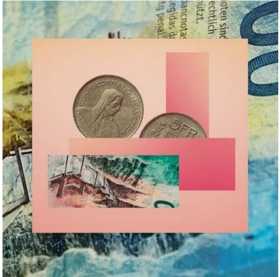
Illustration: Suse Heinz

Für die Stiftungsrate der Gemeinschafts- und Sammelstiftungen ist der Zinsentscheid jedes Jahr eine Gratwanderung. Es ist ihre Aufgabe zu entscheiden, welcher Anteil der Rendite in Form von Zinszahlungen an die aktiv Versicherten geht und wie viel in die Reserven fließt. Einzelne Pensionskassen sahen sich nach dem Endjahresrallye an den Börsen gezwungen, den Versicherten 2021 eine einmalige Zusatzverzinsung zu gewähren. So schreiben etwa Futura und PKG ihren Versicherten dieses Jahr eine zusätzliche Verzinsung gut. Dieses kurzfristige Supplement wird die Versicherten freuen, sie erhalten so einen Teil der Rendite direkt auf dem Vorsorgekonto gutgeschrieben und profitieren später von höheren Altersleistungen.