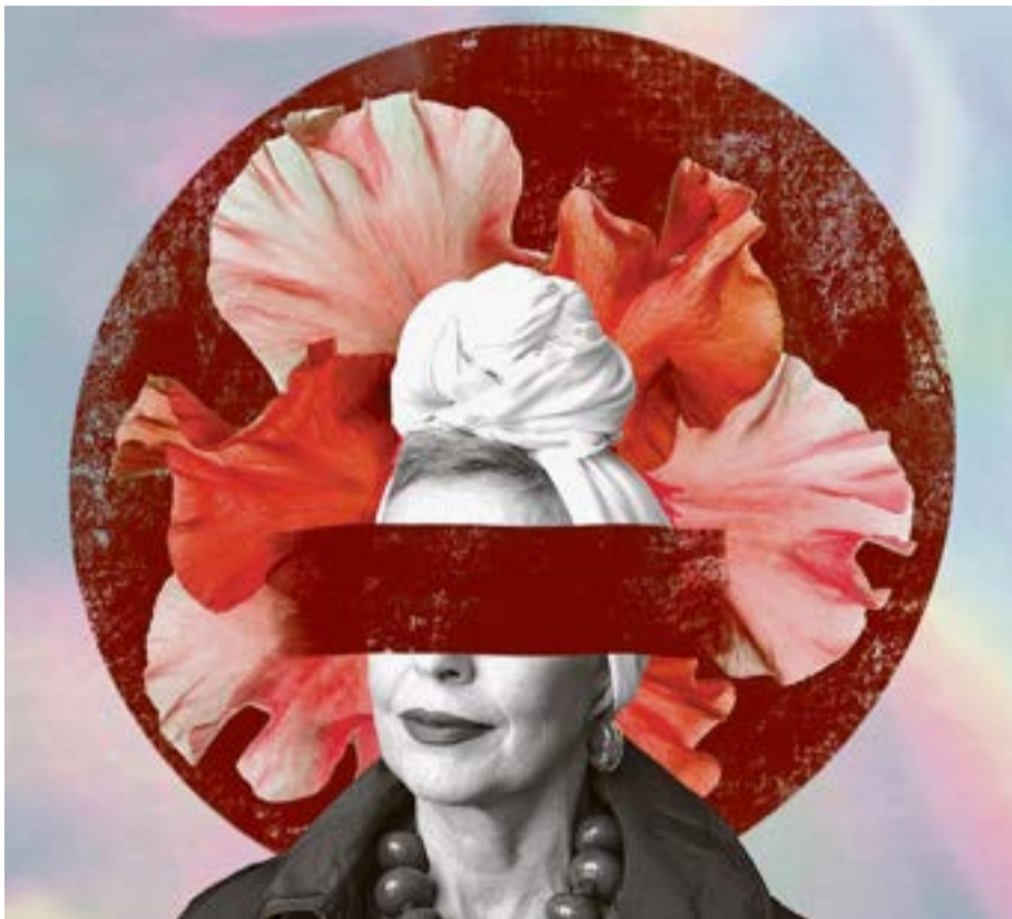
Illustration: Suse Heinz

Dies zeigt, dass eine Querfinanzierung nur möglich ist, wenn im Zeitpunkt der Pensionierung ausreichend überobligatorisches Guthaben vorhanden ist. Für angehende Pensionäre, die lediglich obligatorisches Sparkapital haben, muss die Rente nach den geltenden Mindestvorgaben berechnet und gegebenenfalls durch die Vollversicherung aufgestockt werden.