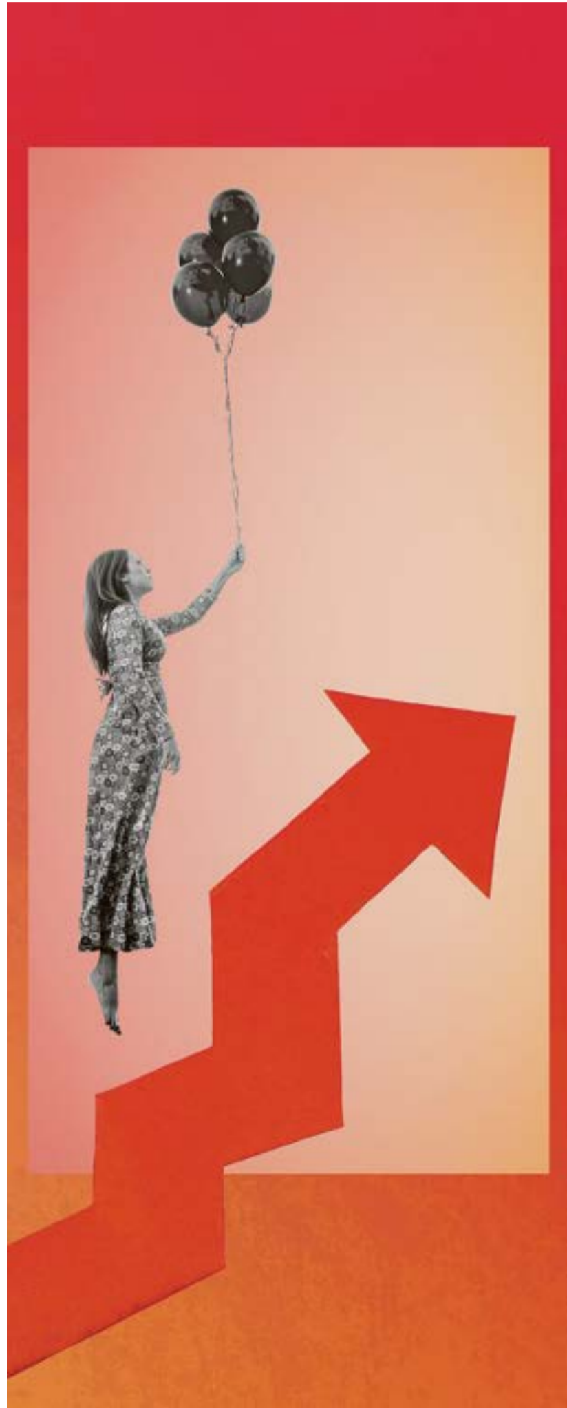
Illustration: Susse Heinz

Weibel Hess & Partner AG hat im Auftrag der Sonntagszeitung und der «Finanz und Wirtschaft» die Anbieter im 1e-Markt verglichen. Sie wurden mit einer verdeckten Ausschreibung für eine Unternehmung mit sechs Kadermitarbeitenden angeschrieben. Das Mystery Shopping zeigt die grossen Differenzen bei den Risiko- und Verwaltungskosten sowie den Stiftungsgebüh-