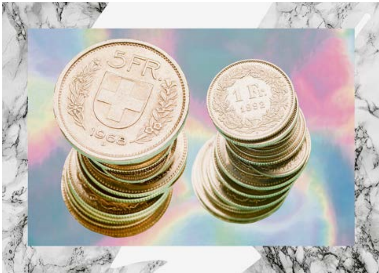
Illustration: Susie Heinz

Firmen sind gut beraten, ihre Pensionskassenlösung regelmässig zu überprüfen. In den vergangenen Jahren haben viele Pensionskassen ihre Risikoprämien gesenkt. Treue, langjährige Kunden haben jedoch oft das Nachsehen. Ohne Eigeninitiative profitieren sie nicht von kostengünstigen Risikoprämien. Bestehende Anschlussverträge werden mit unveränderten Konditionen über Jahre weitergeführt. Wollen Firmen nicht zu den Verlierern gehören, ist eine regelmässige Prüfung und die Aushandlung neuer Konditionen ein Muss. Weitere Aspekte wie Sicherheit, Anlagestruktur und Altersleistungen sind bei der Prüfung selbstverständlich miteinzubeziehen.