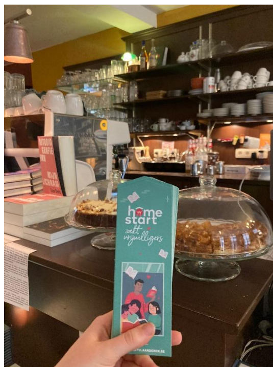
Bladwijzers in boekenwinkel Barboek en Boekarest i.k.v. jeugdboekenmaand