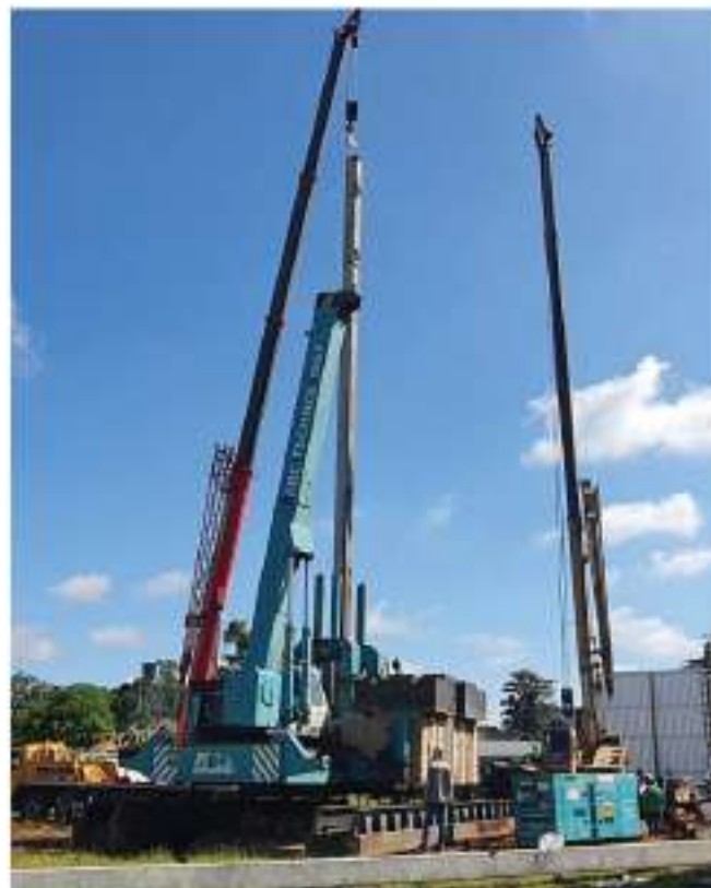
ตอกเสาเข็มทุกหลัง