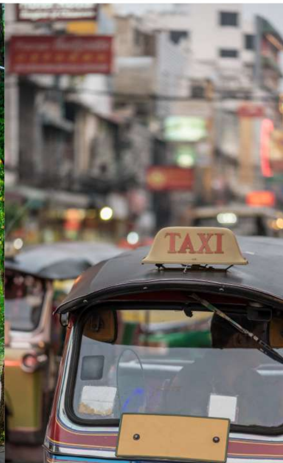
การคมนาคม