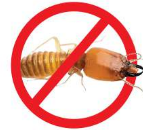
วางระบบกำจัดปลวก