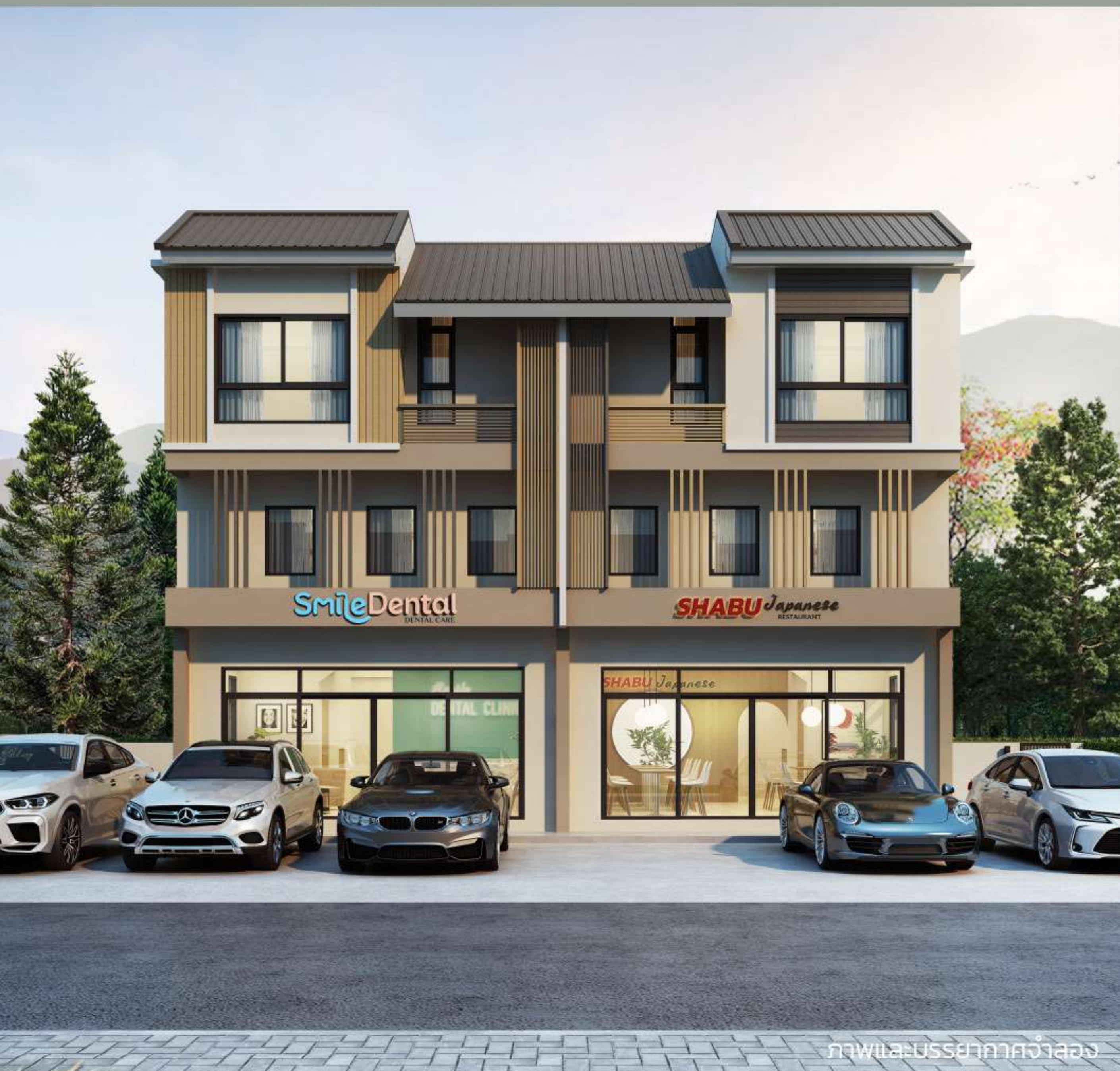
ภาพและบรรยากาศจำลอง