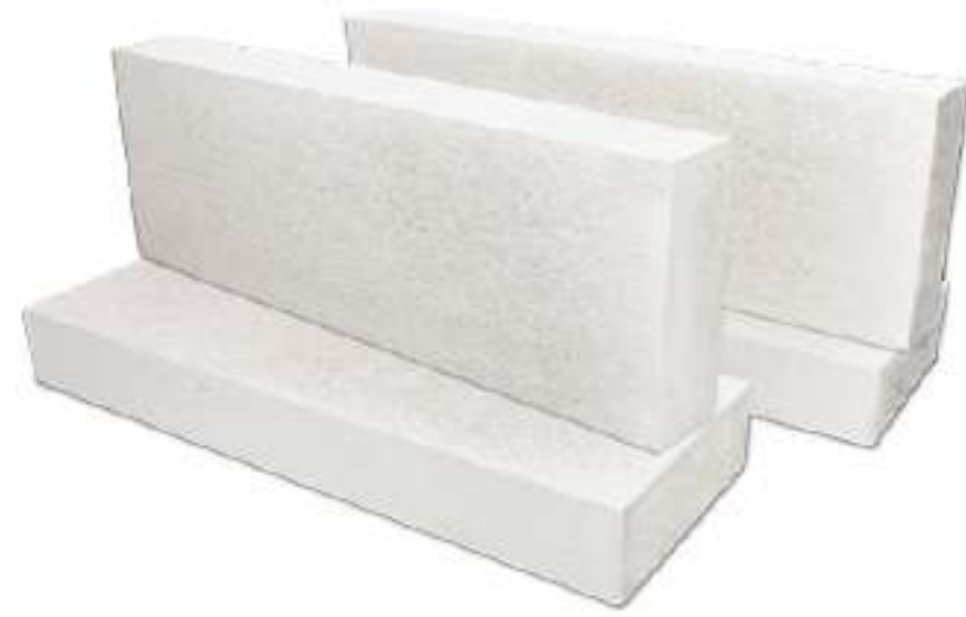
ก่อผนังด้วยอิฐมวลเบา