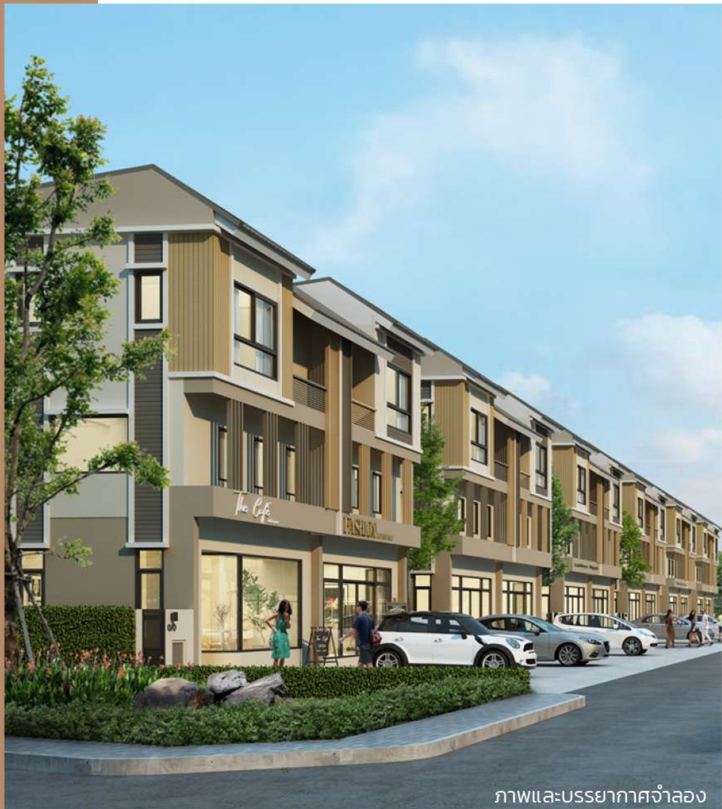
ภาพและบรรยากาศจำลอง

Mix & Match ระหว่างสถาปัตยกรรม Modern ที่มีความทันสมัย และ Homey รู้สึกอบอุ่น ให้มีความลงตัวมากขึ้น และสามารถรองรับการขยายเมื่อครอบครัวใหญ่ขึ้นในอนาคต โดยออกแบบให้เป็นบ้านแฝด 1 คู่นั้นสามารถนำผนังออกและเชื่อมต่อกันได้เป็นโถงขนาดใหญ่ ส่วน Facade แม้เป็นบ้านแฝดถึงคล้ายกันแต่ต่างกันโดยสีสีน Earth Tone ในการตกแต่งผนังไม้