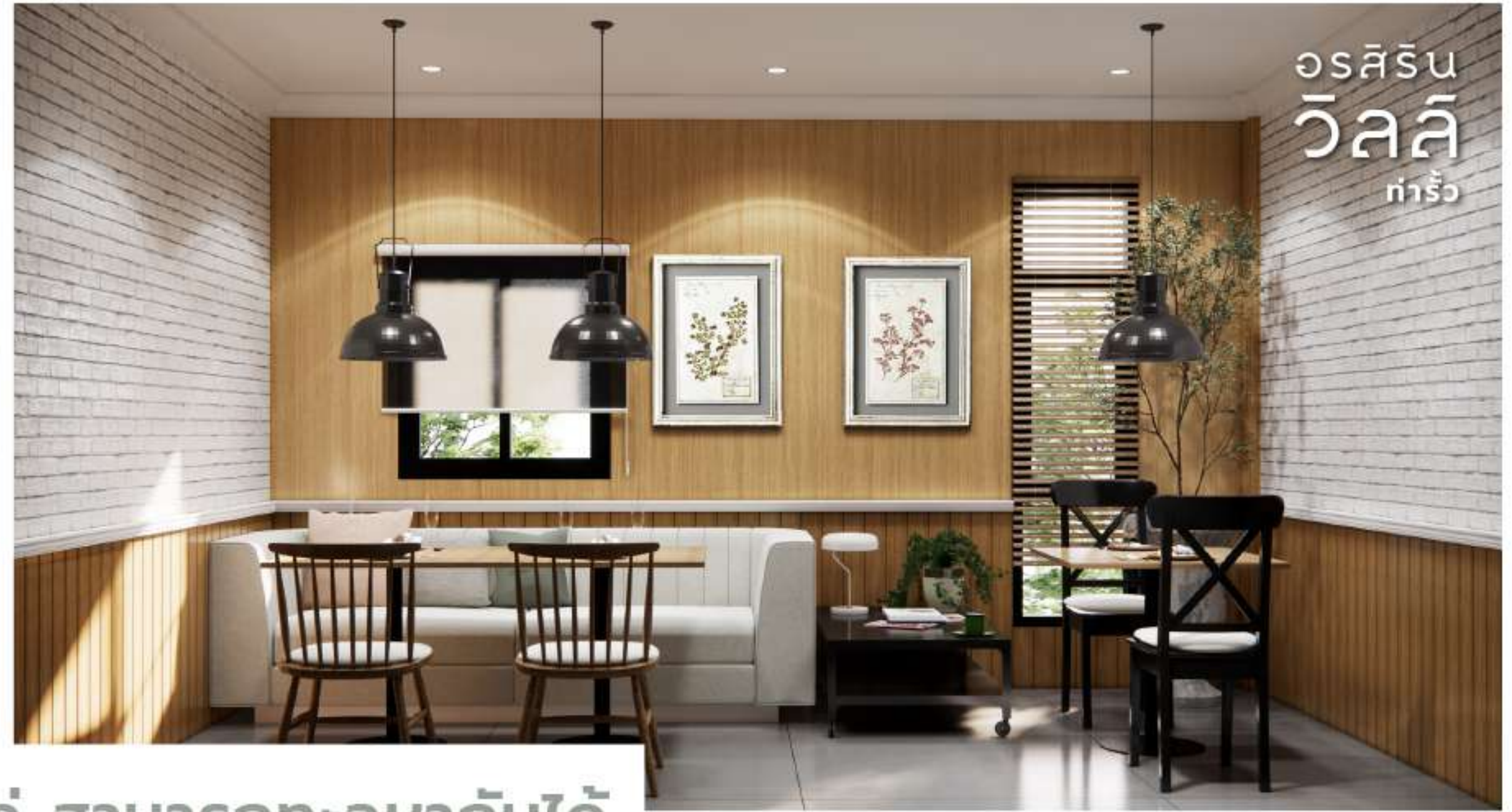
ออกแบบฟังก์ชันบ้านคู่ สามารถทะลุหากันได้