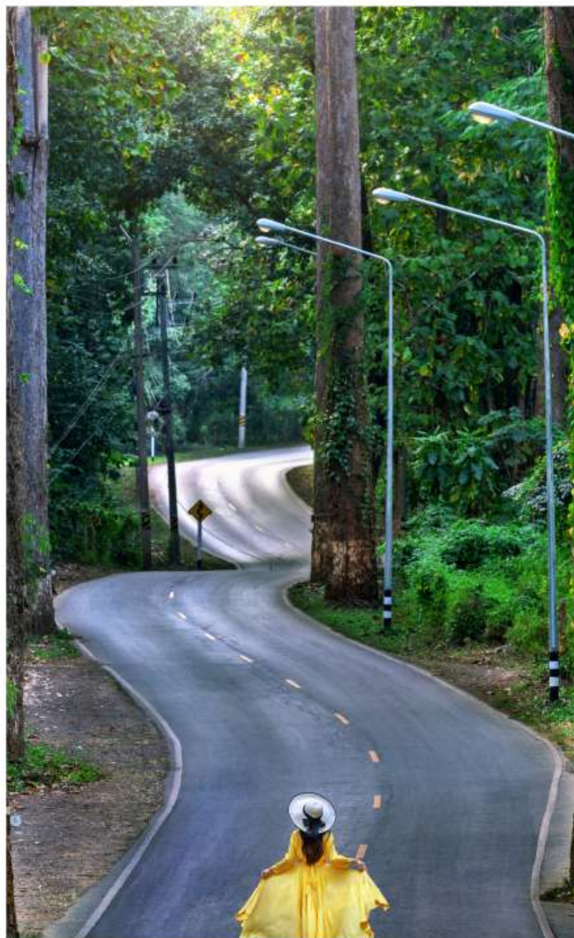
ธรรมชาติ

เป็นเมืองน่าอยู่ เป็นเมืองวัฒนธรรม และแหล่งท่องเที่ยว