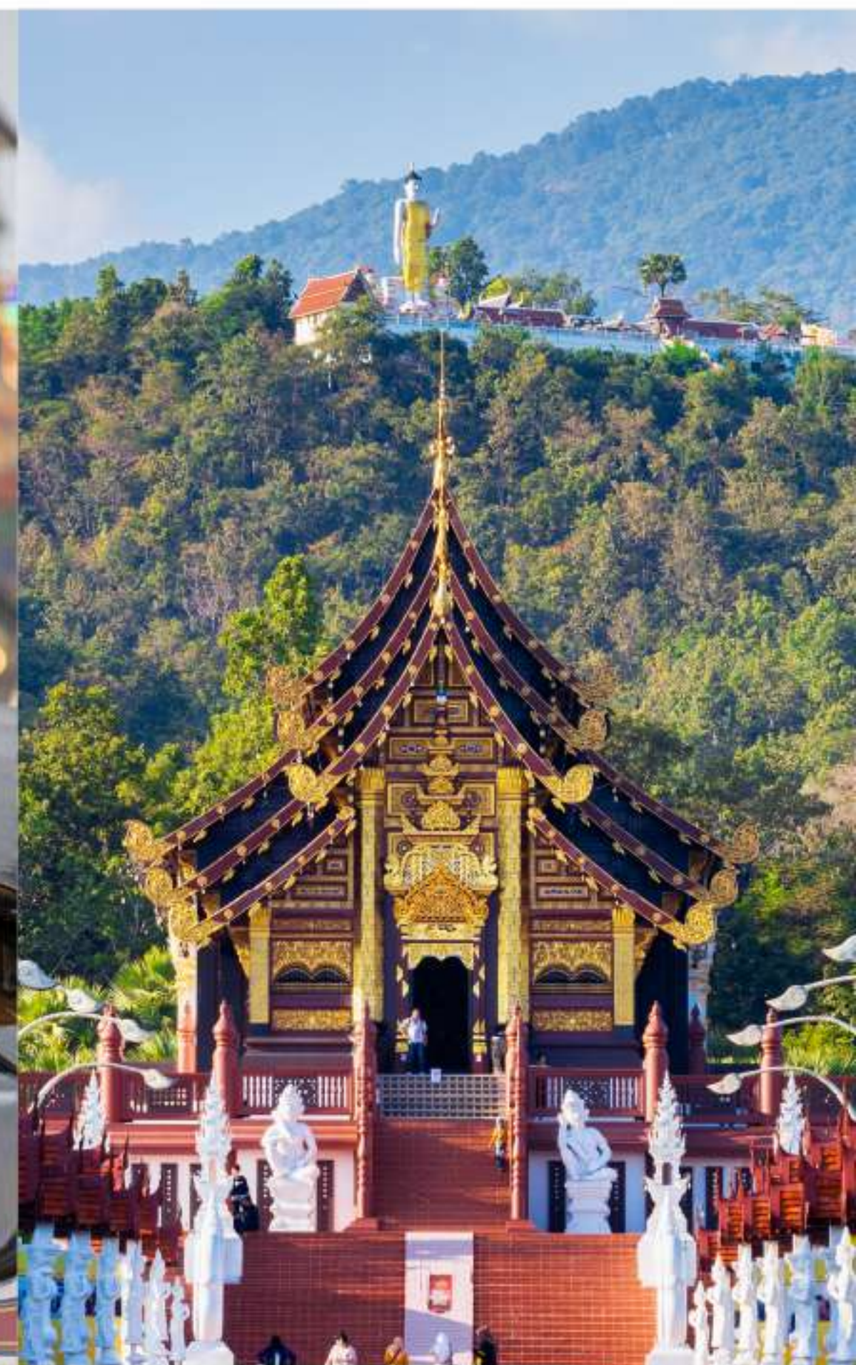
วัฒนธรรม