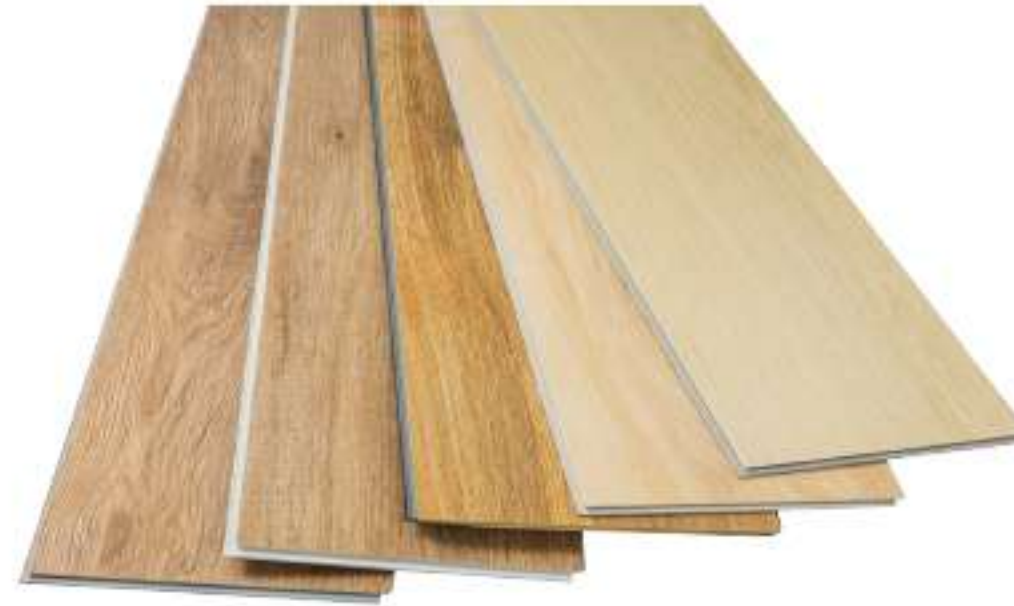
พื้น SPC ผลิตมาจาก แคลเซียมคาร์บอเนต (หินปูน)