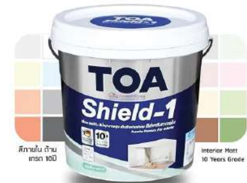
สีภายใน TOA สามารถทำความสะอาดได้ง่าย