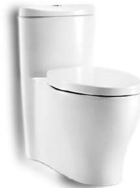
สุขภัณฑ์ระดับโลก จาก American Standard