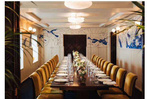
SALON PROUST 17 à 26 convives