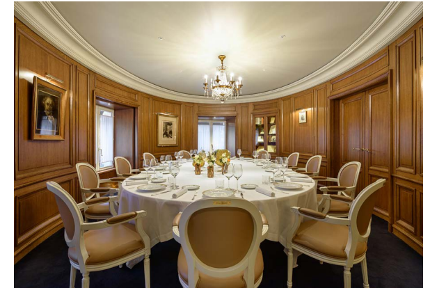
ESPACE GONCOURT 12 à 16 convives