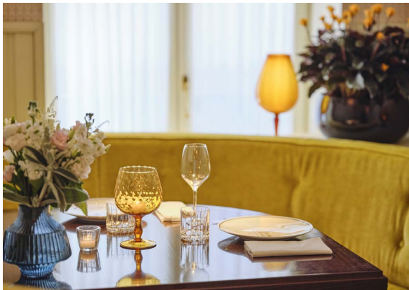
SALON COLETTE 1 à 3 convives