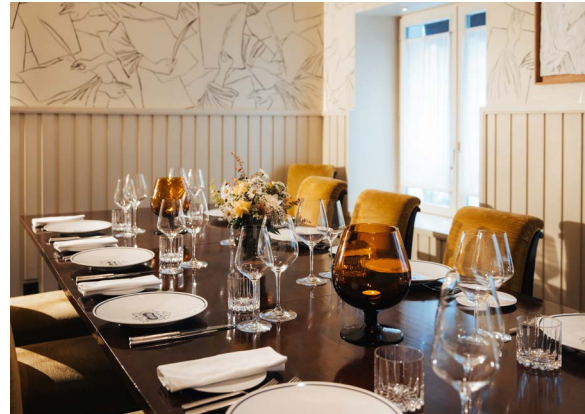
SALON RENAUDOT 6 à 12 convives