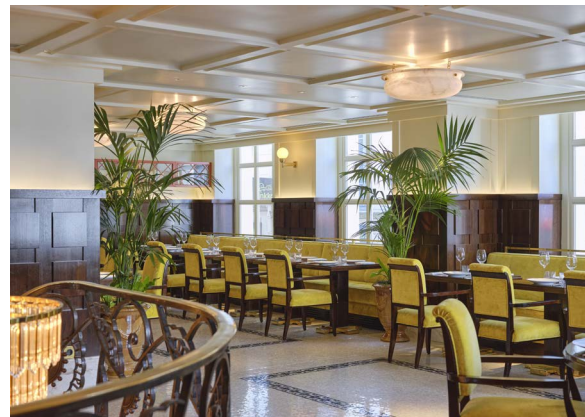
ESPACE BIBLIOTHÈQUE 26 à 56 convives