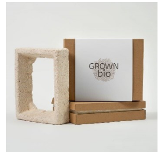
Voorbeeld Mycelium verpakking