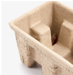
Voorbeeld pulp verpakking