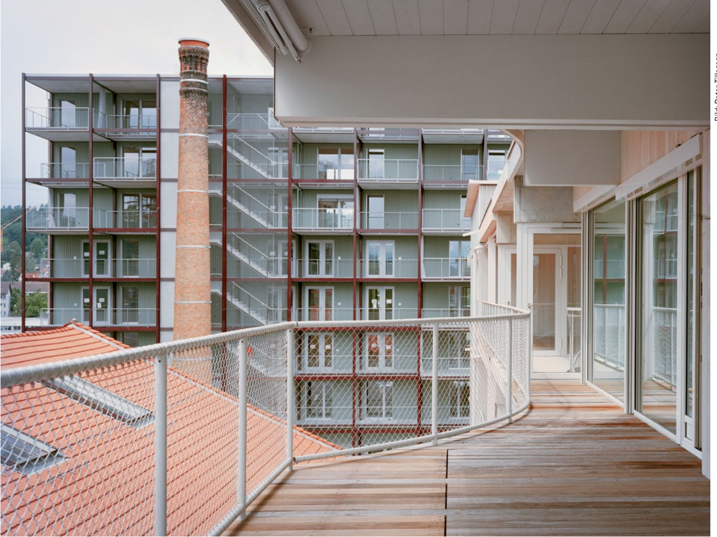
Auf dem Hobelwerk-Areal stand klimaverträgliches Bauen im Fokus. Blick vom Balkon des Re-Use-Gebäudes (Haus D) auf den Holzmodulbau (Haus C). Das Dach links gehört zur erhaltenen Hobelwerkhalle, der Kamin zeugt von der Industrievergangenheit.

Baugenossenschaft «Mehr als wohnen» stellt ihre Überbauung Hobelwerk-Areal in Oberwinterthur fertig