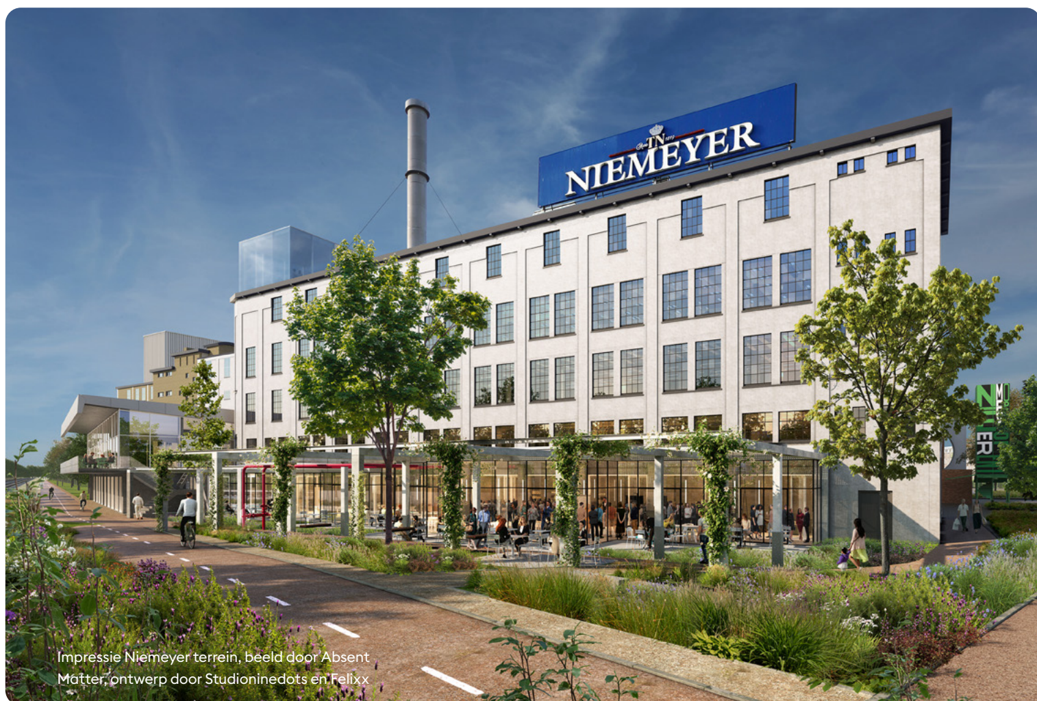
Impressie Niemeijer terrein, beeld door Absent Mätter, ontwerp door Studioninedots en Felixx

ook voldaan te worden aan randvoorwaarden op het gebied van onder meer financiering, ruimte, energie en koeling, marktvrage en regionale inbedding. Dit strategisch plan beschrijft hoe in Groningen wordt gewerkt aan een schaalbare, veilige en bestuurbare AI-infrastructuur, ingebed in een actief ecosysteem van kennisinstellingen, bedrijven en publieke organisaties. De voorgestelde aanpak operationaliseert bestaande nationale en Europese beleidskaders, waaronder Digitale Open Strategische Autonomie (DOSA), door te sturen op digitale autonomie, digitale veiligheid en federatieve samenwerking.