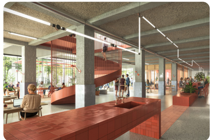
Impressie interieur Niemeyerfabriek, beeld door Surrend3r, ontwerp door Studioninedots