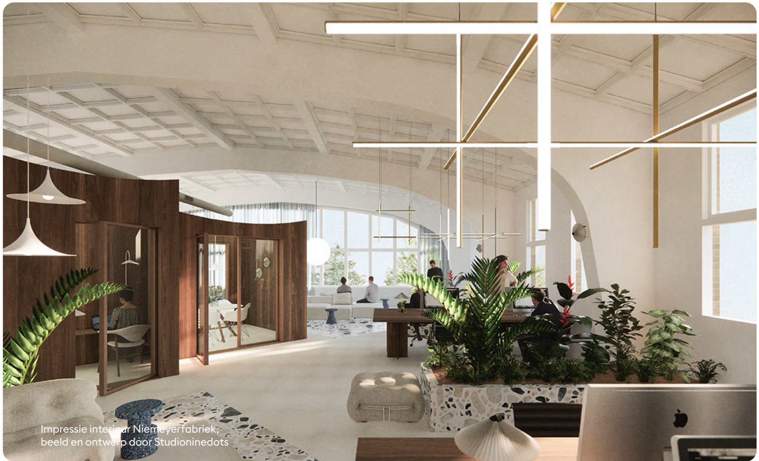
Impressie interieur Niemeyerfabriek, beeld en ontwerp door Studioninedots