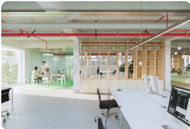
Impressie interieur Niemeyerfabriek, beeld en ontwerp door Studioninedots

Tegelijkertijd zorgen deze use cases voor zichtbare maatschappelijke en economische effecten . Ze maken concreet hoe AI kan bijdragen aan betere publieke dienstverlening, efficiëntere processen en nieuwe vormen van waardecreatie. Daarmee creëren launching customers niet alleen vraag naar AI-infrastructuur, maar ook het maatschappelijke en politieke draagvlak dat nodig is om het initiatief duurzaam te laten groeien. Zo ontstaat een vliegwiel waarin toepassing, infrastructuurgebruik en publieke waarde elkaar versterken