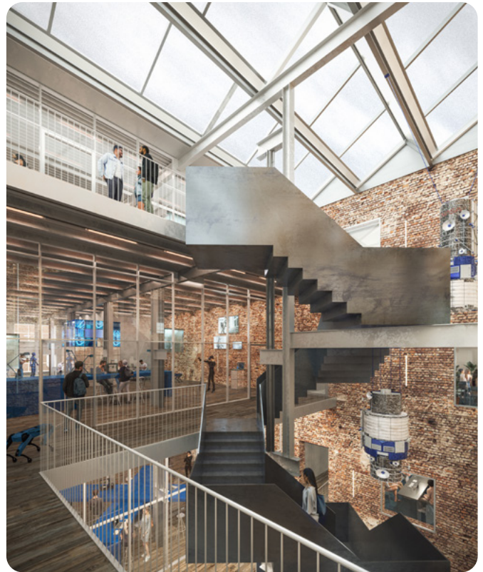
Impressie interieur Niemeyerfabriek, beeld door Surrend3r, ontwerp door Studioninedots

De AI-gigafabriek vormt hierop een logische vervolgstap: van pilot en experiment naar structurele, grootschalige AI-infrastructuur die regionaal is ingebed en nationaal en Europees rendeert. Zo levert Groningen een ontbrekende schakel in het nationale AI-ecosysteem: een plek waar AI-capaciteit, toepassing en economische waardeontwikkeling samenkomen.