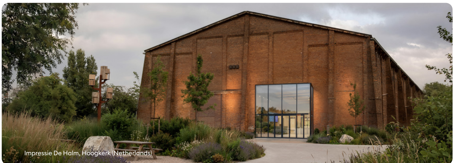
Impressie De Halm, Hoogkerk (Netherlands)

De waardepropositie van de AI-gigafabriek is dat deze partijen kunnen innoveren op een betrouwbare, schaalbare infrastructuur, zonder concessies te doen aan moderne technieken, dataveiligheid, governance of autonomie. Tegelijkertijd stimuleert de fysieke nabijheid van infrastructuur, data en expertise samenwerking, kennisdeling en versnelling van adoptie.