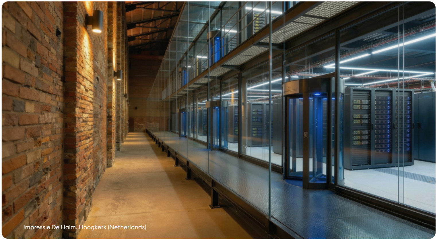
Impressie De Halm, Hoogkerk (Netherlands)

Het ecosysteem kenmerkt zich daarnaast door ondernemerschap en daadkracht . In Groningen wordt niet alleen gesproken over AI en digitale infrastructuur, maar ook daadwerkelijk gebouwd. Met locaties zoals het Niemeyer-complex en De Halm is door ondernemers en bedrijfsleven reeds meer dan 175.000m 2 fysieke ruimte gecreëerd voor digitale innovatie, samenwerking en opschaling. De Niemeyer Digitale Campus wordt daarin een centrale locatie voor talent binnen dit ecosysteem.